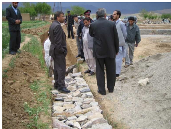
د لوگر ولایت د سرخ اب دانجونو د ښوونځي د کار له بهیر څخه کتنه (لوگر)