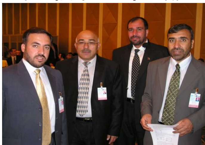
له کینیې خوا نه لطف الله مشعل ، ډگر جنرال هلالالدين هلال ، جنرال عبدالرحمن او شاه محمود میاخیل (دوچه قطر)