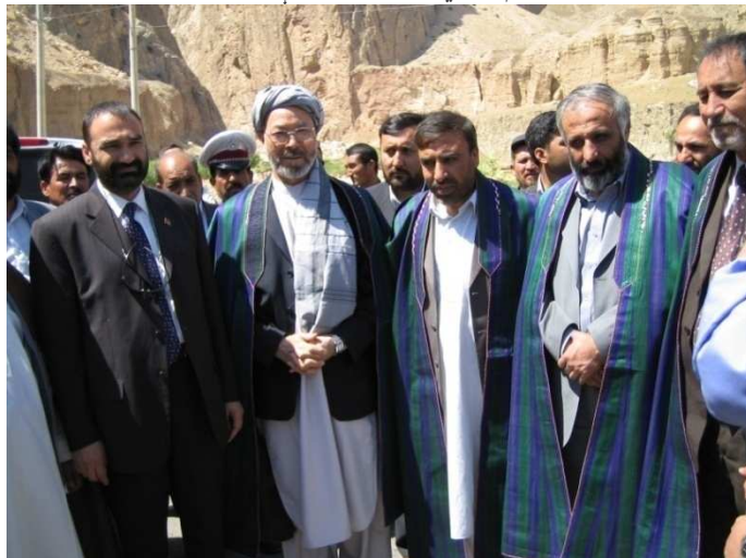
د تاشقرغان په سیمه کې د بلخ والي عطا محمد نور د کابل څخه ورغلي پلاوی سره خدای په