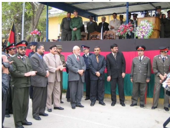
د پولیسو دفراغت او شهادتنامو د ویشلو مراسم د بنې خوانه ډگر جنرال نورالله خل ، ډگر جنرال شیرآغا روحانی ، امنیتي معین بناغلی ضرار احمد مقبل ، شاه محمود میاخیل ، ډگر جنرال سید محمد خان ، تورن جنرال سید کمال سادات او ډگر جنرال صبغت الله صایق