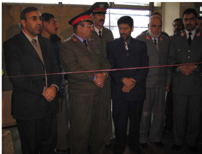
د کورنیو چارو وزارت د پیژنتون د اسنادو د کمپیوټري کولو مراسم: د کښې خوانه شاه محمود میاخیل، جنرال شیراغا روحاني، انجنیر محمد حسیب لطیفی، جنرال سید محمد خان او جنرال محمد ناصر هاشمی