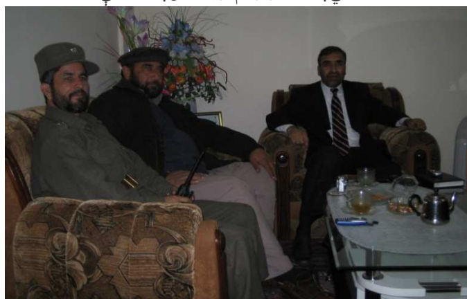
شاه محمود میاخیل د کنړ ولایت د امنیه قوماندان جنرال مطیع الله خان ساپي او د کورنیو چارو وزارت د قرارگاه د قوماندان سمونوال عبدالوحید سره (د کورنیو چارو وزارت)