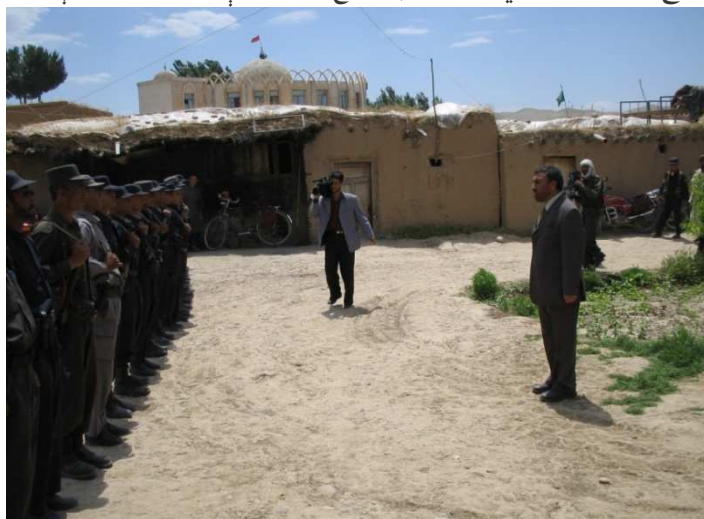
د بلخ ولایت د شولگری ولسوالۍ د پولیسو د قطعي معاینه