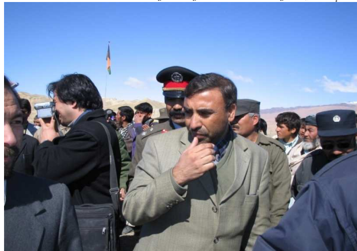
شاه محمود میاخیل په بامیانو کې د قومي مشرانو او د کورنیو چارو وزارت د منسویینو په منځ کې (بامیان)