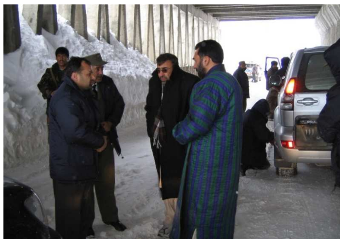
بغلان ته دنوي والي جمعہ خان همدر د معرفي کولو لپاره تڼي او په سالنگونو کې د زیاتو واورو وړیدو له امله ودریدل