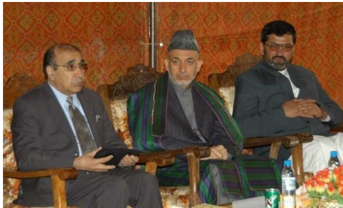
له چپې خوا کورنیو چارو وزیر علي احمد جلالی ، دافغانستان ولسمشر حامد کرزی او د لوگر والي محمد امان حمیمي (لوگر د محمد اغي ولسوالی)