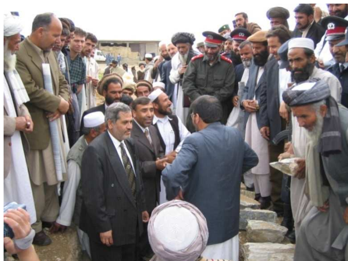
د لوگر ولایت د ودانۍ د بنسټ اېښودلو مراسم (لوگر)