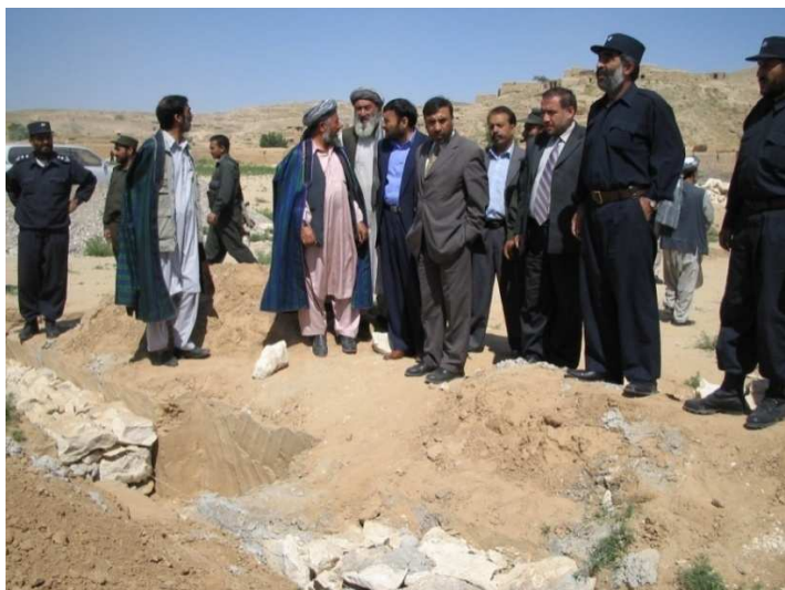
د بلخ ولایت د شولگری ولسوالي د ودانۍ د کار له بهیر څخه لیدنه