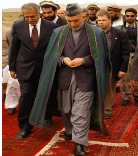
ولسمشر حامد کرزی او دامریکا سفیر زلمی خلیل زاد