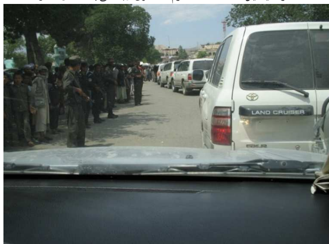
شمالي ولايتونو ته د كاري سفر د موټرو د كاروان يوه بيلگه