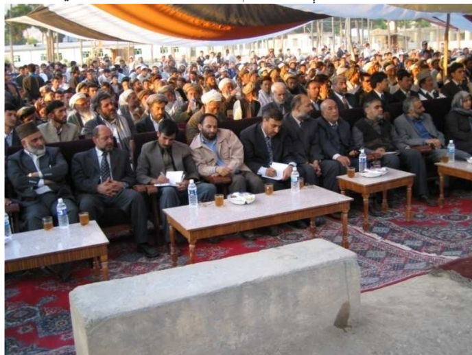
د شمال دکاري سفر په ترڅ کې په ایبکو ښار کې په هغه غونډه کې گډون چې د کابل څخه د ورغلي پلاوی لپاره جوړه شوې وه