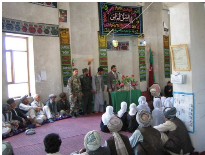
د بلخ ولایت د شولگری ولسوالۍ په جامع جومات کې د خلکو سره خبرې