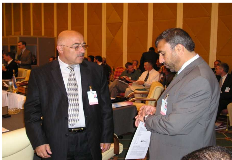
ډگر جنرال هلالالدين هلال او شاه محمود میاخیل (دوچه قطر)