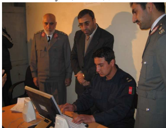
د کورنیو چارو وزارت د پیژنتون د اسنادو د کمپیوټري کولو نه کتنه