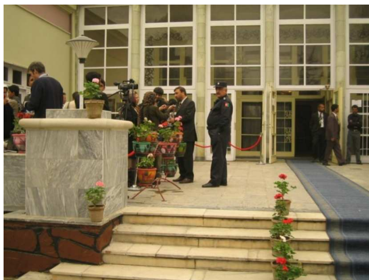
په صدارت کې له رای اچونې وروسته شاه محمود میاخیل له خبریالاتو سره خبرې کوي