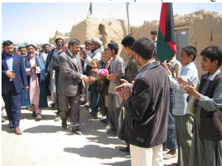
د بلخ ولایت د شولگری ولسوالي د خلکو سره کتنه