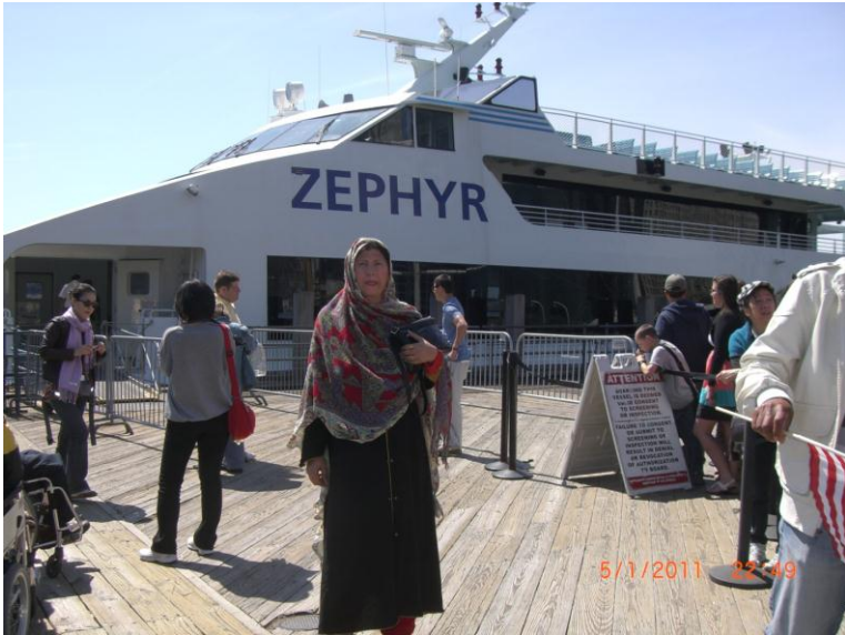
کشتی کی د کیناستو نه وړاندې