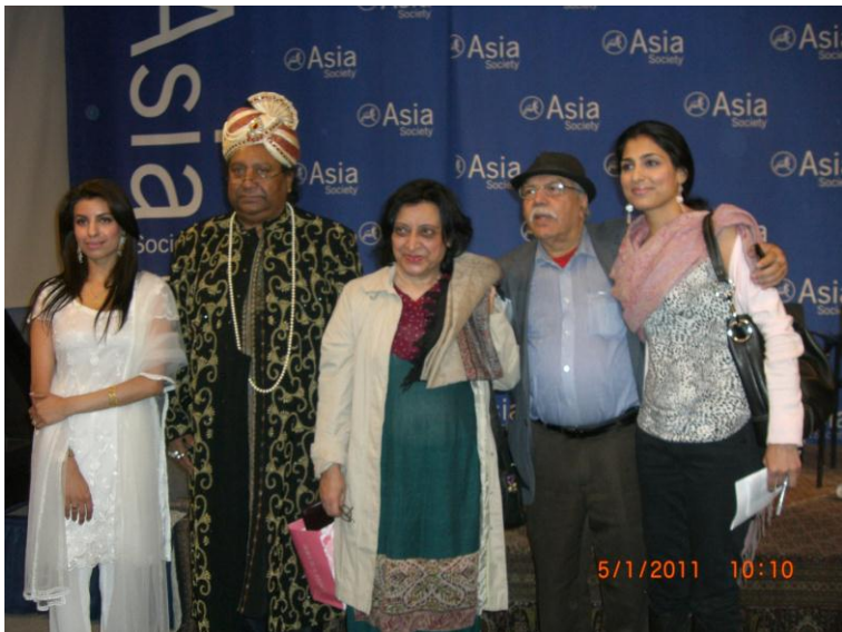
په نیو یارک کې د اردو ژبې له لیکوالو سره