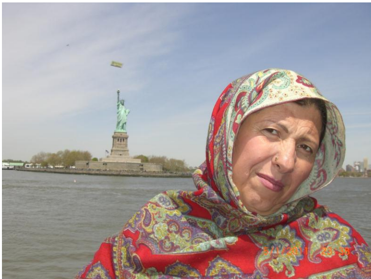
د سمندر غاړه نيو پارک