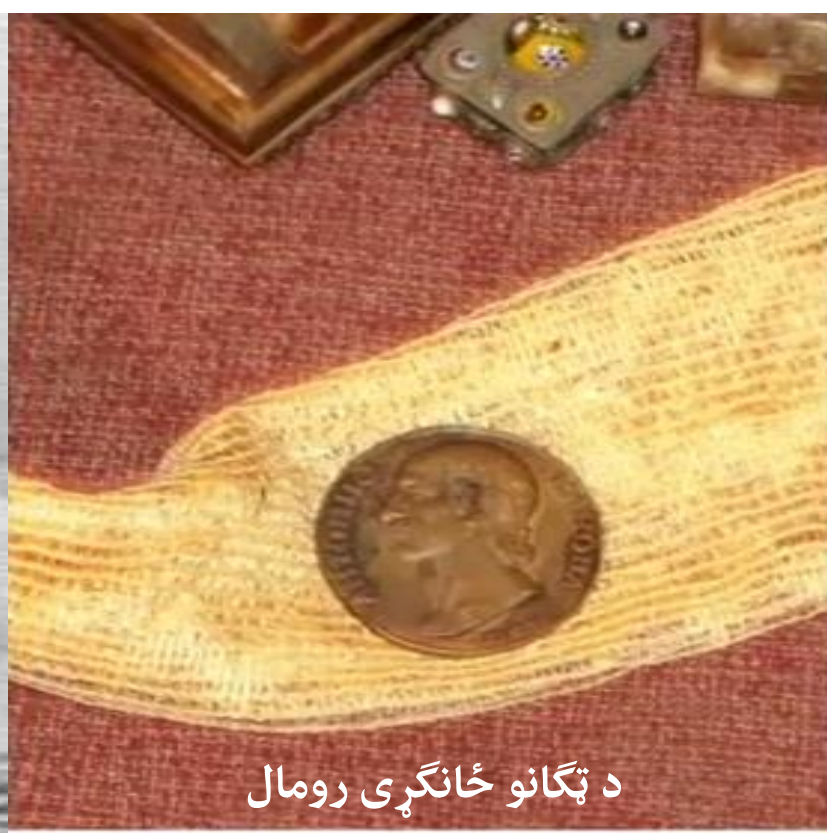
د ټگانو ځانگړی رومال