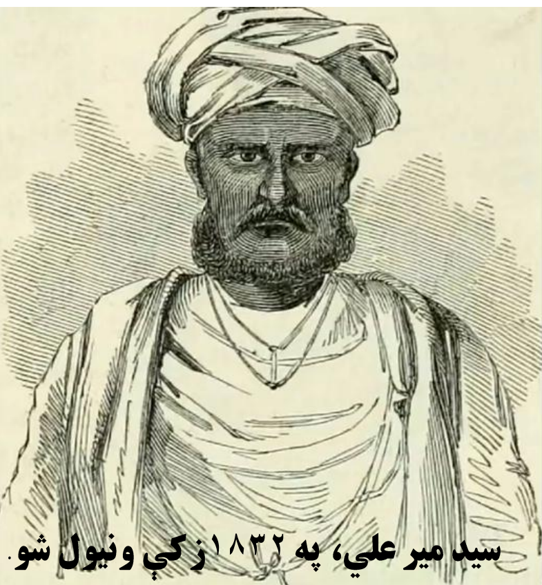
سید میر علی، په ۱۸۳۲ ز کې و نیول شو.