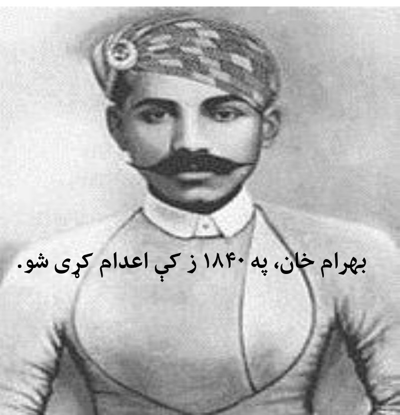
بهرام خان، په ۱۸۴۰ ز کې اعدام کړی شو.