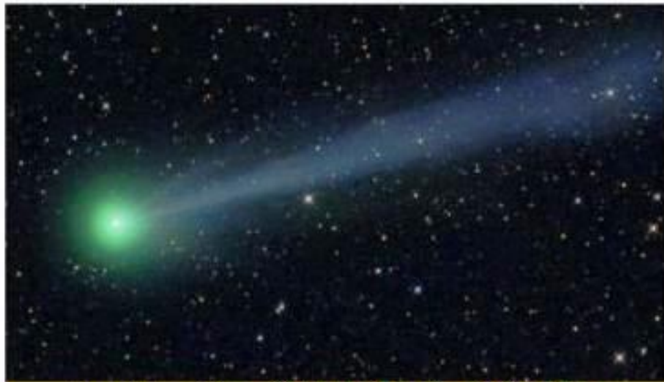
« وَالنَّجْمِ إِذَا هَوَىٰ * مَا ضَلَّ صَاحِبُكُمْ وَمَا غَوَىٰ . » (النجم، ۵۳ / ۱ - ۲)