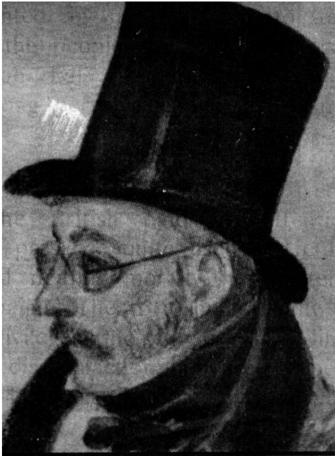
Sir William McNaughten سر ویلیام مکناٹن