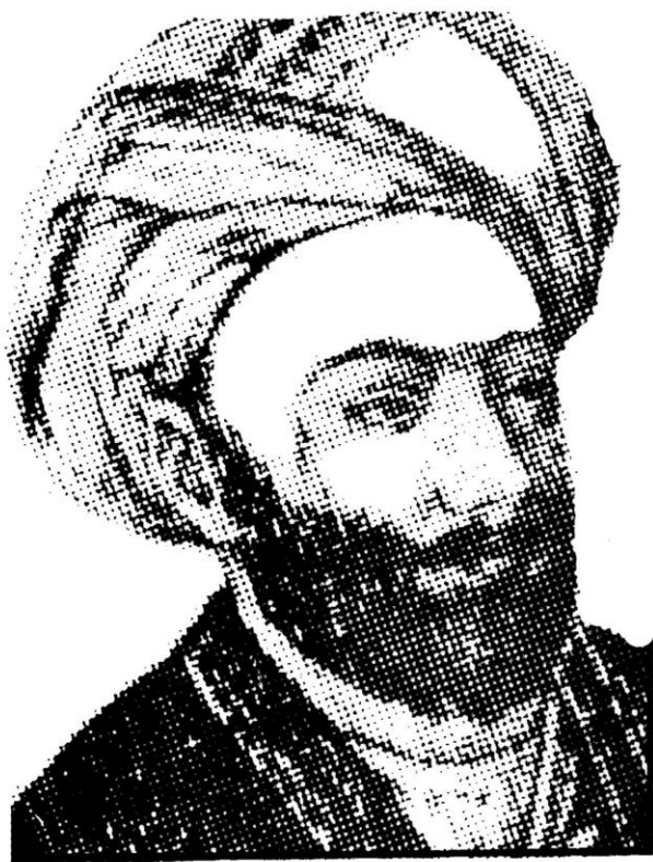
سردار پردل خان Sardar Pur Dil Khan Ruler of Kankahar