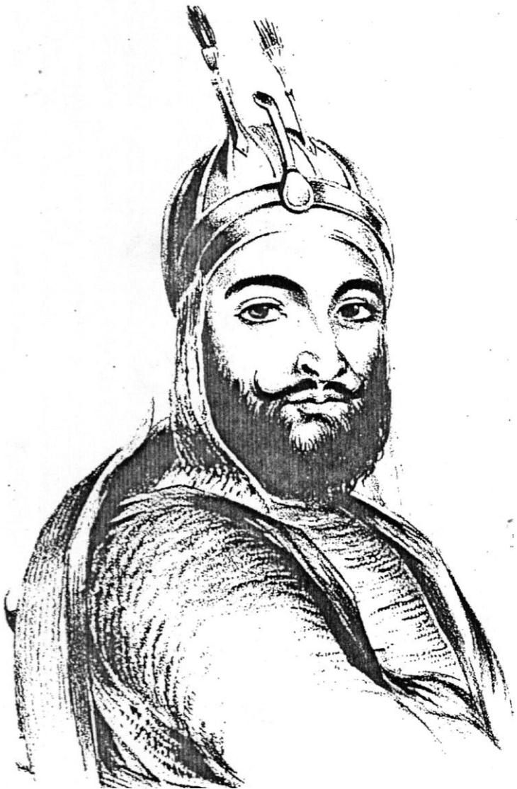
Sardar MAHOMED AKBER KHAN وزير محمد اکبر خان