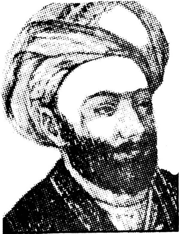
سردار پردل خان Sardar Pur Dil Khan Ruler of Kankahar