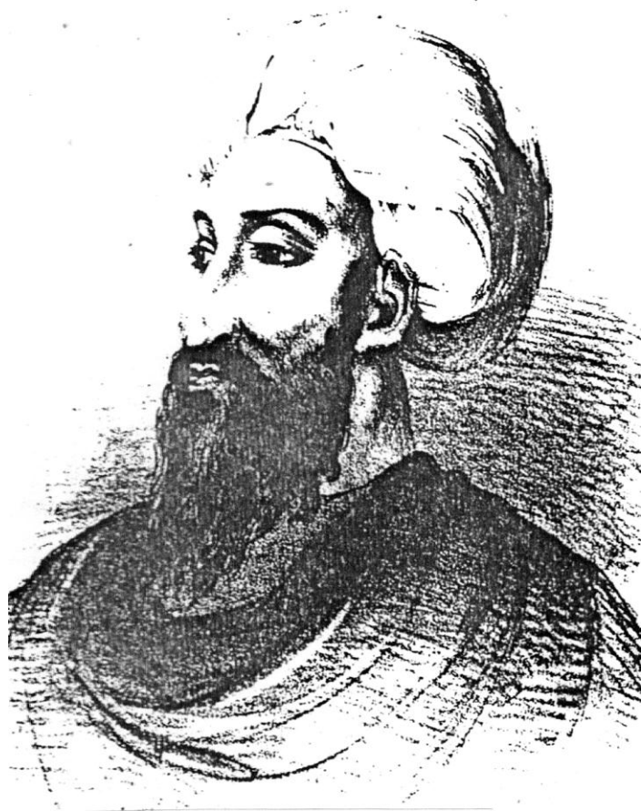
Amir Dost Mahammad Khan 1836-1839---1842-1863 امير دوست محمد خان