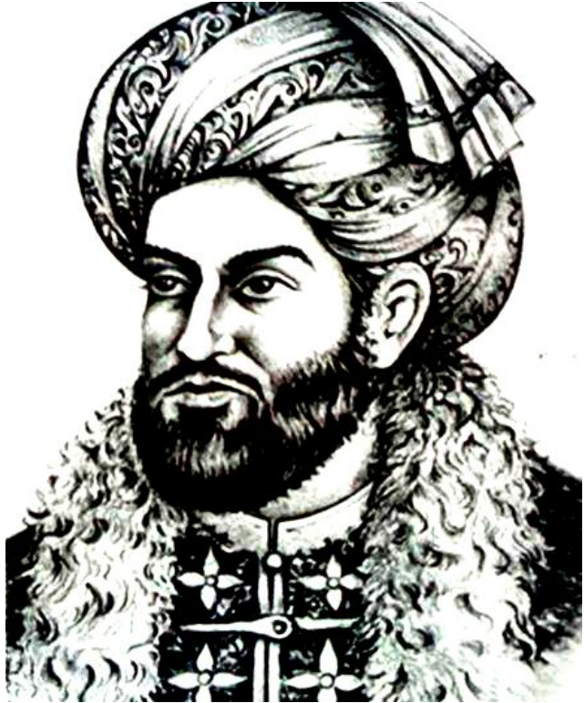
Ahmad Shah Durrani Founder of Modern Afghanistan لوی احمد شاه بابا