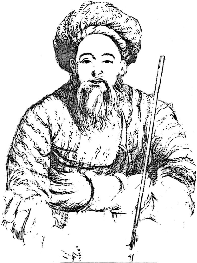
قاضی محمد حسین (نمایندهء شاه شجاع) QUAZI MAHOMED KHAN