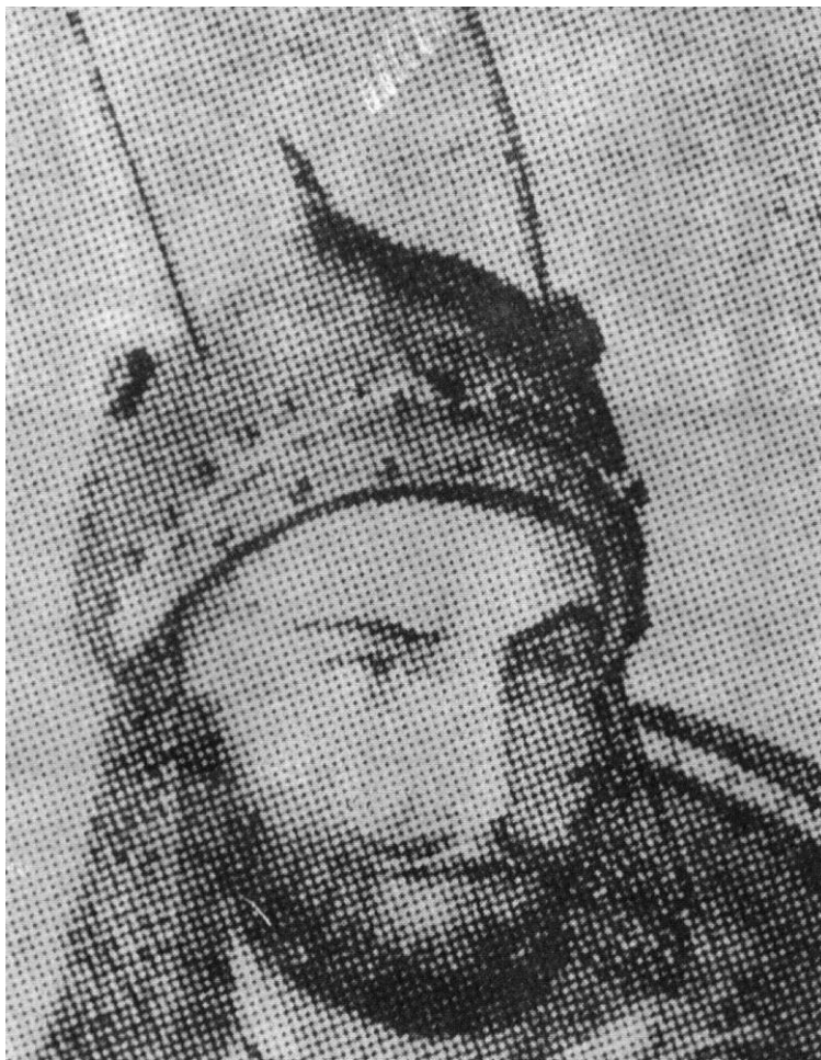
Sardar Sher Dil khan Ruler of Kandahar سردار شیردل خان