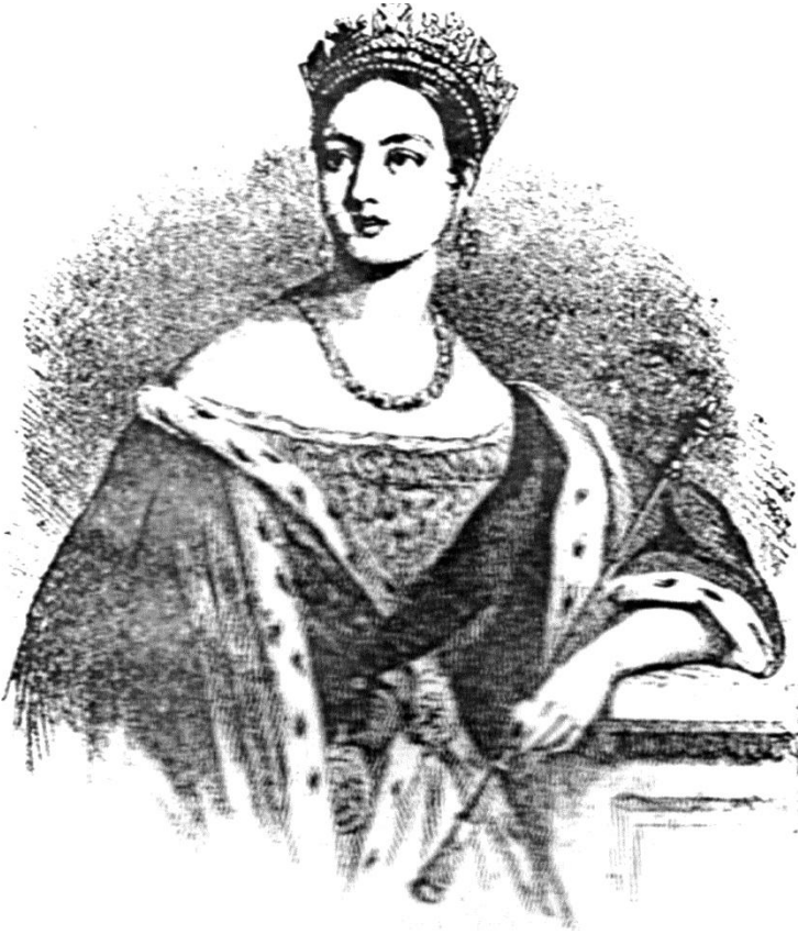
HER MAJESTY VICTORIA علیاحضرت ملکہ ویکتوریا