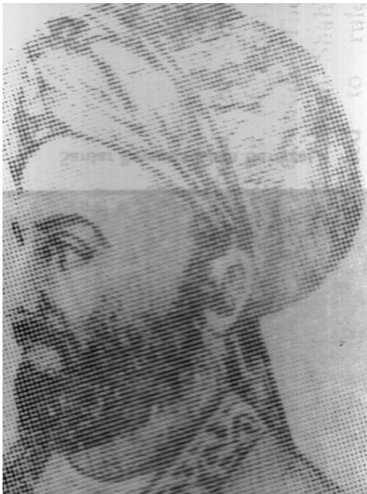
سردار محمد عظیم خان ولد سردار محمد پاینده خان Sardar Mohammad Azim Khan