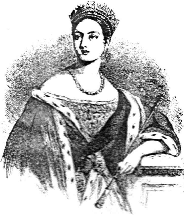
HER MAJESTY VICTORIA علیاحضرت ملکہ ویکتوریا