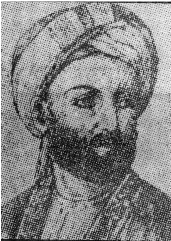
Prince Ayub son of Timur Shah شہزادہ ایوب فرزند تیمورشاه