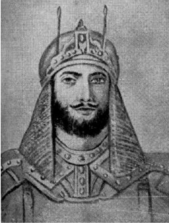
Wazir Fateh Khan, The King-Maker وزیر محمد فتح خان ولد سردار پاینده محمد خان