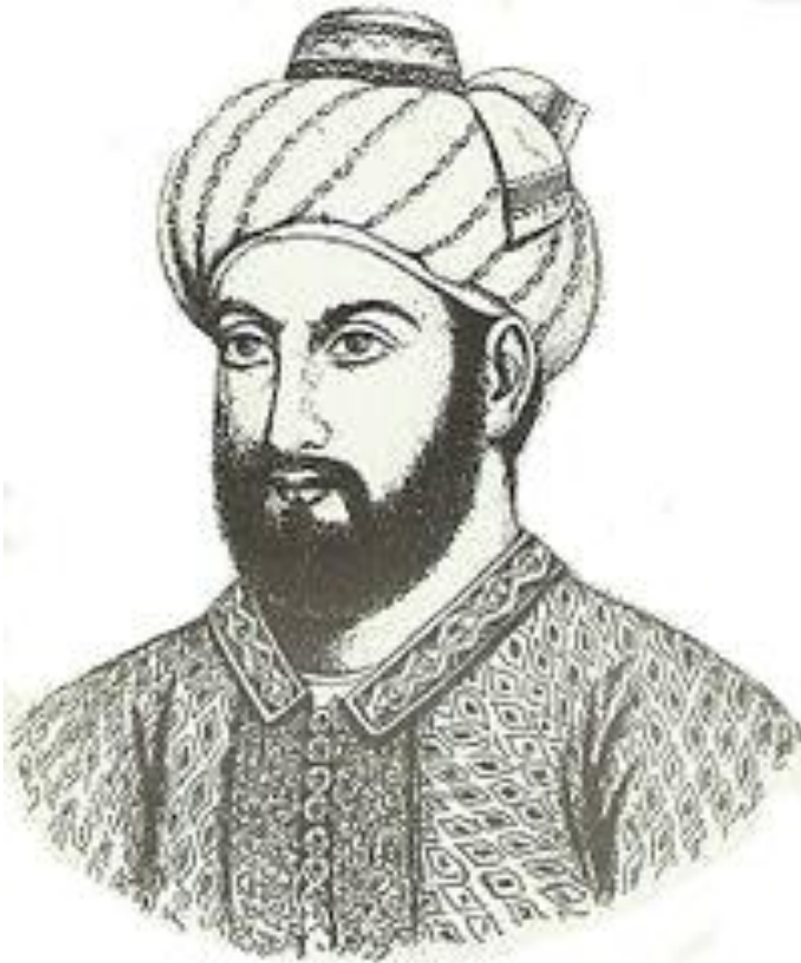
Timur Shah Durrani 1763-1793 اعلیٰ حضرت تیمور شاہ درانی