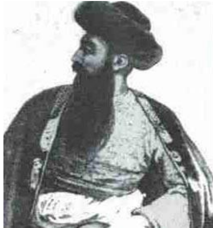
Shah shuja son of Timur Shah 1803–9, 1839–42 شاه شجاع ابن تیمور شاه

عنصر پر قدرت دیگری که در منطقه به تحرک شروع کرده، دین مبین اسلام است. اگر چه دولت امریکا سعی بلیغ به خرج می دهد تا چهره عملیات نظامی خود را ضد تروریستی و موقتی نشان دهد، اما همه کشورهای مسلمان منطقه، این عملیات را در عین حال ضد اسلامی می پندارند و اقدامات جنرال پرویز مشرف به پیروی از اهداف امریکا در پاکستان، احساسات احزاب اسلامی آن کشور را جریحه دار ساخته است. هرگاه این تحرک انسجام یابد، امنیت و استقرار در پاکستان شدیداً متاثر می شود؛ آن وقت است که احتمال متحد شدن پشتون های هر دو طرف سرحد، قوی تر شده، بل نصح می گیرد.