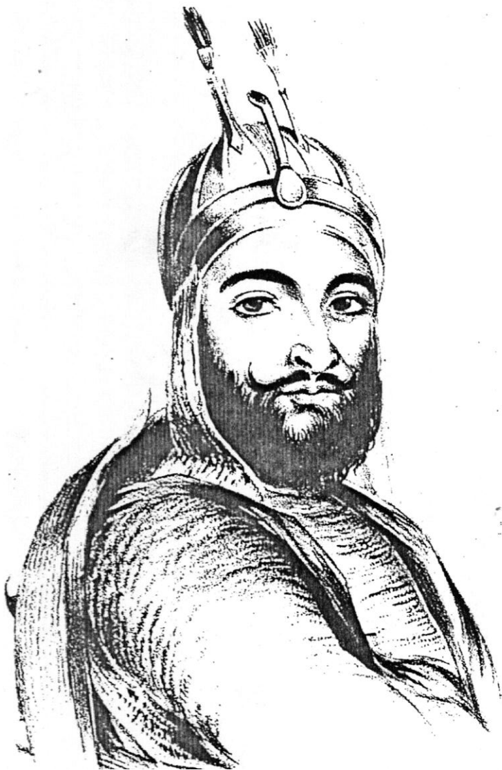
Sardar MAHOMED AKBER KHAN وزير محمد اکبر خان