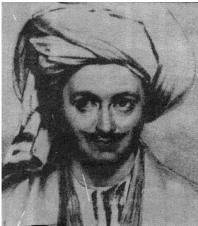
Sir Alexander Burnes British political agent in Kabul in Afgan dress