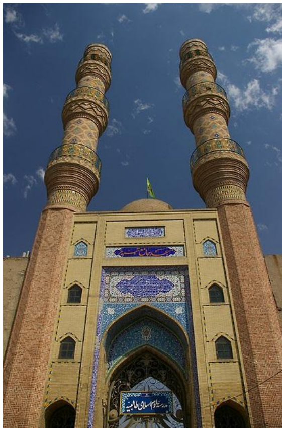
مناره های و سر در ورودی مسجد جامع تبریز

در مورد محراب این مسجد اوضاع بسیار خنده دار است چون کپی برابر اصل محراب مسجد جامع اصفهان را در اینجا می بینیم که دقیقا ثبت با سند مطابقت دارد .