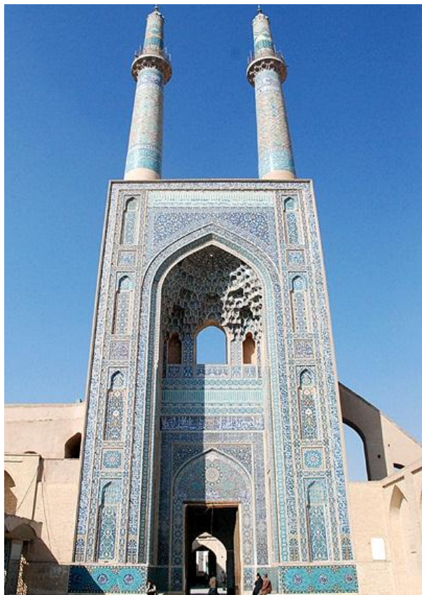
مناره های و سر در ورودی مسجد جامع یزد

مناره های مسجد جامع تبریز هم نوساخته هستند و بعدا به این بنا اضافه شده اند . قرینه این مناره ها و سر در ورودی را در مسجد نو کاشیکاری شده یزد می بینیم . به زودی سازمان میراث فرهنگی دست به کار می شود و مناره های مسجد جامع تبریز را نیز کاشی کاری می کنند تا از قلم نیفتند و از وضع ناراحت کننده کنونی رهایی می بخشد ! .