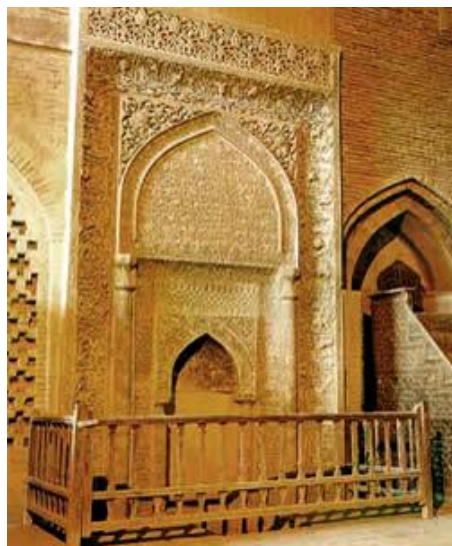
محراب مسجد جامع اصفهان

در مورد محراب این مسجد اوضاع بسیار خنده دار است چون کپی برابر اصل محراب مسجد جامع اصفهان را در اینجا می بینیم که دقیقا ثبت با سند مطابقت دارد .