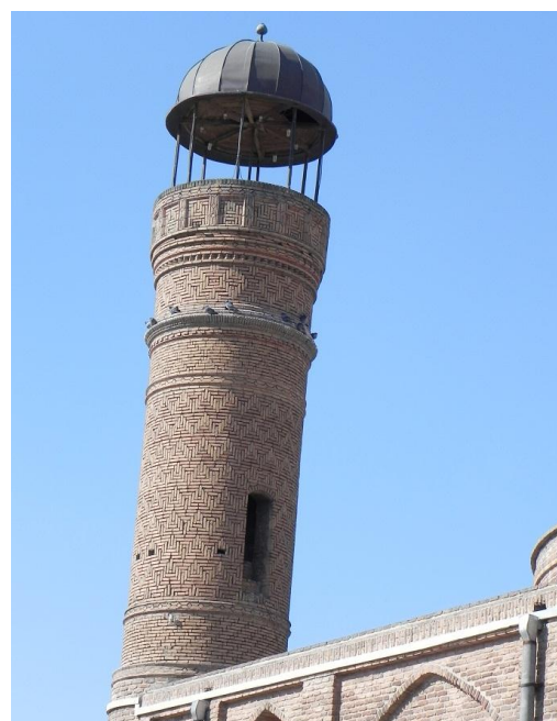
عکس بالا مربوط به مناره سمت راست بنا می باشد