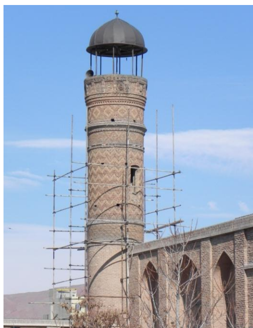
عکس بالا مربوط به مناره سمت چپ بنا می باشد

رسامی بالا به هیچ وجه نمی تواند از روی کنونی تهیه شده باشد چون تفاوت زیادی با وضع فعلی دارد . شاید مربوط به قبل از تخریب مسجد توسط عثمانی های مسلمان باشد ! شاید هم مربوط به قبل از زلزله سال 1193 ه باشد ! شاید هم مربوط به قبل از بازسازی به وسیله مترجم کنسولگری شوروی باشد ! در این چند ساله فقط این موضوع را خواننده بودیم که مترجم مرمت کار بنا یا معمار باشد ! البته اینجا ایران است و هر اتفاقی ممکن است پیش بیاید .