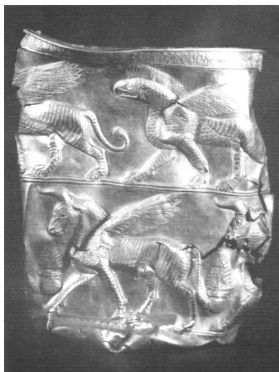
یکی از جام‌های طلایی تقلبی منسوب به چراغعلی‌تپه (با نام ساختگی مارلیک)، رودبار گیلان

دروغین و تاریخ‌سازان و نشریاتی که واقعیت‌ها را فدای جلب توجه مخاطب می‌کنند، می‌سازند و می‌پرورند.