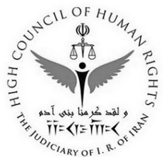
قوه قضائیه جمهوری اسلامی ایران سند حقوق بشر