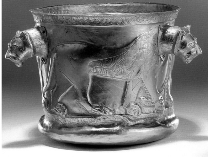
جام طلائی تقلبی منتسب به کلاردشت مازندران

تقلبی کشف بقایای ارتش کمبوجیه در مصر) چگونه حیثیت ما و باستان‌شناسی ما را مضحکه و مسخره جهانیان می‌کند؟ آیا می‌دانند که همگان ما را به چشم موجودات حقیر و نیازمند توجهی می‌نگرند که داشته‌های اصیل و گرانقدر خود را رها کرده و به دنبال موهومات افتاده‌اند؟