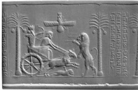
مهر مشکوک داریوش هخامنشی

مُهر استوانه‌ای عقیق و مشهور و سالم داریوش هخامنشی دقیقاً در چنین شرایط محیرالعقولی در مصر پیدا شده است. شرایطی که علاوه بر همه عجیب و غریب بودن‌هایش، حتی شخص کاشف و محل کشف آن نیز ناشناخته و مجهول مانده و هیچگونه اطلاعات دقیقی از جزئیات آن داده نشده است. در عموم کتاب‌ها و نیز در وبسایت موزه بریتانیا (محل نگهداری این مهر) چنین آمده که: «گفته شده در یک مقبره در ناحیه تیس در مصر پیدا شده است». اما بیان نشده که این حرف را چه کسی گفته؟ چه کسی آنرا کشف کرده و در کدام مقبره و در کجای آن مقبره و در طی کدام عملیات کاوش؟ و چرا هیچگونه اطلاعاتی در این باره عرضه نشده و چنین خواسته‌اند تا همگان کورکورانه و به صرف اعتماد بیجا به اشخاص و نهادها و موزه‌ها این ادعاها را بپذیرند؟