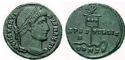
تصویر ۴. نقش لا باروم در پشت سکه‌ی کنستانتین اول

تصویر ۳. تابوتی از قرن چهارم میلادی با نمادهای مسیحی. نشانه‌ی داخل حلقه‌ی گل با یک خط تیره‌ی قائم I (حرف اول Ιησούς=عیسی در زبان یونانی) و نماد شبیه X (نماینده‌ی حرف یونانی خی، حرف اول Χριστος=مسیح در زبان یونانی) ایجاد شده است.