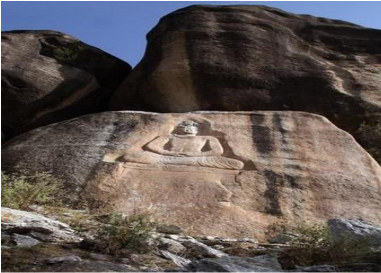
د سوات په جان آباد کې پریوه پر شه د بدها لرغونې مجسمه