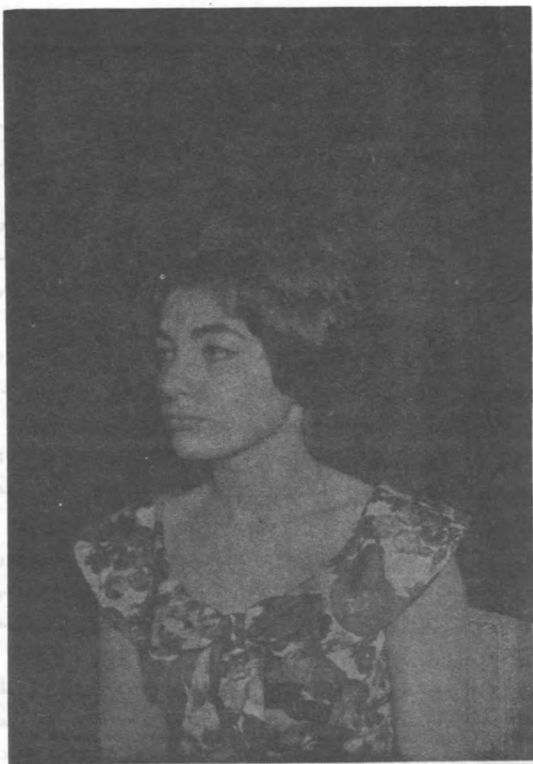
آیا این دختر محمدرضا پهلوی است و یا دختر ارنست پرون سوئیسی؟!؟