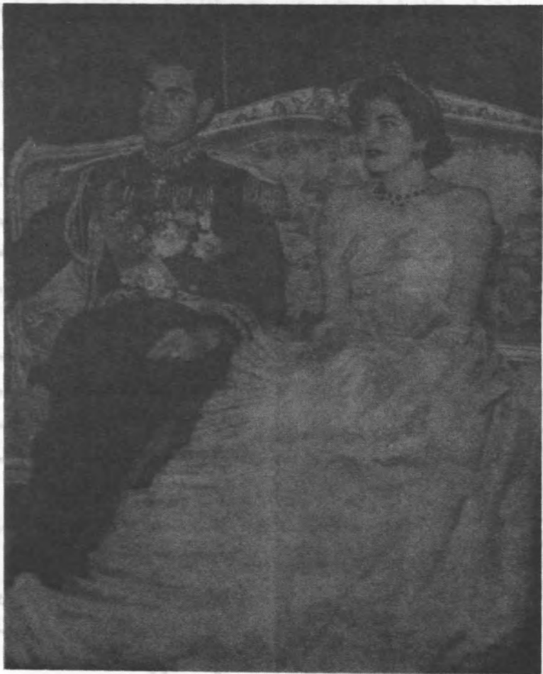
تصویری از عروسی شاه و ثریا

پروا بود که در این مجلس عروسی شاه و ثریا که در روز چهارم ماه در آن وقت در آن مجلس عروسی شاه و ثریا که در روز چهارم ماه سلطنت می نماید ولی در سلطنت این محرابه در آن وقت در آن مجلس سلطنت می نماید ولی در سلطنت این محرابه در آن وقت در آن مجلس سلطنت می نماید ولی در سلطنت این محرابه در آن وقت در آن مجلس