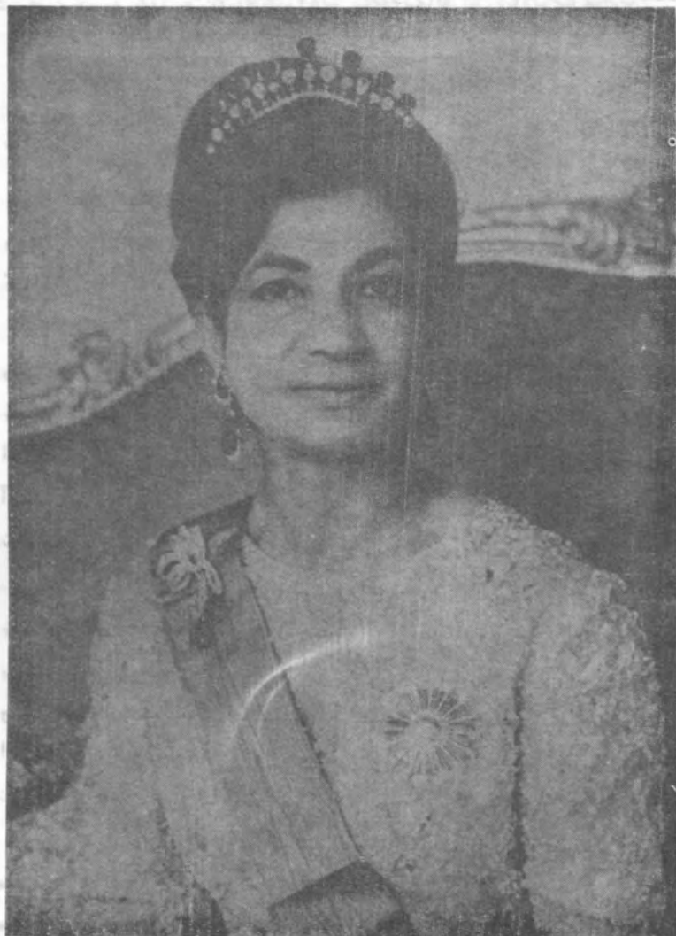
عکس از شاه اصلی ایران

با این رویدادها که در تاریخ ایران و جهان و در همه جا در تاریخ و ادب و هنر و علم و ادب ایران و جهان و در همه جا در تاریخ و ادب و هنر و علم و ادب ایران و جهان و در همه جا در تاریخ و ادب