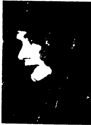
Sufi, die 21-jährige Schah-Freundin

اکنون باید با نظر تعمق به فکر نشست که شاه ایران که دارای همسر و چهار