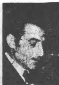
کریم پاشا بهادری وزیر اطلاعات و جهانگردی