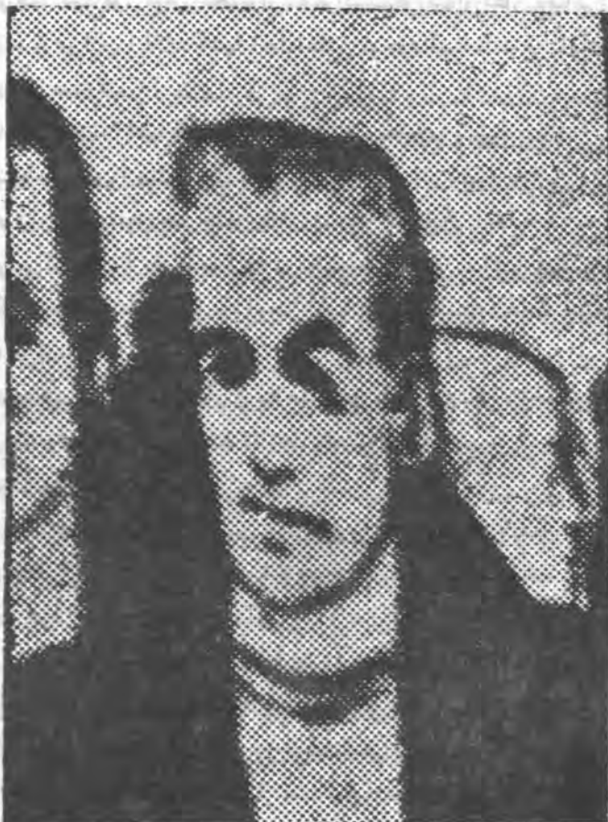
عکس شاه ایران بر سر در کلوپ هم جنس‌بازان نیویورک!

مرد زن داری با اتومبیل بطرف میدان "باگ هوس" شیکاگو میراند تا با هم جنس‌بازانی که در اطراف این میدان کار می‌کنند تماس حاصل کند یک گروه‌باز می‌گوید: این مردان به زنهای خود می‌گویند برای خرید روزنامه عصر از خانه خارج میشوند و با همان دمیائی به این مکان می‌آیند.