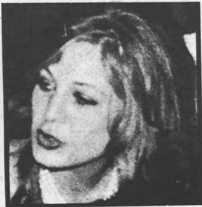
عکسی از طلا

علم پشت سر شاه حرکت میکرد و مهمانهای تازه را به حضور شاه معرفی مینمود. کامبیز آتابای هم که نقش مهمی در ماجرا داشت در مهمانی حاضر بود و به محض آنکه شاه نزدیک شد طلا و خاله‌اش را به جلو صف کشانید تا شاه متوجه آنان شود ( و نمایشنامه تکمیل گردد!!) .