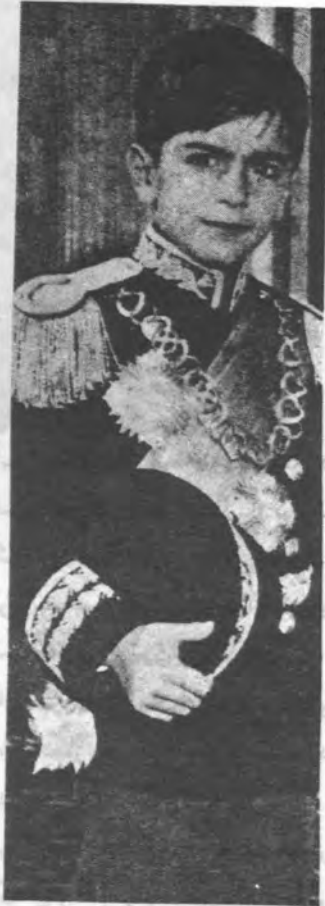
دربار ایران همیشه اصرار داشت که به شباهت کودکی شاه ولیعهد اشاره کند