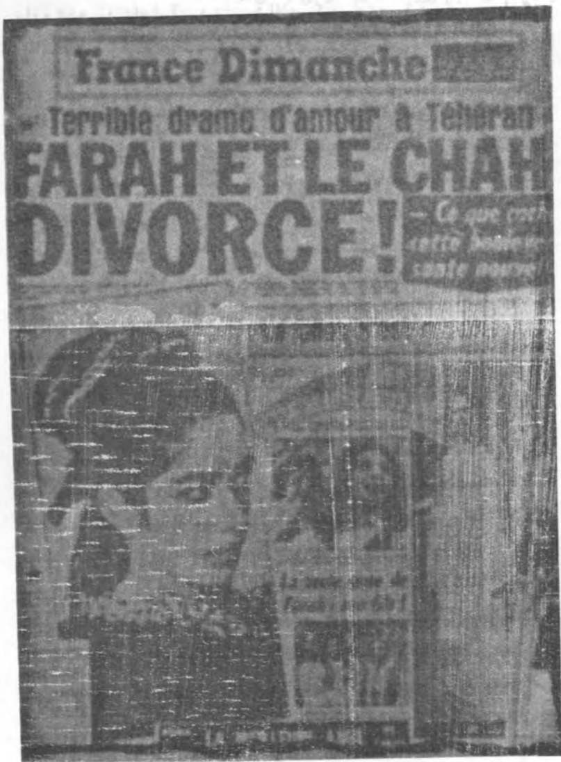
یک خیمه شب بازی حساب شده و ماهرانه !

تولیدی تا میانه عصر کنی مردم را بفرستند بیرون و در آنجا به جای ریه و (ششها) بفرستند آن را و آن را بفرستند بیرون و در آنجا بفرستند بیرون و در آنجا بفرستند بیرون