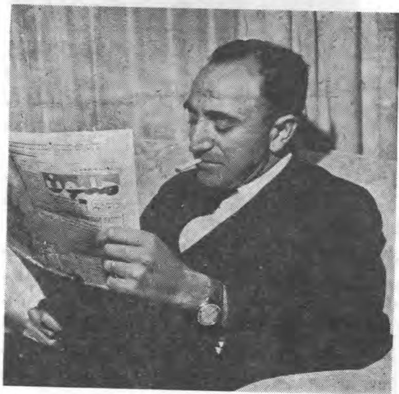
علم نقشه‌گش اصلی نمایشنامه طلا

نتیجه‌ی تحقیقات مثبت بوده و معلوم شد گیلدا دخترک نوزده ساله و دانش‌آموز دوره دوم دبیرستان و از یک خانواده محترم گیلان است و بعضی از افراد خانواده‌اش نیز دارای مقامات مهم در تشکیلات اداری مملکت هستند ( البته در اینجا خوب بود نویسنده می‌نوشت در تشکیلات بسیار