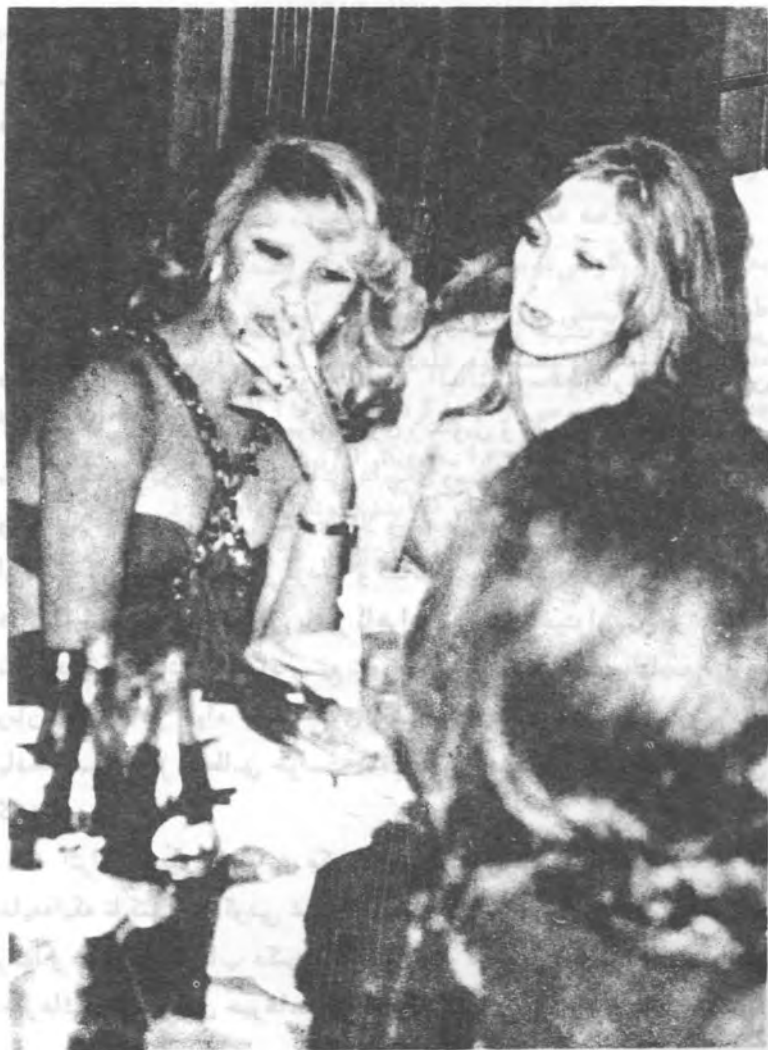
عکسی که از گیلدا ( طلا ) در سپیدوسپاه به چاپ رسید .

من فارسی را از استادان خود یاد گرفتم و بعد از آن به تدریس فارسی پرداختم و بعد از آن به تدریس فارسی پرداختم و بعد از آن به تدریس فارسی پرداختم و بعد از آن به تدریس فارسی پرداختم و بعد از آن به تدریس فارسی پرداختم و بعد از آن به تدریس فارسی پرداختم و بعد از آن به تدریس فارسی پرداختم