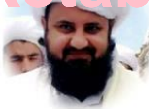
فیسوک غلام حضرت غلام