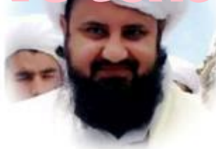
فیسوک غلام حضرت غلام