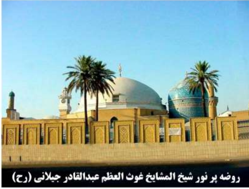
روضه پر نور شيخ المشايخ غوث العظم عبدالقادر جيلانى (رح)