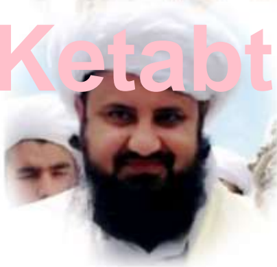
فيسبوك غلام حضرت غلام