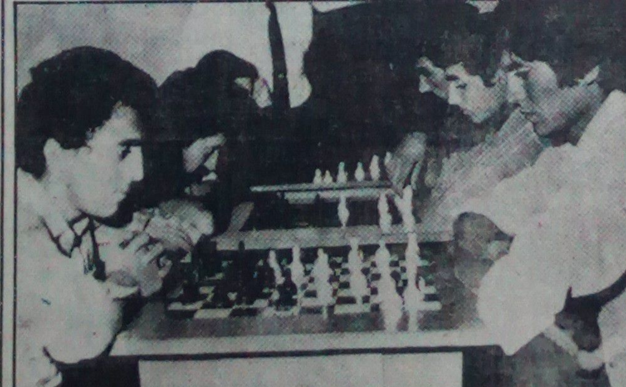
گوشه از مسابقات شطرنج که توسط ریاست عمومی تربیت بدنی و ورزش سازمان داده شده است.

تا ختم ربع سوم سال ۱۳۶۳ به اثر کار و فعالیت خستگی ناپذیر کمیته های حزبی و توجه عنیق گروپ ضربتی کار، که در محلات اعزام شده بودند بتعداد (۱۷) سازمان اولیه حزبی محل زیست جدید ایجاد گردید که شمار آن تا (۲۱) سازمان اولیه حزبی محل زیست رسیده است. به پیشوازیستین سالگرد پیمان گلدی ح. د. خ. ا. در ولسوالی دولت آباد (۳) سازمان اولیه در ولسوالی اند خوی (۳) سازمان اولیه در ولسوالی قیصار (۲) سازمان اولیه در شهر مینه (۶) سازمان اولیه محل زیست ایجاد گردید ماست.