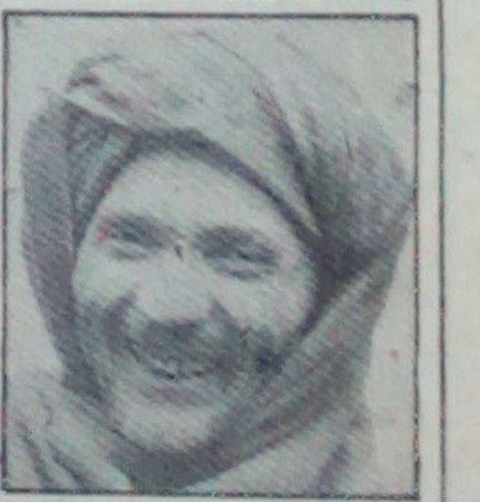
من حالا میدام که دوری از وطن و خانه چند ردها در رونج آورد است.