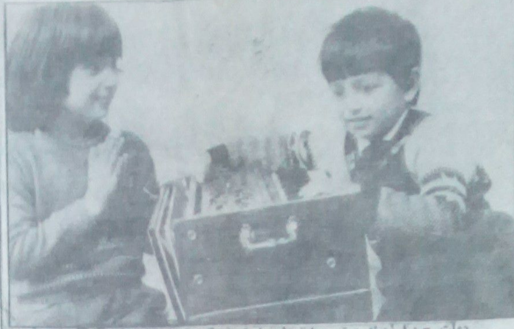
دولت چ. د. آ. زمینه پیشرو برای رشد استفاده کرد کلن میا ساخته است - دو عکس: افلاک کودستان وزیر ابر خان

خدا شده پدر پیروز که این تا شی از شنا پ پیشی در لبه آن است و فلم در ۱۶ روز شوت گردیده اینجا و آسیا درین آفرینش هنری سپهر ل ها و ناسد ها نیز پیشم میاید که بجای حرف ویدا نو که بیان - تصویر صریحی دارد - مثلا چهره و لاکه بر لعل و کلبه دالبر این امر و بیانگر امر صانع است. فلانی که باز میشود به مقا به مشکلات نا شنسی از چنگ و کلیدی که آریا باز بگفته نلو یخی است برای فلم گستره مهر را اند کسی