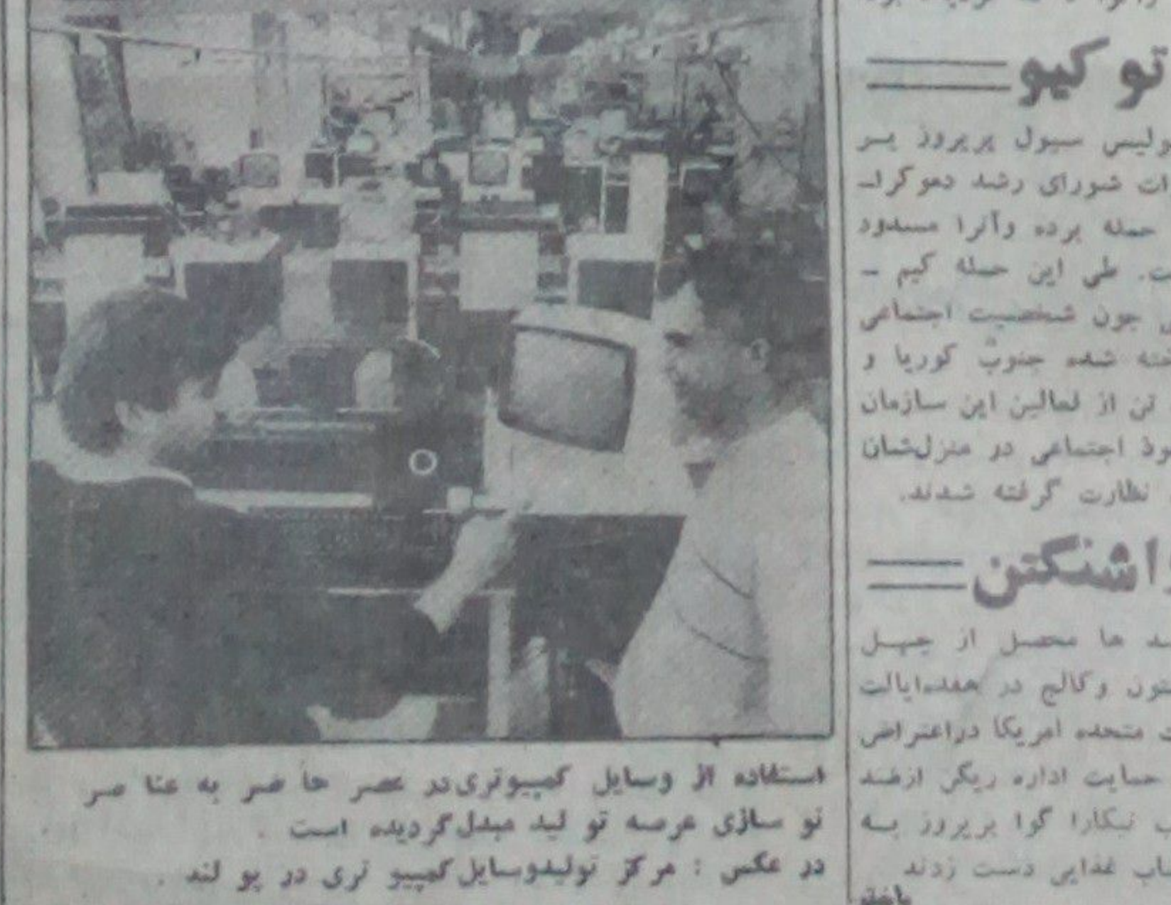
استفاده از وسایل کمپیوتری در عصر حاضر به عا صر نو سازی عرصه تولید مینال گردیده است. دو عکس: مرکز تولید وسایل کمپیوتری در یو لنه

برای این منظور آنها هر- گو نه تلاش را برای حفظ