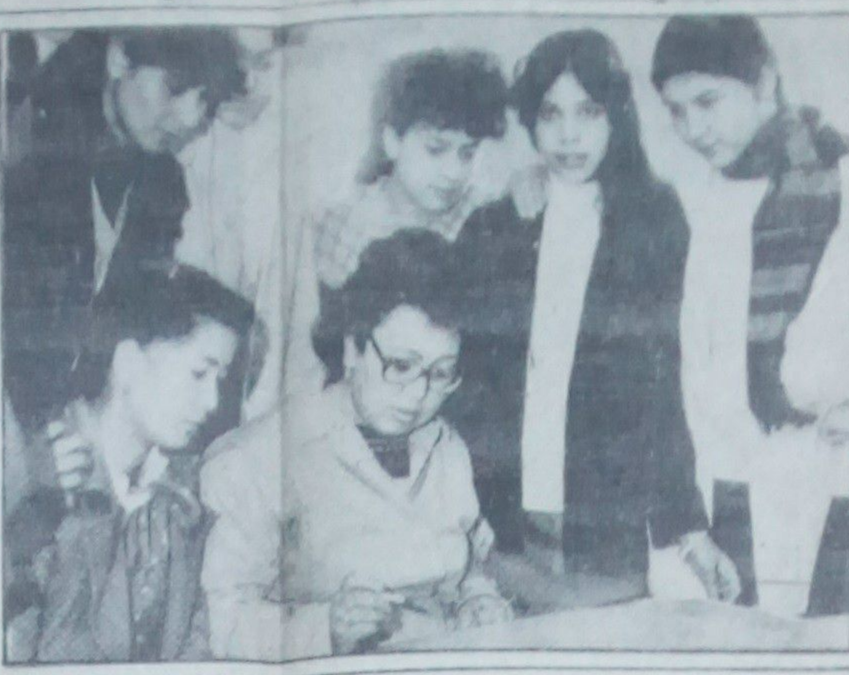
مجلسه عهده بر حلقه کونونی تکامل جنبش زن در کشور

در چند روز آینده هم آب آشامیدنی صحنی در دل‌ها جاری میشود و هم برق