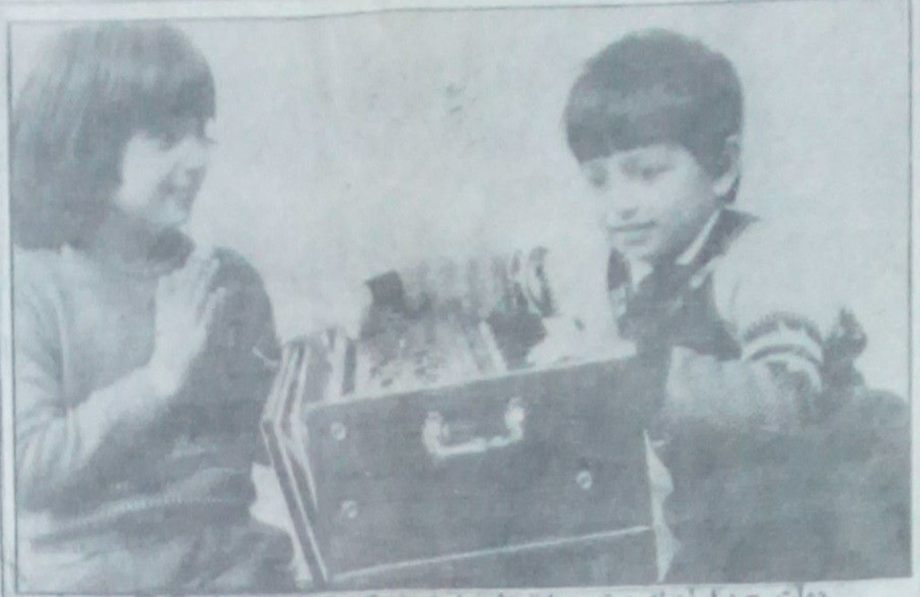
دولت چ.دا زمینه پیشرو برای رشد استفاده کرد کلمه میا ساخته است. دو عکس: افلاک کودستان وزیر اعلی خان

خدا شده پدر پیروزه که این تا شی از شتاب پیشی در لبه آن است و فلم در ۱۴ روز شوت گردیده اینجا و آنجا درین آفرینش هنری سبب ل ها و ساد ها تیسز پیشم میاید که بجای حرف ویا تو که پیا ن - تصویر صریحی دارد - مثلا چهره و لاکه بر لفل و کلبه دالیز این امر و بیانگر امر صانع است. فللی که باز میشود به منا به مشکلات نا شسی از جنگ و کلیدی که آرا باز بکنند تلویحی است برای