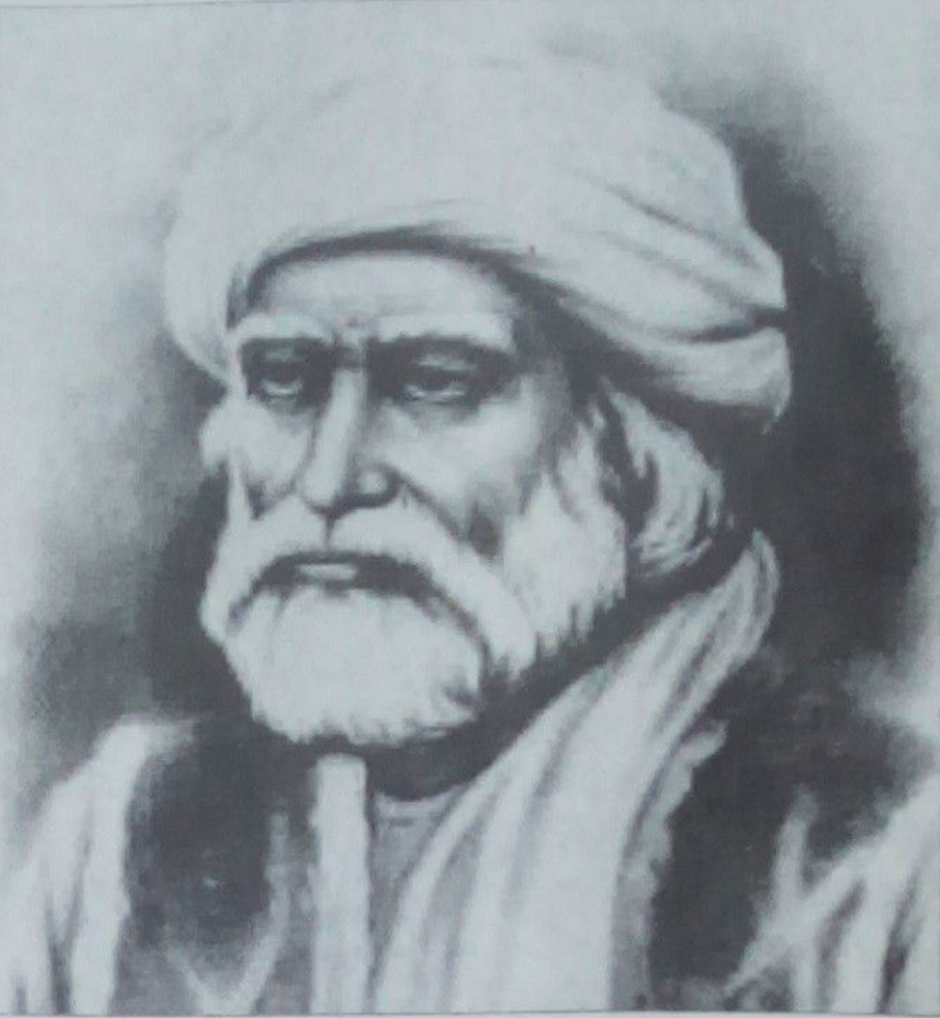
د جده په لارونو کې د مولانا جلال الدین بلخي، سعدي، سبائي او داسې نورو د ویناوو په شاعریو کې کبلی هغه نقل درته کیمه

په منظم ډول طب هم نه دی لوستي، خو د وخت د طبي آثارو مطالعه یې درلوده د ده په طب نامه کې د ځینو طبي آثارو یادونه شوې او دا ثبات ته رسوي چې بابا حتماً دغه آثار لیدلي او ویلي په کلیانو کې یې راغلي دي د ټول علت بلا دی خوشحال څنګه یو ماهر طبیب او حکیم و، د طب او حکمت په میدان کې یې د عقل او پوهې نه وکې خبرې کړې طب خوشحال کس نه و او نه د طب عمومي استعمال نه یې دویمه وخت درلود، خو طب په هغه زمانه کې د علم او ادب یوه حصه وه او د ضرورت مطابق دغه علم ضروري و د روغتیا په برخه کې اصلاً د ده تجربه د الوتونکو په برخه کې وه، خو په انساني طب کې یې هم تجربې درلودې طب نامه خوشحال څنګه منظوم اثر دی، لکه څنګه چې له نامه یې څرګنده ده په دې کتاب کې یې د ځینو مرضونو د علاج لپاره درمل په کې یوډلي دي خوشحال خان څنګه په منظم او سیستماتیک ډول زده کړې نه وې کړې، خو د دوو استادانو شاه اویس ملتاني او سیالکوټي صاحب نومونه په ځینو ادبي څېړنو کې یاد شوي بابا د خپل وخت د فارسي، عربي او داسې نورو ژبو مطالعه درلوده، نو له همدې امله د ده پر ویناوو کې د