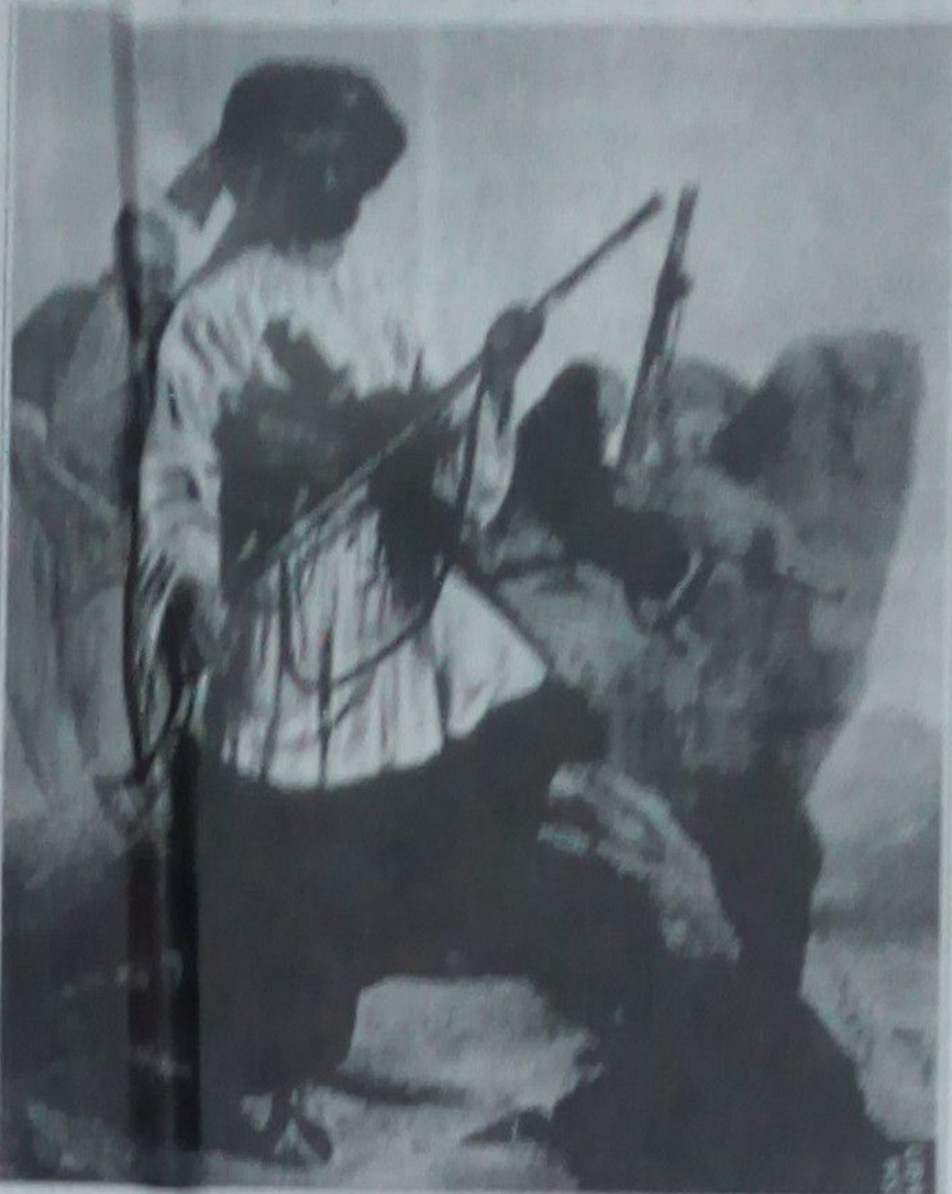
هغه مهال چې مور د بسوونځیو په نارینه‌ګانو کې لوستي نظریه کړې ، مثلاً مور د بسوونځیو په کتاب کې لوستي چې مګنان د وزیر اکبر خان په لاس وژل له جزائل څخه استفاده کله چې انګریزان د افغان - انګلیس جګړو او جګړو کې مات شول جزائل خورا مشهور شو ، د جزائل د شهرت اوازې

جزائل ظاهري ښکلا او تزئین هم د بحث وړ موضوع ده ، د هر جزائل کنډاغ او د میل د ټوکی برخې په دومره ظرافت جوړې شوي او تزئین شوي چې په اوسني عصر کې د اتلسمې پېړۍ دې هنر ته سړی گوته به غایب کړي مګنان په جزائل وژل شوي د افغان ملي تاریخ لیکوال « ټم » په یې یې ۵۶-۵۷ کې له جګړې