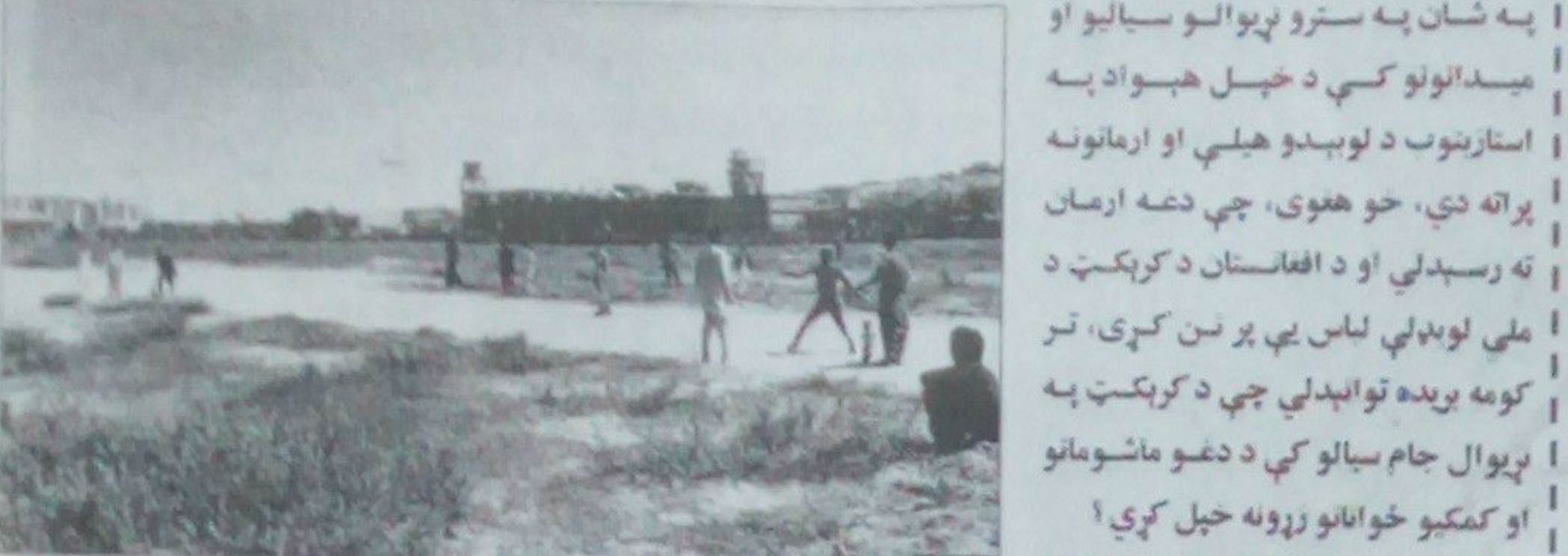
افغانستان له هرې لوبډلې لوبه ګټلې شي افغانستان د ۲۰۱۹ م کال د کرېکټ په نړيوال جام سياليو کې چې په انگلستان او ويلز کې د نړۍ د لوبډلې لوبډلو ترمنځ وشوې او انگلستان يې اتلولي وګټله، نهه لوبې يې وکړې او خپلې ټولې لوبې يې بايلوډي د کرېکټ مصرنو په نړيوال جام کې د افغان لوبډلې د پرله پسې

خبره، په نړيوال جام سياليو کې د افغان لوبډلې د ماتې يو لامل په لوبډله کې د وړتيا له مخې، لوبغاړو نه جاس نه ورکول دي، چې د دوی په خبره، که ملي لوبډلې نه د وړتيا له مخې لوبغاړي وټاکل شي، نو