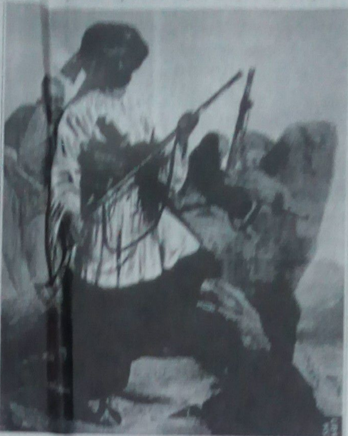
هغه مهال چې مور د بسوونځیو په تاریخونو کې لوستي نڅښه کړې ، مثلاً مور د بسوونځیو په کتاب کې لوستي چې مکنان د د جزائل د شهورت اوازې له جزائل څخه استفاده کله چې انګریزان د افغان - انګلیس جګړو او جګړو کې مات شول جزائل خورا مشهور شو ، د جزائل د شهورت اوازې

په یې یې ۵۶-رو کې له جګړې ، د افغان ملي تاریخ لیکوال د جزائل وژل شوي معمله وکړي دا خبره په سراج التواریخ کې