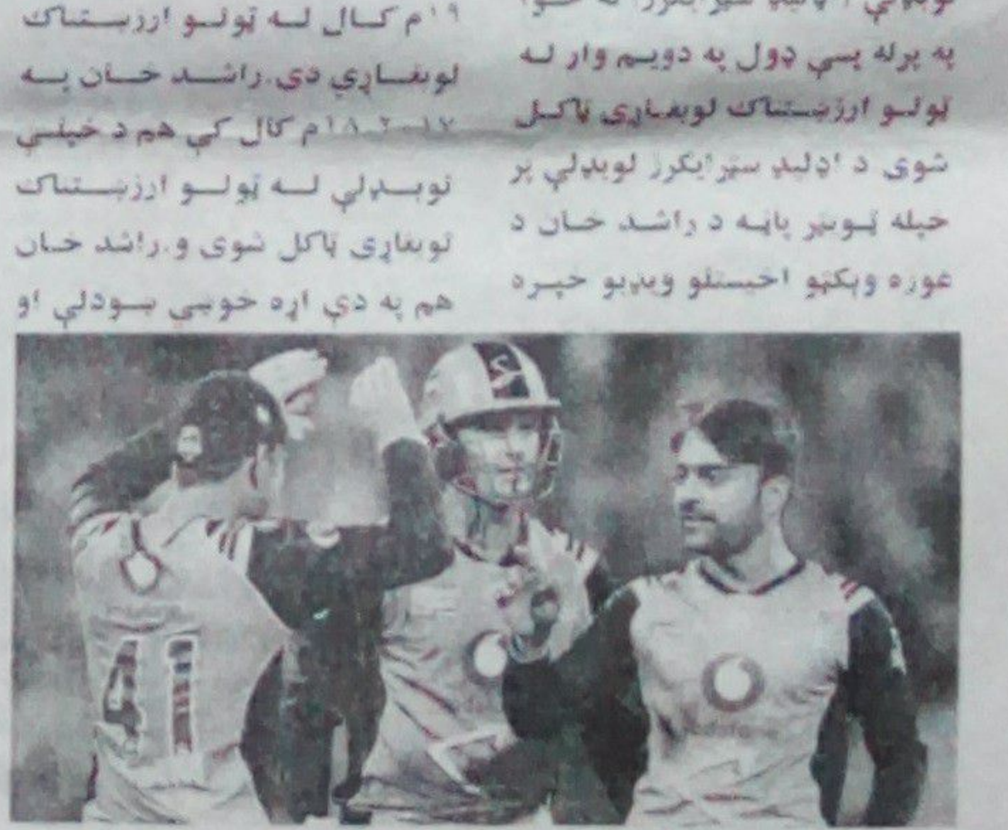
خپلې لوبډلې او منوالو ته یې مبارکي وینې، نوموړي کاپلې

خوښ یم چې یو وار یاد د یګ باش په یورنمنټ کې د خپل نیم سټراټیجی لپاره د کال ارزښتناک لوبغاړي غوره نوم خپل نیم او منوالو ته مبارکي وایم ستاسو له دعاوو او نیکو هیلو مننه. د راشد خان لوبډلې د نوموړي په مرسته د ۲۰۱۷-۱۸ بیګ باش سیالیو اتلولي خپله کړې وه. نوموړي په دغه پړاو کې ۱۸ زمانې وېکټي اخیستي وې، خو په نېر پړاو کې چې نوموړي یو وار یو لوبه لوبډلې سره غوره توپ اچونه نندارې نه وړاندې کړه، خو لوبډله یې ژر له سیالیو بهر شوه. د بیګ باش اووم پړاو سیالیو چې