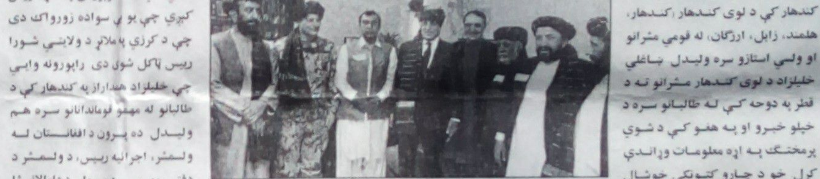
خليل وایي چې خليلزاد د لوی کندهار له مشرانو سره نه، بلکې د

د افغان سولې لپاره د امريکا ځانگړی استازی زلمی خليلزاد وږمه ورځ سې شنبه کندهار ته لاړ. خليلزاد په کندهار کې د لوی کندهار کندهار، هلمند، زابل، ارزگان، له فومي مشرانو او ولسي استازو سره وليدل. ښاغلي خليلزاد د لوی کندهار مشرانو ته د قطر په دوحه کې له طالبانو سره د خپلو خبرو او په هغو کې د شوي پرمختگ په اړه معلومات وړاندې کړل خو د چارو کتونکي خوشال