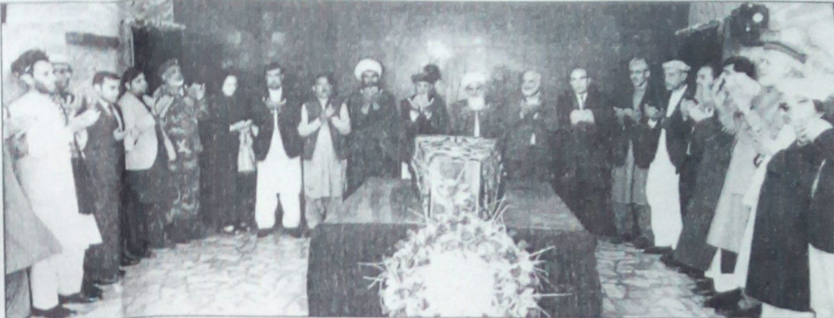
له غرمې مخکې د یو لړ مراسمو په ترڅ کې د لوگر د ولایتي شورا