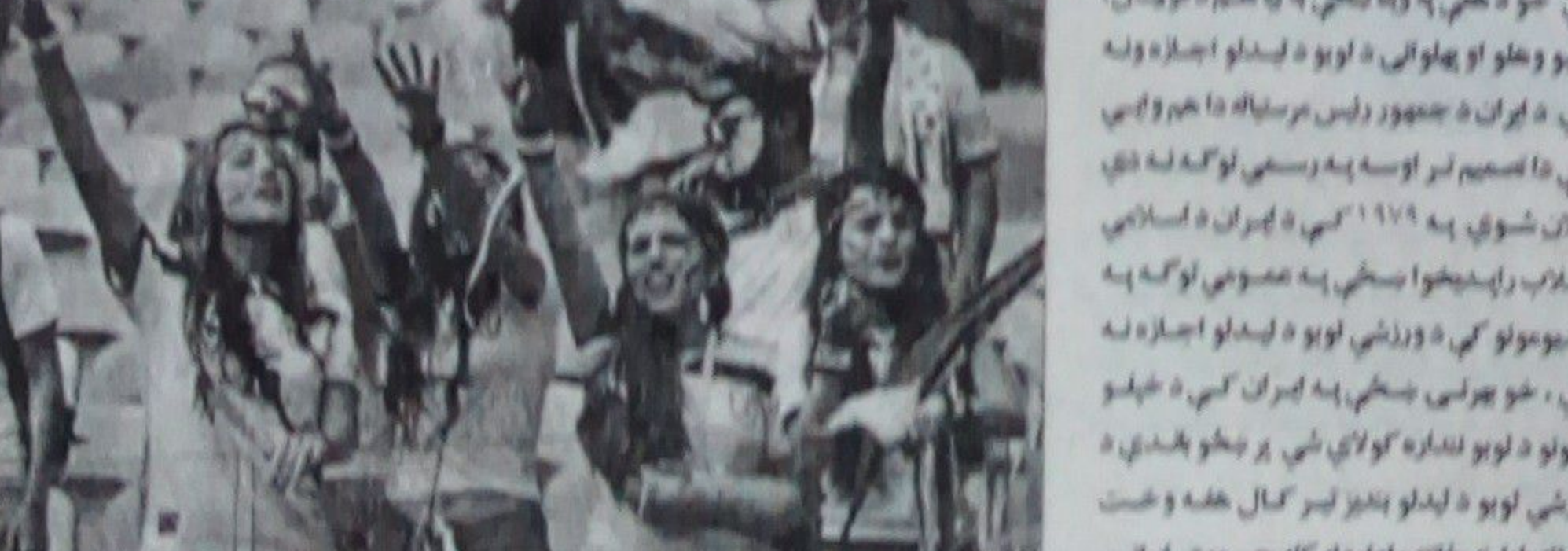
ایراني ملتکو وایي چې تر شمېر بنځو ته به اجازه ورکړي چې د والیبال لوبډلې سیالی چې د روانې میاشتې په پای کې به ایران کې ترسره کيږي، نه ترڅو د کورني د بنځو لوبډلې په چارو کې د ایران د جمهور رئیس مرستیاله شهیندخت مولاوردی وایي چې دا تصمیم یې په پوره پاملرني لوبې چې د ورزشي سټیډیومونو دروازې په تدریجي توګه د بنځو پر مخ خلاصې شي هلي وویل تر څو بنځې تر ډېره د ملي لیم د ورزشکارو د کورني لوبې په اجازه ولري چې د والیبال رنډونکي لوبې وګوري، مېرمن مولاردی زیاده کړې چې «که دغه کار به عمل کې ځو ځو وشي، ښيي به په کلي لوبه کې به دا به ګټه شي چې د لارښو د ورزشي سیالیو لیدلو لپاره بنځو ته اجازه ورکول ستونزمن نه دي» هېڅ دا هم وویل چې «لازمو لیدنیو لوبو لپاره چې د تدریجي د پراخیدو مخنیوی وشي باید دغه موضوع ده چې په ملي سره اداره کېدای شي، نو دا په حلیت بدله نه شي»