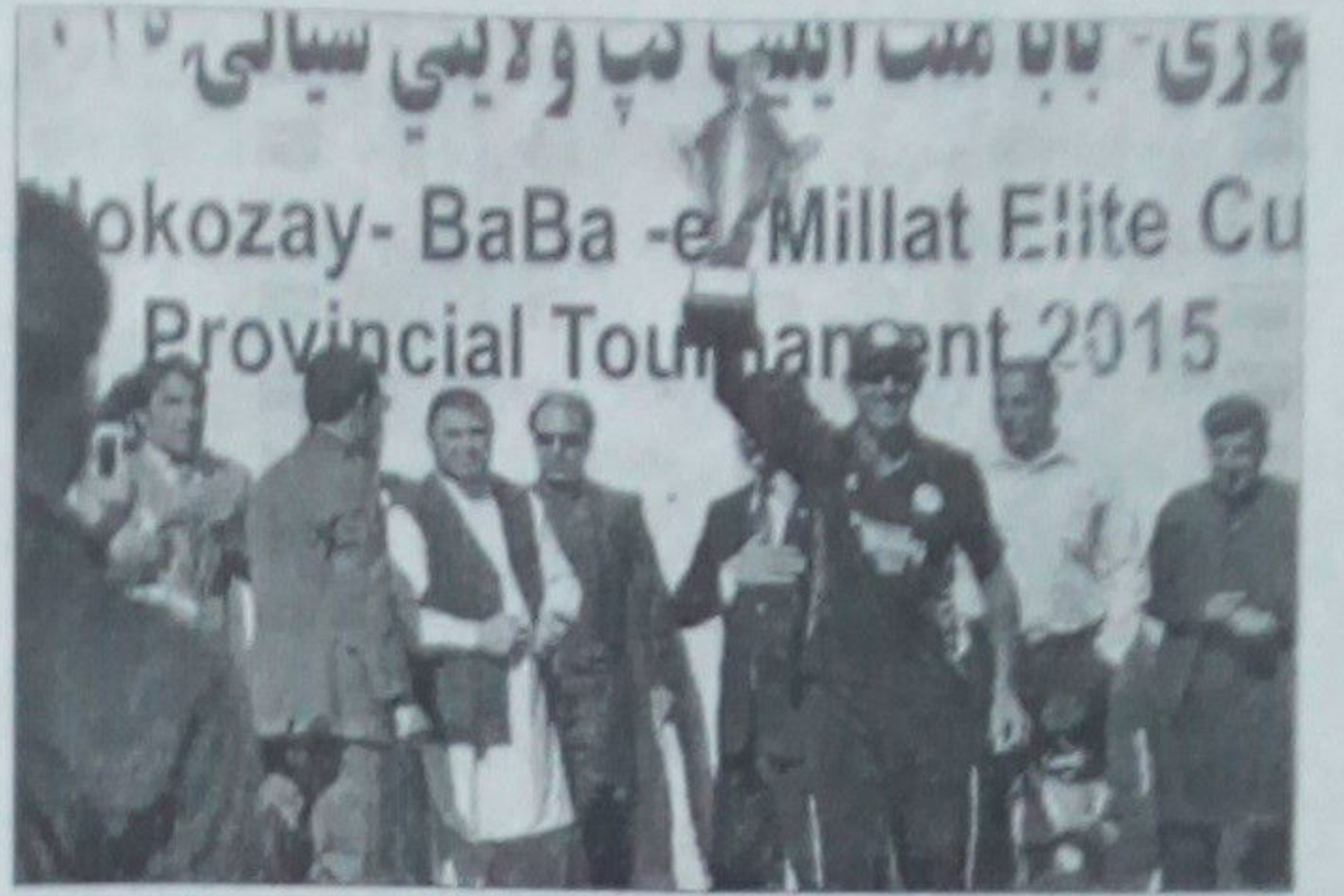
پکتیا د افغانستان د کورني کرېکټ د لوبیزو د اتلولي د پایي ملت نوم ورکړل شوي، پایلوه په یو سیمه ییز لوبیزون

لومړنیو ترمنځ دغو سیالیو نه د ۱۲ مه د دوښي په ورځ خټي د اتلولي د پایي ملت نوم ورکړل شوي، پایلوه په یو سیمه ییز لوبیزون