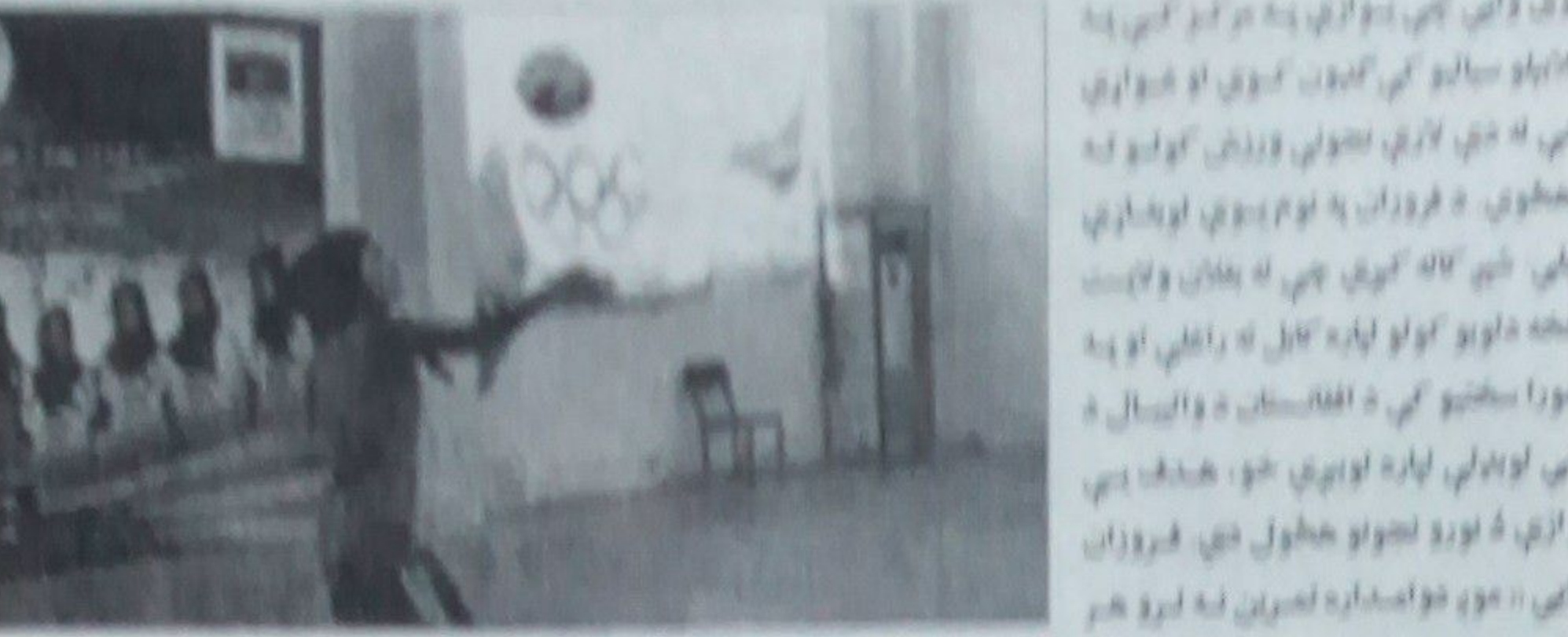
د نجونو د والیبال لوبډلې د دولت ملاتړ غواړي

په کابل کې د والیبال د ورزش لوبډلې د والیبال لوبډلې د دولت ملاتړ غواړي