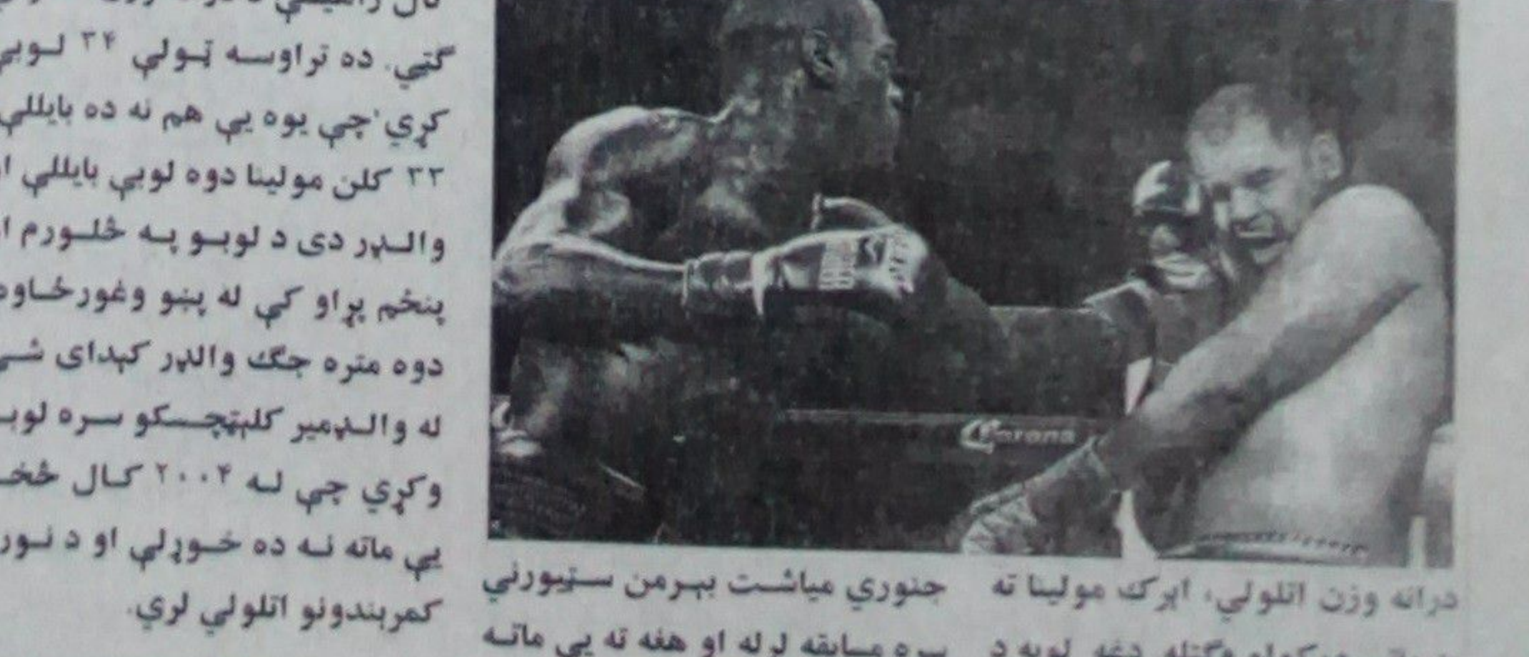
ډیونټي والټر د درانه وزن سوک وهنې اتلولي وگټله

امریکايي سوکوهونکي ډیونټي والټر د نړیوالې سوک وهنې د امریکا د الاباما ایالت کې ترسره شوه. ۲۹ کلن ډیونټي والټر تېره کال راهیسې د درانه وزن اتلولي گټي ده تراوسه ټولې ۲۴ لوبې کې چې یوه یې هم نه ده پایلې ۳۳ کلن مولینا دوه لوبې پایلې او والټر دی د لوبو په څلورم او پنځم پړاو کې له بېنو وغورځاوه دوه متره جگ والټر کېدای شي له والډمیر کلهټچسکو سره لوبه وکړي چې له ۲۰۰۲ کال څخه یې ماته نه ده خوړلې او د نورو کمربندونو اتلولي لري