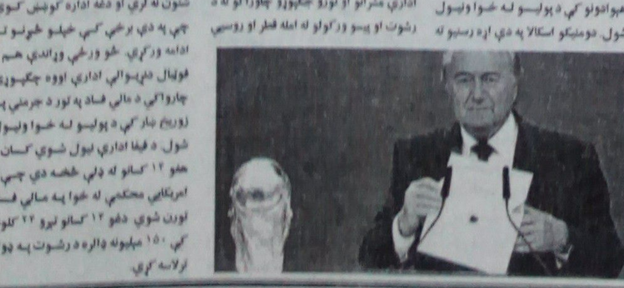
ښايي روسیه او قطر د نړیوال جام کوربه توب له لاسه ورکړي

په دې وروستیو کې د فوټبال نړیواله اداره په مالي فساد تورنې چې له همدې امله د دغې ادارې لوی پامل شوي متر هم استعفا ورکړه د نويو اسکالا د فیفا نړیوالې ادارې چکپوړي چارواکي رسنیو ته د مالي فساد په اړه وویل چې چپوړي داسې شواهد ترلاسه شي چې روسیه او قطر د نړیوال جام کوربه توب ترلاسه کولو لپاره د دغې ادارې مشرانو ته رشون ورکړي وي نو دغه هېوادونه به د ۲۰۱۸ او ۲۰۲۲ نړیوال جام کوربه توب له لاسه ورکړي. دا په داسې حال کې ده چې نړیوالې د دغې ادارې د پنځم ځل لپاره پل شوي متر سب والټر یوه ورځ وروسته له پل کېدو استعفا وکړه