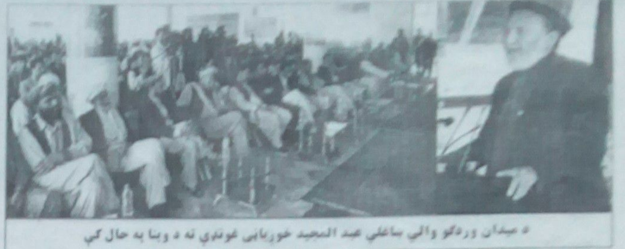
د میدان وردگو والي باغلي عبدالحمید خورمبايي غونډې ته د وينا په حال کې

د مینې گل مشاعرې د پرمینو مراسمو په ترڅ کې جوړه شوه. د مینې گل مشاعرې د پرمینو مراسمو په ترڅ کې جوړه شوه. د مینې گل مشاعرې د پرمینو مراسمو په ترڅ کې جوړه شوه. د مینې گل مشاعرې د پرمینو مراسمو په ترڅ کې جوړه شوه.