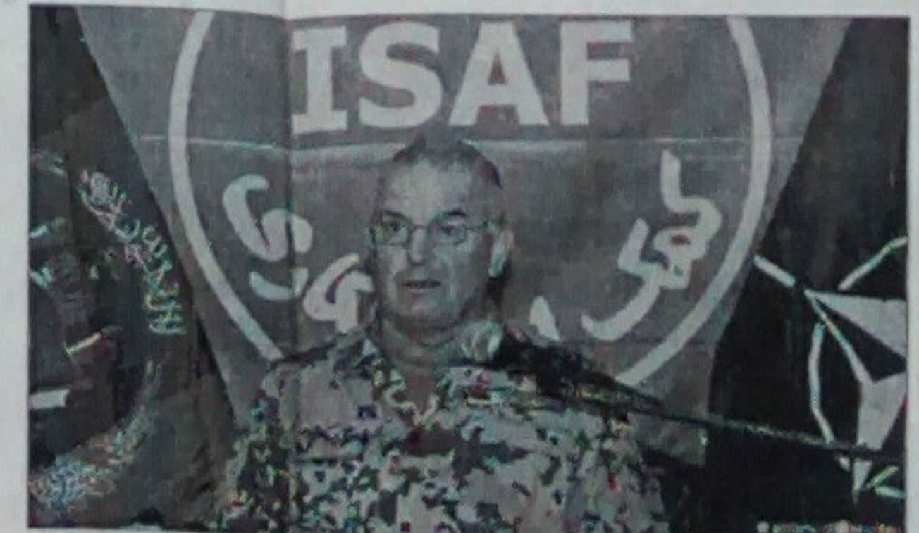
ISAF څارنيز ځواکونو د مرستندويو هېوادونو له ۲۰۱۲ زېږيز کال څخه وروسته له افغانستان څخه د امريکايي، ناتو او ايساف د ځواکونو له وتلو وروسته د څلور کلونو په پاره له افغانستان سره د مرستندويو هېوادونو د څه دپاسه دوه ډېرشو مليارډو امريکايي ډالرو د پوځي او پراختيايي مرستو له زمو تارده کولو او دوام سره بيا هڅو کړي وښوي

يو بل لپاته حکومت شته چې د ودې په حال کې دی او، دې توان لري چې افغانستان په اقتصادي، امنيتي او په سيمه کې د همکارو په برخو کې رهبري کړي او برياليتوب نه يې ورسوي