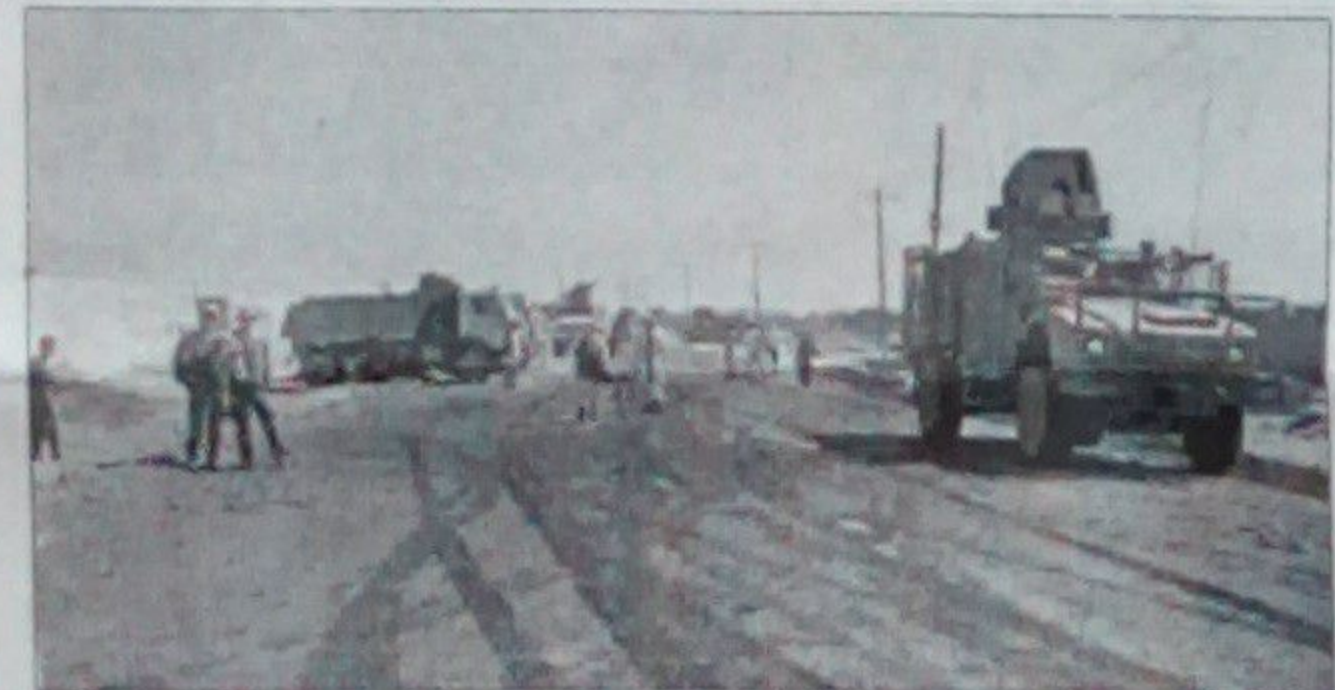
پړوالو اقتصادي او امنيتي غونډو د ترڅه واليو مرستندويو هېوادونو او پړوالو سازمانونو استازو د افغانستان له جمهور ريس محمد اشرف غني څخه په کلکه

پرتمين همت يار دغه غوښتنه وکړه چې د افغانستان د اقتصادي او امنيتي چارو ډېر مهم بولو له پاره دې نړۍ د مرستندويو هېوادونو د مرستو د لټولو په برخه کې له پوره شفافيت او صداقت څخه کار واخلي او هېڅ ډول سپين سترگو، سرزور او خپلرو روږاگانو، لوښارانو، د قدرت دگدۍ او پيسو لوبو يانو او سامارانوته دې دا اجازه ورته کړي چې له دې وروسته له افغانستان سره دې د مرستندويو څخه