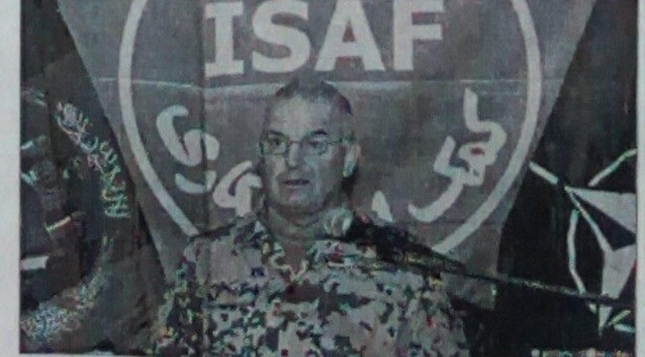
امنيت خوندي وساتي، موږ په همدې نير دويي کې د افغانستان په تاريخ کې ن نومړي ځل لپاره له يو منتخب ولسمشر څخه بل منتخب وټمشر ته د قدرت د نېره شاهدان وو که چيرې سترې اوسني ټولنيز وضعيت او پرمختگ نه نظر واچوي، نو دا په شپږه توگه د شوروي د څواکونو نه وټلو سره توپير لري مهمه دا ده چې اوس موږ د پوځو په پرتله په افغانستان کې نسبتا يو ډېر لږ وضعيت لرو، دلته

پړوالې ټولني په پوره زيار سره د افغانستان وسلواک پوځ وروزه او هغه يې په وسلو سمبال کړ په نتيجه کې افغان امنيتي څواکونه وتوانيدل چې له خپلې ډيموکراتيکې پروسې سره ملگرتيا وکړي او د باغيانو د خونې پر خلاف په پوره برياليتوب سره د ټاکنو