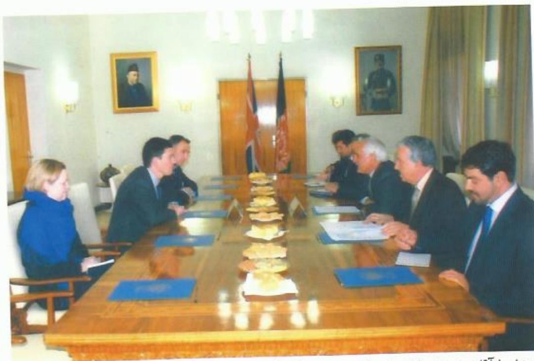
دیدار با آقای دیوید میلبند وزیر خارجه‌ی بریتانیا، کابل، ۲۰۰۸.