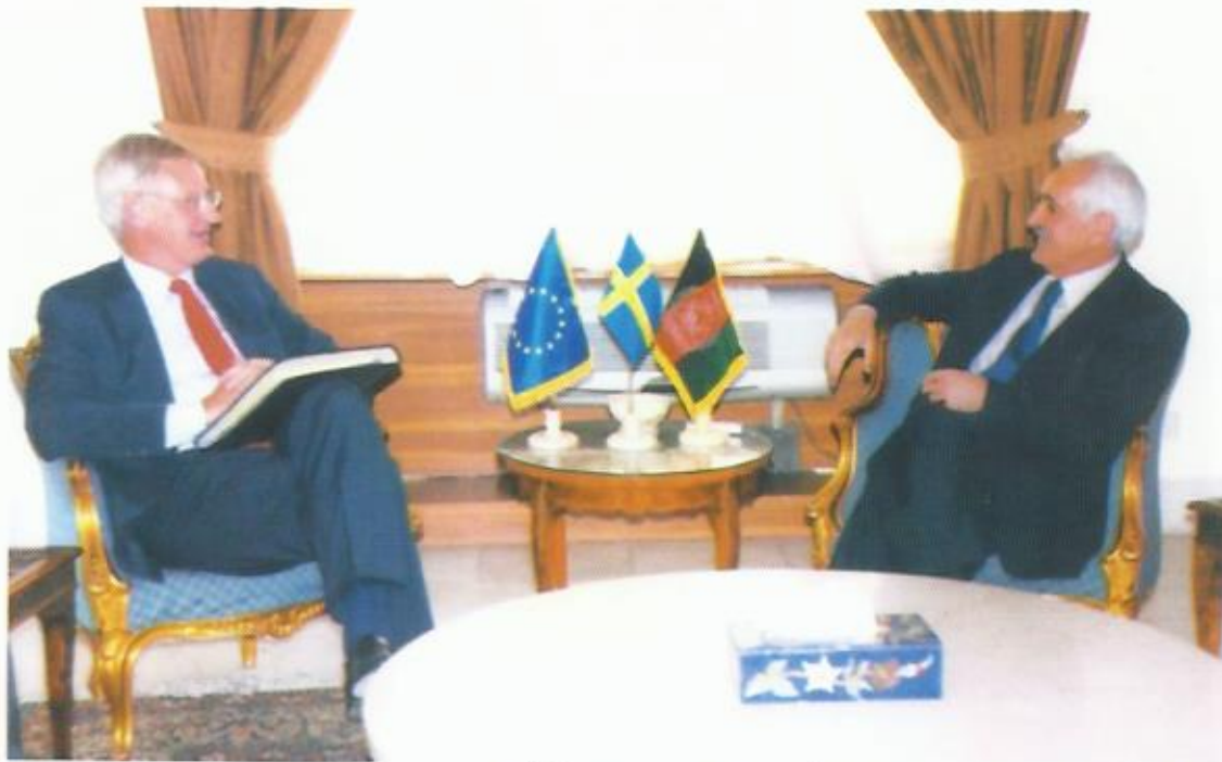
دیدار با کارل بریل، وزیر خارجه‌ی کشور شاهی سویدن، کابل.