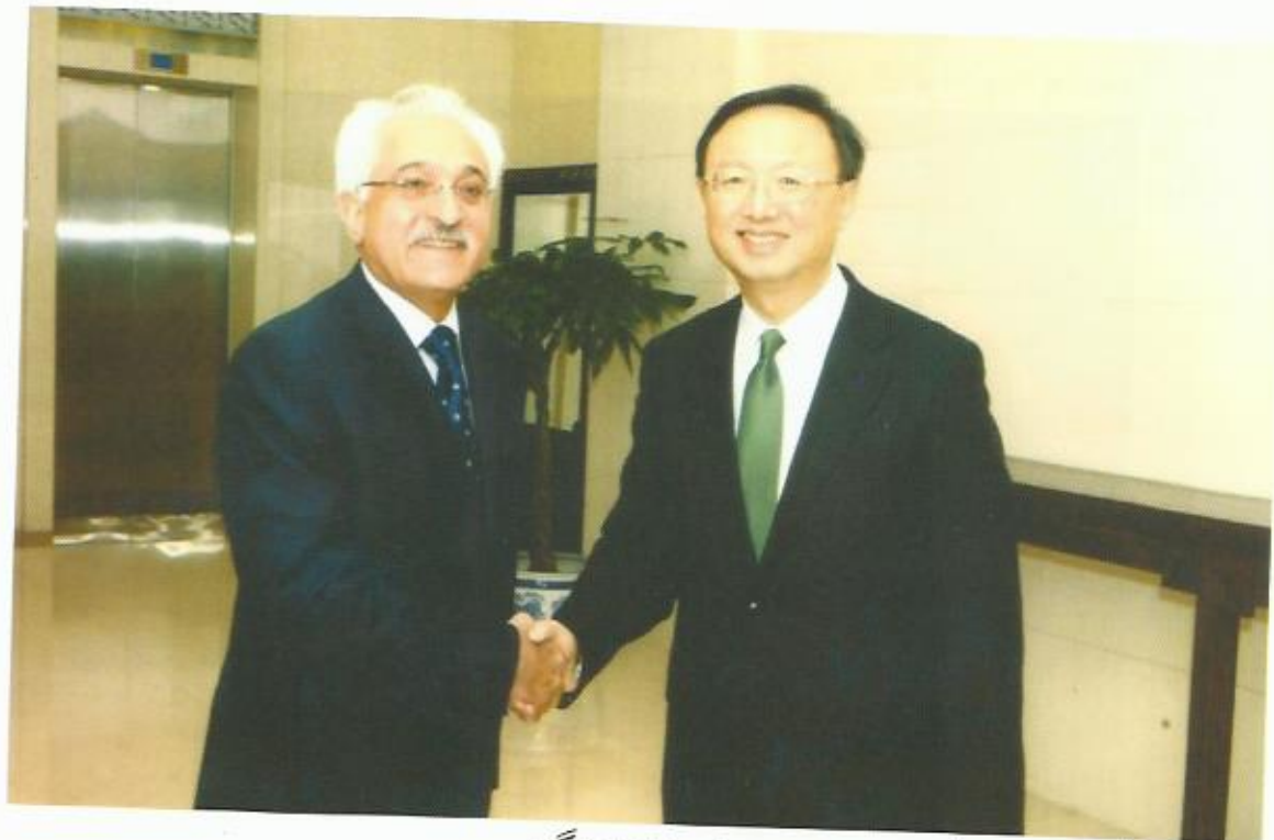
دیدار با یاگیشی، وزیر خارجه‌ی جمهوری مردم چین، بیجنگ.