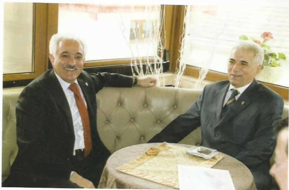
دیدار با همراه خان ظریفی وزیر خارجه‌ی تاجکستان، دوشنبه، تاجکستان،