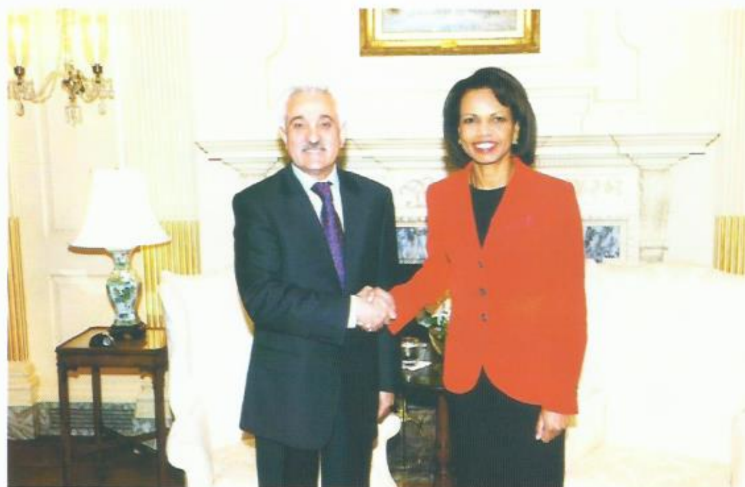
دیدار با خانم کاندولیزا رایس، وزیر خارجه‌ی ایالات متحده امریکا، واشنگتن.