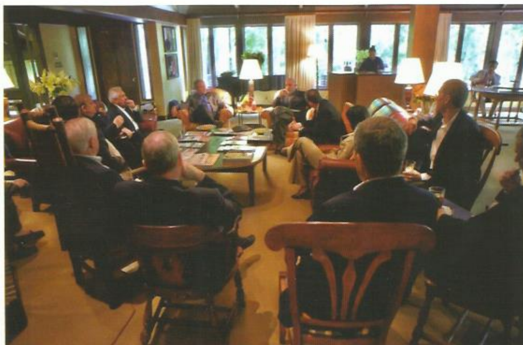
ملاقات کمپ دیوید، ایالات متحده امریکا، ۲۰۰۸.