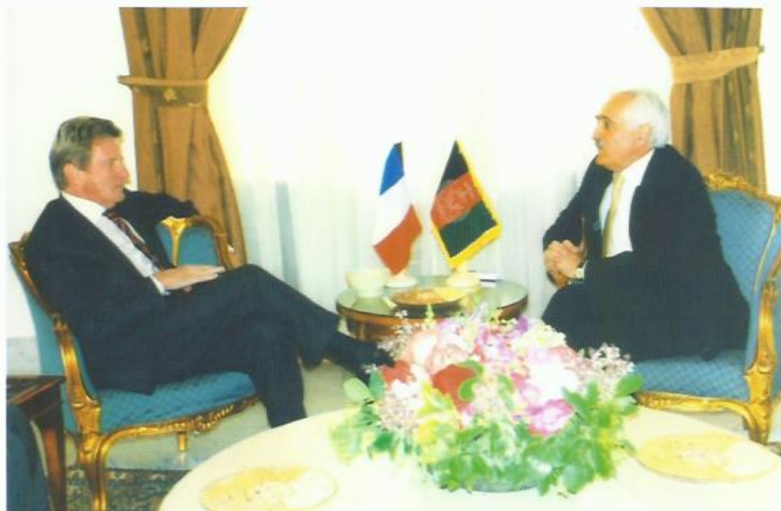
دیدار با برنارد کوشنر، وزیر خارجه‌ی فرانسه، کابل.