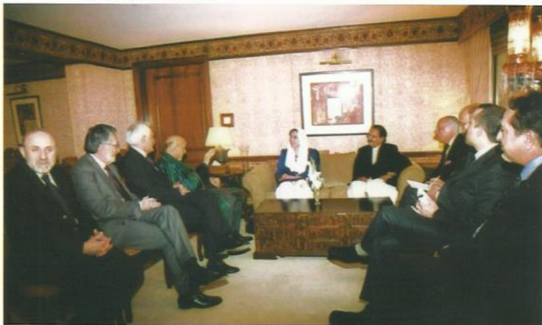
دیدار با خانم بینظیر بوتو، هتل سرینا، اسلام‌آباد، پاکستان، ۲۰۰۷. (بینظیر بوتو دو سه ساعت پس از این ملاقات کشته شد.)