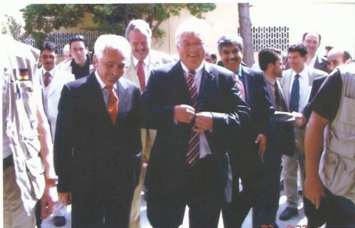
دیدار با فرانک اشتاین مایر وزیر خارجه‌ی پیشین و رییس جمهور کنونی آلمان، ۲۰۰۷.