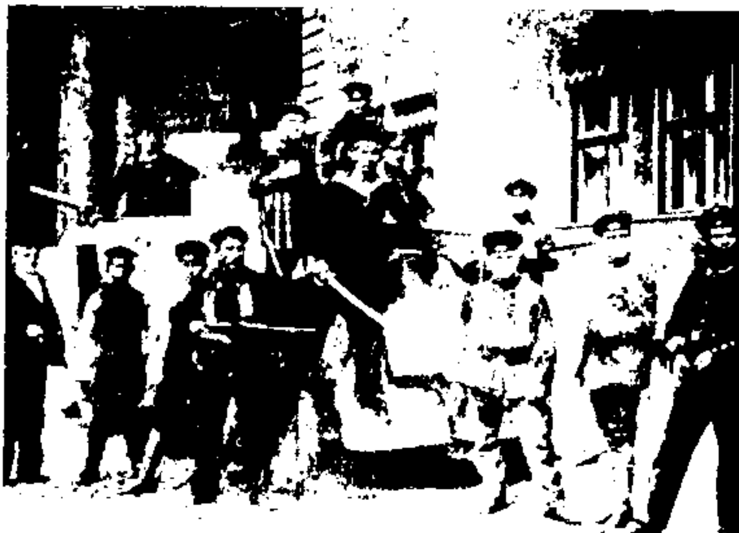
- انقلاب در برلن، نوامبر ۱۹۱۸: گروه اسپارتناتوس - سوسیالیستانی بودند که اتحادیه‌های کارگری و سربازی قدرت را در دست بگیرند دولت مونت به رهبری فریدریش ایبرت (Friedrich Ebert) خواهان یک دموکراسی پارلمانی است. او در مقابل نیروی دریائی مردمی که در تصرف شاه (شاهانه) مستقر شده بود، بقیه ارتش و سربازان داوطلب را گمارده است. (پایین) بعدها اولین طرفداران هیتلر را سربازان داوطلب تشکیل دادند.