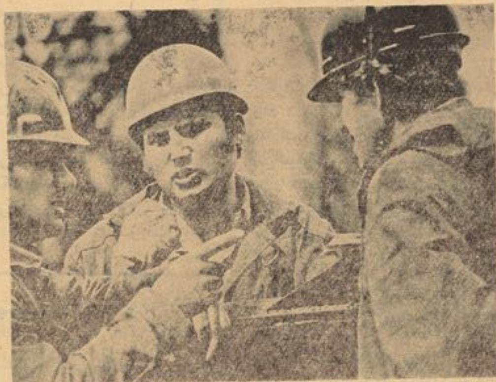
اتحادیه های کارگری در پهلوی مبارزه جهت تامین حقوق حقه کار - گران و سایر زحمتکشان در جهان ، برای تحکیم صلح و ثبات بین المللی نیز تلاش پیگیر می کنند .

باید تذکر داد هنگامیکه سرمایه داری داخل یک مرحله ثبات نسبی گردید ، سیرهای ارتجاعی و انحصارات امپریالی - ستی تخطی های شدیدی را بر حقوق و منافع کارگران و ایجاد تفوق بین اتحادیه های مختلف کارگری آغاز کردند و کوشیدند تا جلوی نسج نهضت بین المللی اتحادیه کارگری را بگیرند ، معبدا همه پلان های ارتجاع و امپریالیزم در زمینه نامشروع با تشدید تخاصم بین کار و سرمایه در زمان بعد از جنگ و تعمیق بحران عمومی سرمایه داری بررشد و نیرومندی همه جانبه نهضت اتحادیه کارگری جهانی افزوده شد . این مرحله بیش از هرچه دیگر در پرتو