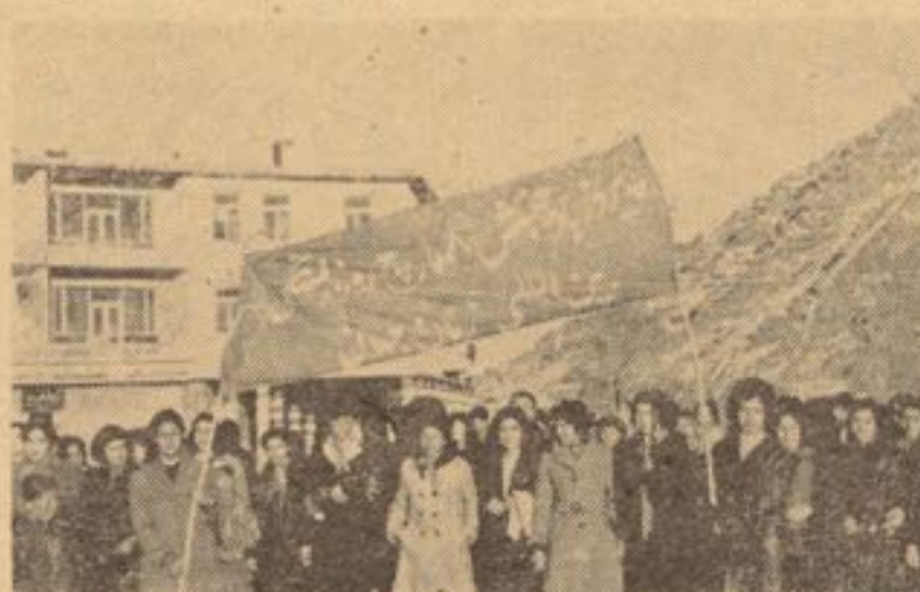
زنان باگرمی و شور انقلابی، روز همبستگی زنان یعنی هشتم

حافظه تاریخ مشحون از فدا - زندگی تا متکا ملترین آن تو وسط کاری‌های زنان - مملو از تمنیات زنان گرفتار شده است . متانت و ارزوهای هستی ساز آنها - زنان باعث تربیه هزاران هزار سرشار از فراز و نشیب‌ها - انسان - که برای بشریت قربانی‌ها و خودگذری‌های بی تحفه‌های خوبی به ارمان آورده همتای زنان است . زنان پیکر است - گردیده و توانسته است جدا نماندنی جوایع بشری - زندگی را برای بشریت سهولت بوده و در آهنگ تحولات اجتماعی بخشند . افتخارات همه به زنان سپیم میباشند . این زنان اند که تعلق دارند چه آنها بوده اند علی‌الرغم دشواری‌ها و مشکلات که با قبول مشکلات گونه‌گونه