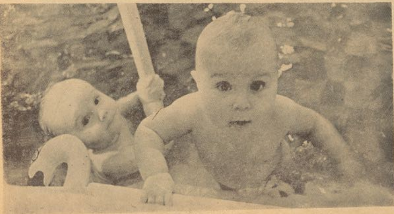
شیر مادر دارای موادی است که طفل را در مقابل امراض وقایه نموده و آنرا صحتمند و تنومند بار می آورد .

شیر مادر خالص و عاری از هر نوع آلودگی است و ضرورت به نگهداری در جایی سرد یا جوش دادن یا پاک نگهداشتن ندارد و همیشه آماده استفاده طفل در هر وقت و زمان است و احتیاج به تیار کردن شیرو یا شیر چوشک نیست و همین شیرمادر است که احساس محبت و علاقه بین طفل و مادر را تقویه میکند پس بهتر خواهد بود تا حد امکان الی شش ماهگی از شیر مادر استفاده به عمل آمده و طفل را از امراض خطر ناک مانند اسهال و استفراق و گلو دردی های شدید وقایه کرد .