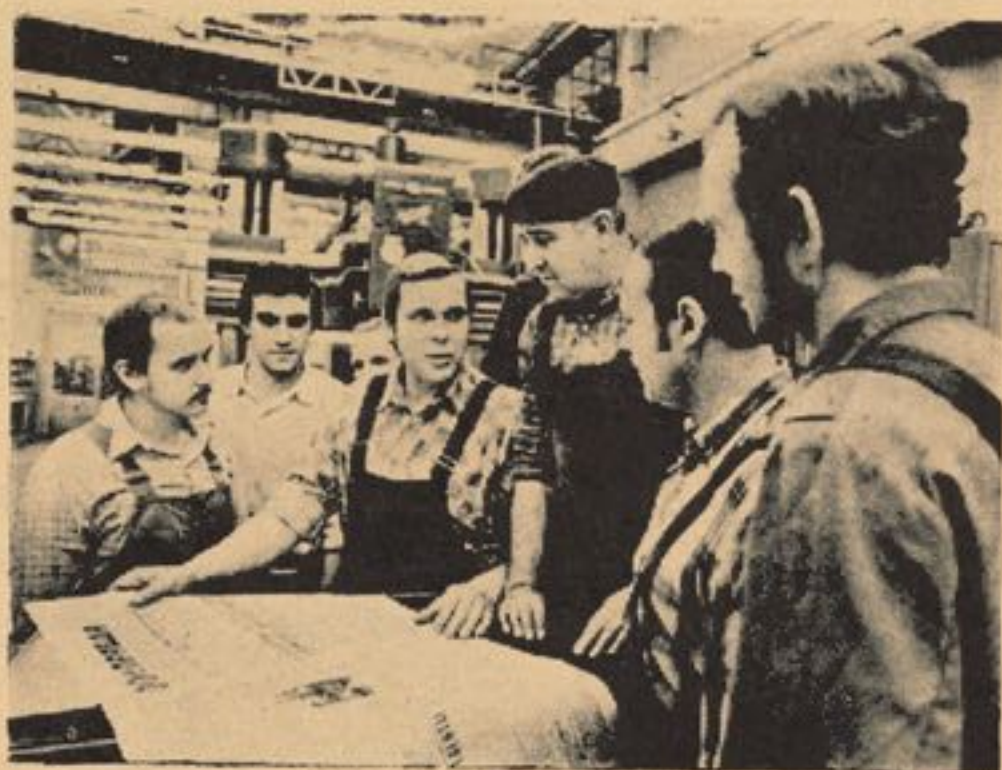
اتحادیه های کارگری در جوامع سوسیالیستی خود در مورد طرق بهتر و موثرتر کار و حل مشکلاتشان تصمیم می گیرند.

جهت عمده در نهضت بین المللی اتحادیه کارگری بر اساس شکل و میتودی که از آن در دفاع از منافع