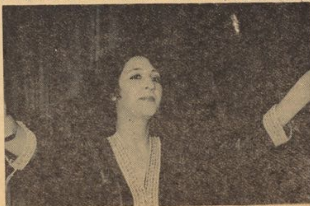
صحنه بی از نمایش رقص

باتوجه به مسوولیت بزرگی که افغان ننداری در به شناخت آوری انواع هنر های نمایشی بومی و محلی کشور و بارود گردانیدن استعداد استعداد های تازه و پرمایه ی جوان دارد امیدواریم در آینده شاهد نمایشاتی در زمینه رقص و آواز با مایه های بیشتر و رسالت های افزون تر در استیج کابل ننداری باشیم.