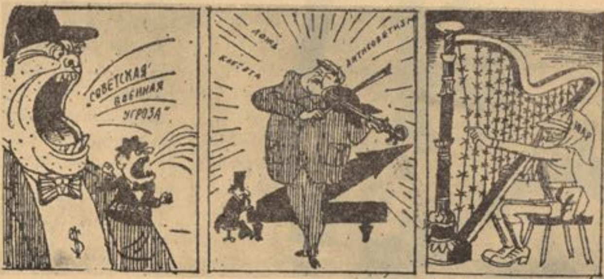
هما هنگسی ساز همونیزم با امبريالیزم

زیرا که این نوع آرد ها هفتاد الي ۸۰ فیصد آرد خالص را دارا می باشند مواد سلولوز در سیوس ویا قشر گندم موجود بوده زمانیکه اطفال به تشوشات ویتامین خصوصا گروه