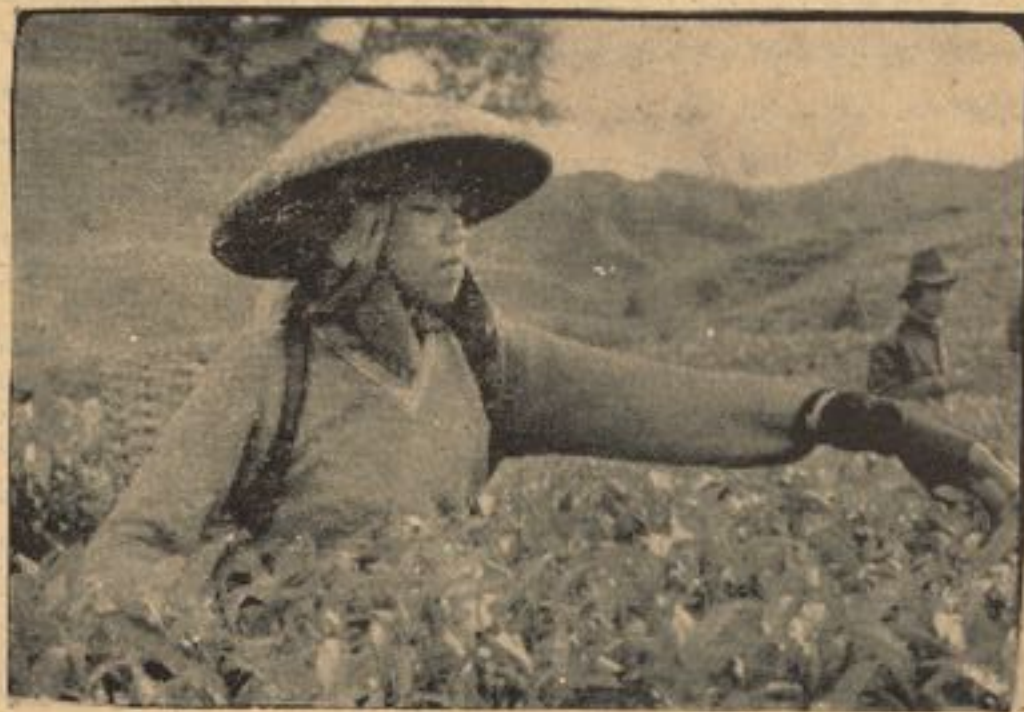
یکی از زنان دهقان از کشورهای جنوب شرق آسیا

زمینه برای امداد امتیازات نژادی مساعد ساخته شده و اقداماتی که بایست اتخاذ گردد ، در تصامیم ، قطعنامه ها و مقالات که در تحت نظر ملل متحد نمایندگان اختصاصی آن و همچنان بواسطه اعمال موسسات حکومتی و غیر حکومتی اتخاذ شده است واضحاً بیان و مشخص گردیده است . اکنون وقت آن فرا رسیده است که این تصامیم و قطعنامه ها بطور جامع و کامل مورد تطبیق قرار داده شود و همراه با آن کام های موثرتر برضد نژاد پرستی ، امتیازات نژادی و اپارتاید و همچنان در جهت رفع استعمار و تثبیت حاکمیت ملی بر داشته شود . برای این منظور طرق و وسایل مختلف تحت مطالعه قرار گرفته شده می تواند . بطور مثال کمیسیون حقوق بشر در جلسات سال ۱۹۷۸ خود چنین نظر داد که کنفرانس جهانی بایست چنان اقدامات اتخاذ نماید که شامل عناصر ذیل باشد : تمام کشور هاییکه در آن کانونشن های بین المللی حصه نگرفته بودند که در آن موضوعات نژاد پرستی ، امتیازات نژادی و اپارتاید را مورد بحث قرار می دادند ، می باید بزودی ممکنه تصویب این را و یا دسترس پیدا کردن باین وسایل را مورد مدافه قرار دهند و به آن قدرت قایل شوند . - شامل ساختن موضوع حقوق بشر در نصاب تعلیمی اطفال و جوانان با عطف توجه خاص به مراحل اولیه تعلیم و تربیه در باره برابری انسان ها و بدیهای امتیازات نژادی . - انکشاف پروگرام های ملی در جهت تضمین دسترس داشتن در تعلیم و تربیه