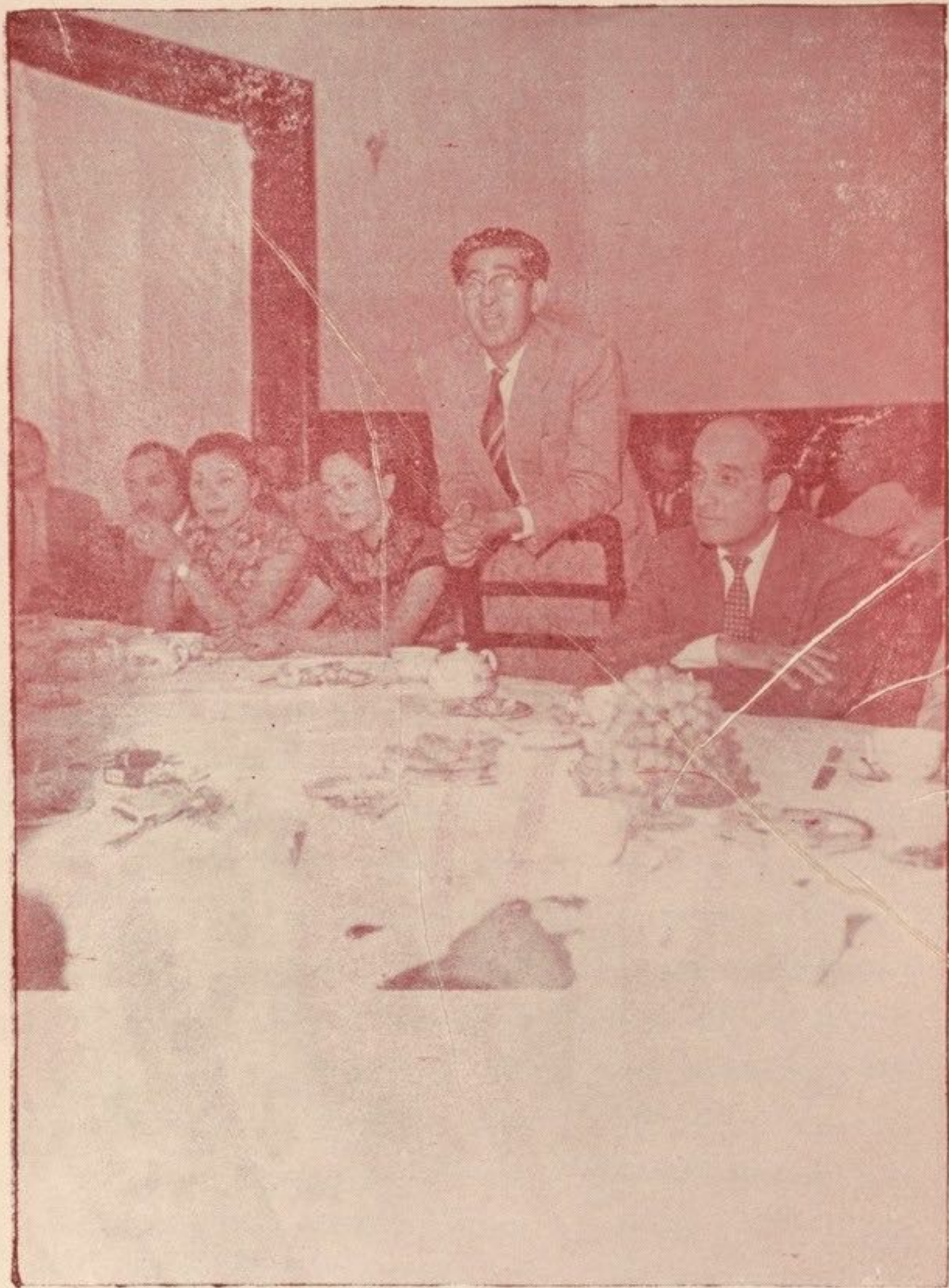
بناغلی رئیس پوهنځی ادبیات در محفل ادبی مشتمل از نویسندگان و هنرمندان افغانی و جمعیت هنرمندان چینی در کلوب عسکری نظریات خود را در باره نمایشات هنرمندان چینی ابراز میدارند.