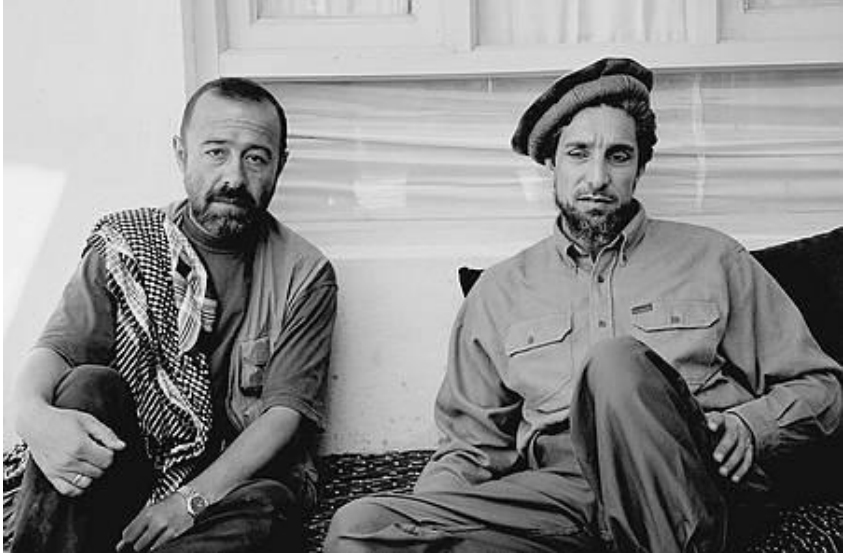
د احمد شاه مسعود او روسي پوځي څارگر «الېکساندر کنيازېف» يو بل گډ انځور. ۱۹۹۹ز کال.