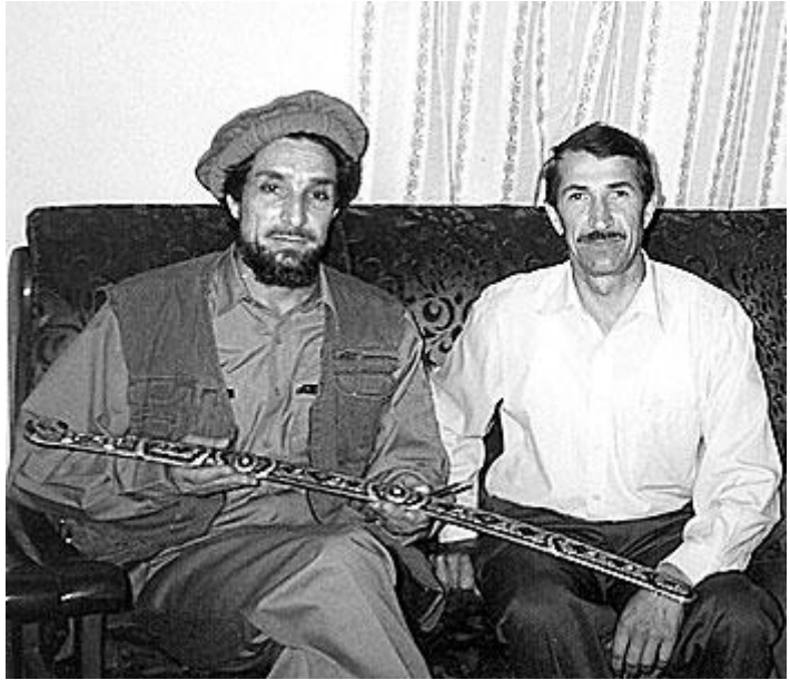
احمد شاه مسعود او د روسي څارگری (کې.جي.بي) ډگروال رينات تيمبروويچ امينوف، د ۱۹۹۸ ز کال د جولای میاشت.