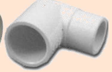
SxS Street Ell