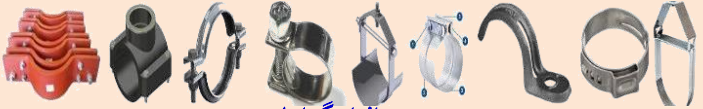
انواع گیرهای پپ Pipe Clamp