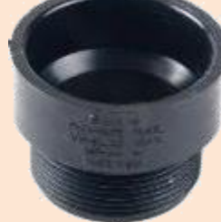
Male Adaptor-Hub X Male