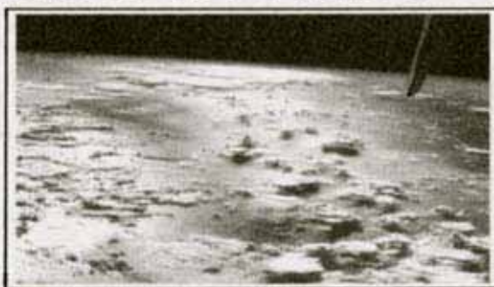
سوره آل عمران آیه ۱۹۰

جالب این است که مقدار اکسیژن مورد احتیاج جهت تنفس ، در هوا بصورت بسیار حساس ثبت و در حالت تعادل قرار گرفته اند . (( مایکل دنتون )) ۱ در این مورد می گوید : " آیا اتمسفر ما می توانست با در برداشتن اکسیژن بیش از اندازه به حیات خود ادامه دهد ؟ خیر ! اکسیژن عنصری است که عکس العمل های شدید از خود نشان می دهد . حد نصاب ۲۱ درصدی اکسیژن موجود در اتمسفر ، در مرزی ایده آل قرار دارد و نباید از این مرز تجاوز کند . اضافه شدن حد نصاب ۲۱ درصدی به این ۲۱ درصد ، باعث می شود ۷۰ درصد آتش سوزیهای جنگلها در اثر رعد و برق افزایش یابد .