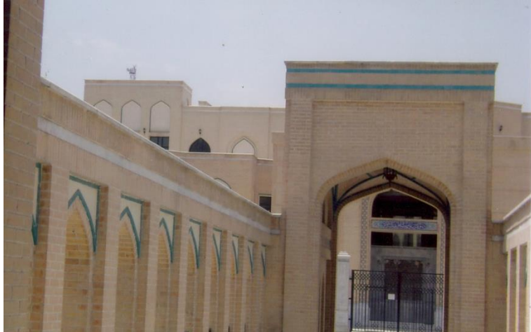
د ايران په لگښت د جوړې شوې يوې مدرسې يوه څنډه

خو د افغانستان مخلوع خارجه وزير له ايران سره د خپل ژبني پيوستون او تمايلاتو له امله دا تړون لاسليك كړې او د افغانستان نور قانوني او ارتباطي مراجعو، لكه اطلاعاتو او كلتور وزارت،