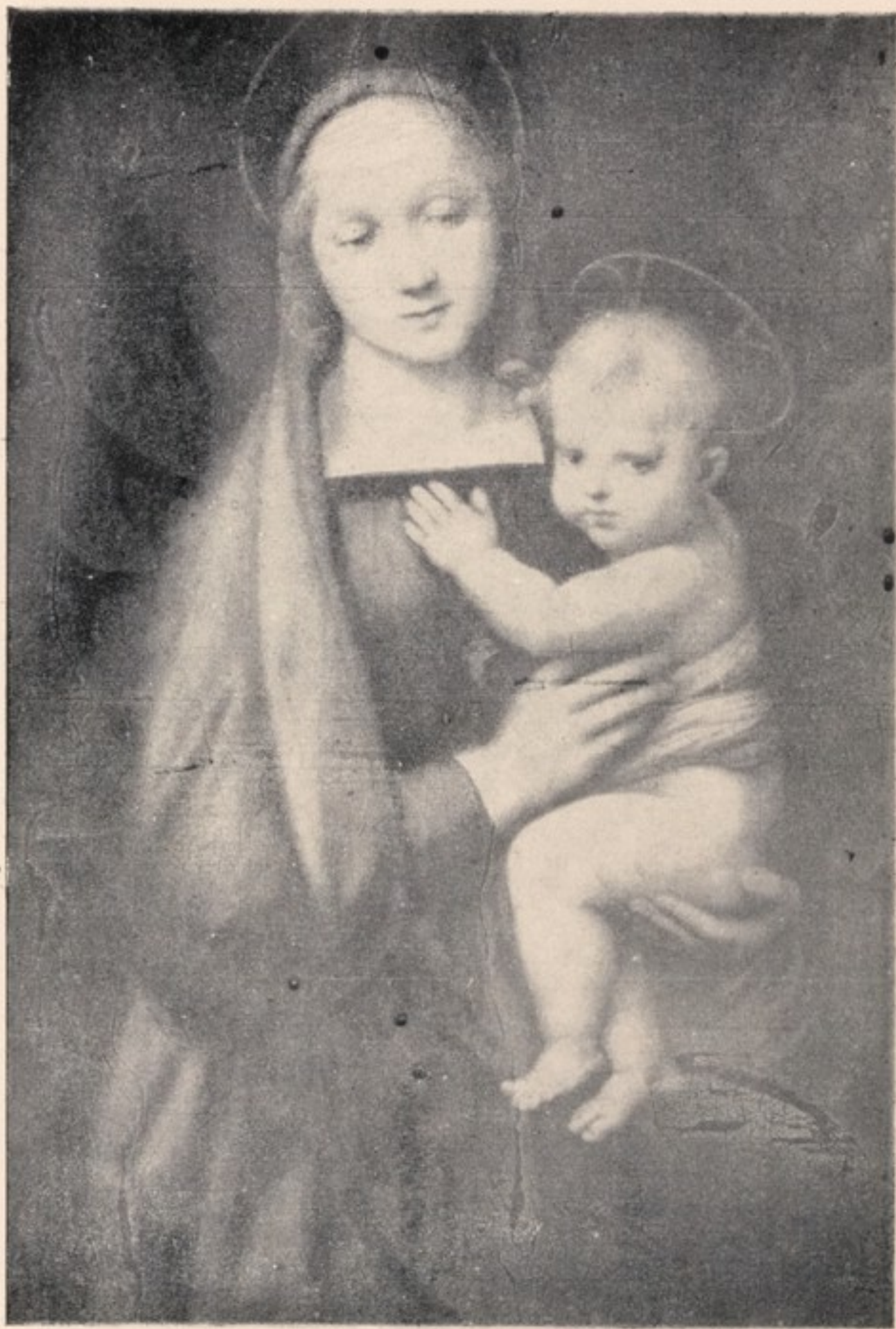
رافایل : میدونای سمران دیوکا ( نمایشگاه پیتی ) فلورانس