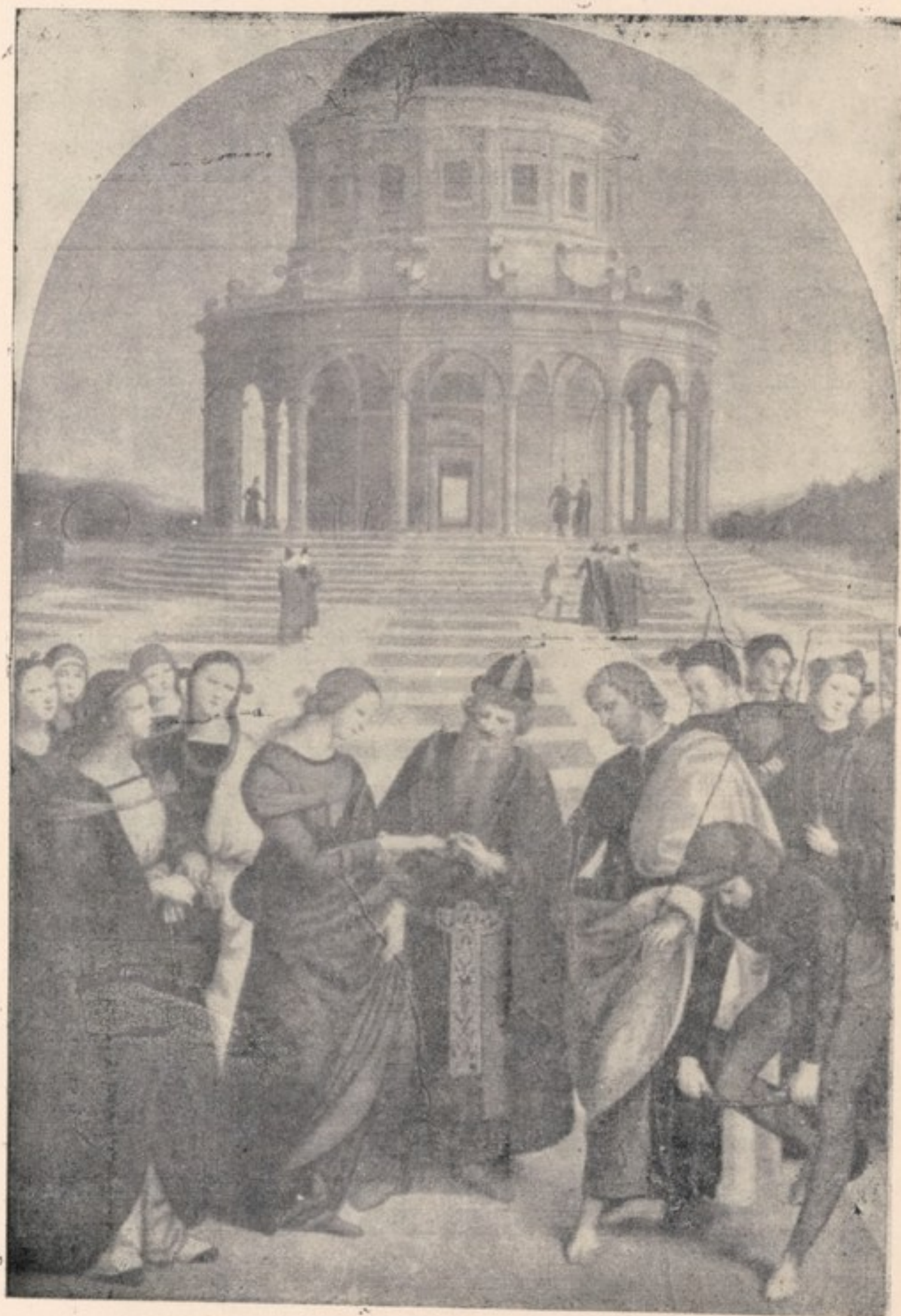
رافائل: «نامزدی ماری» (نمایشگاه بریرا) میلان