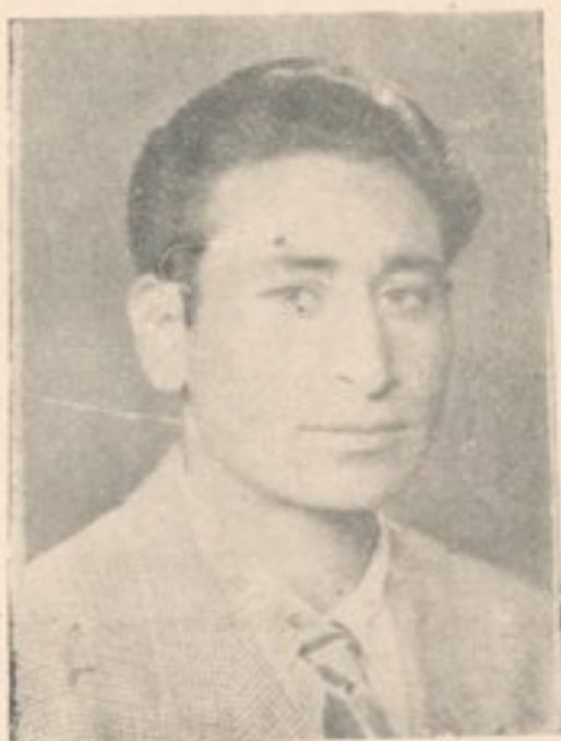
پروانه صنف دوم تاریخ و جغرافیه