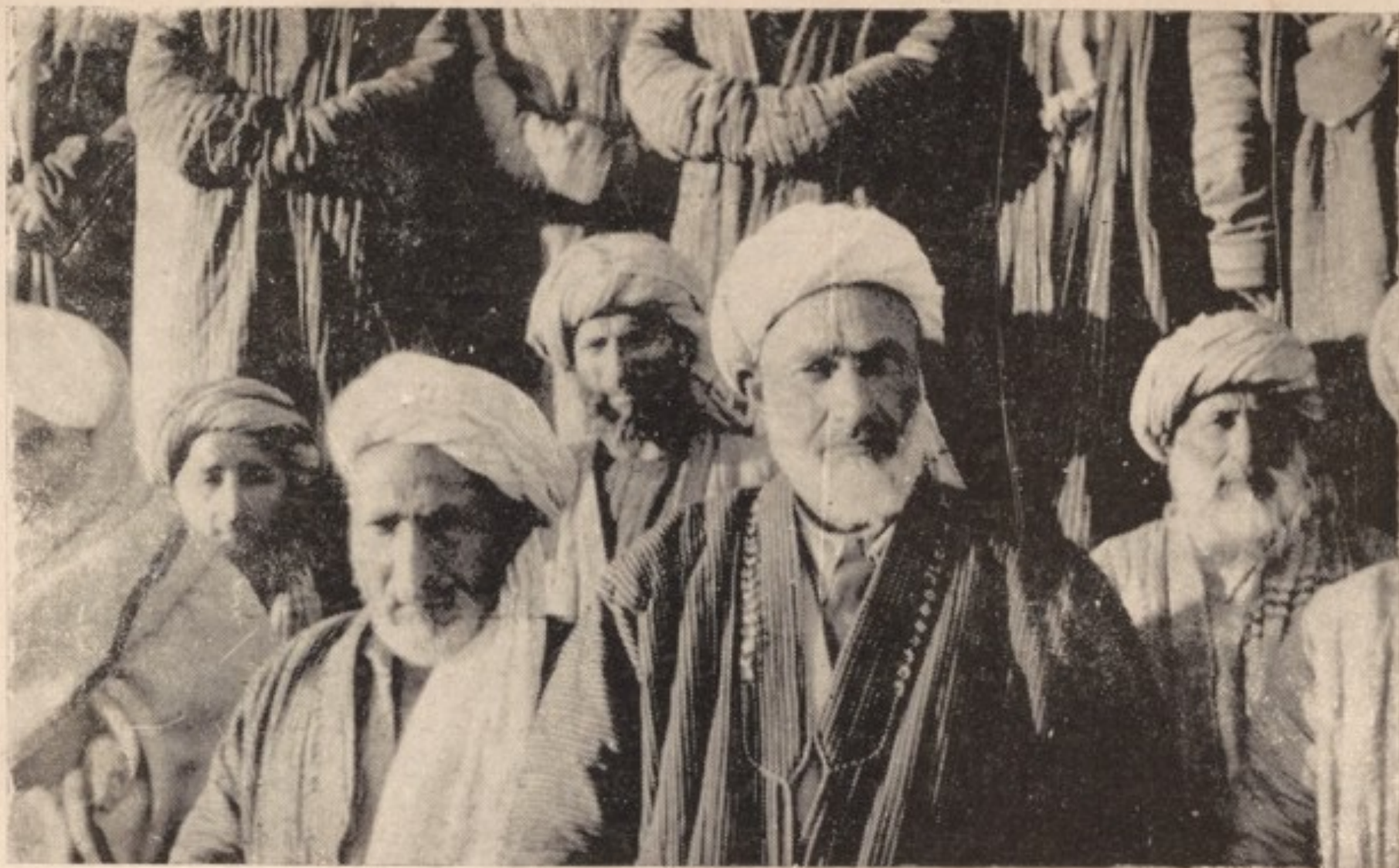
شیخ یك قریه. عرب در دولت آباد مزار شریف با برخی ریش سفیدان عربی زبان آنقریه