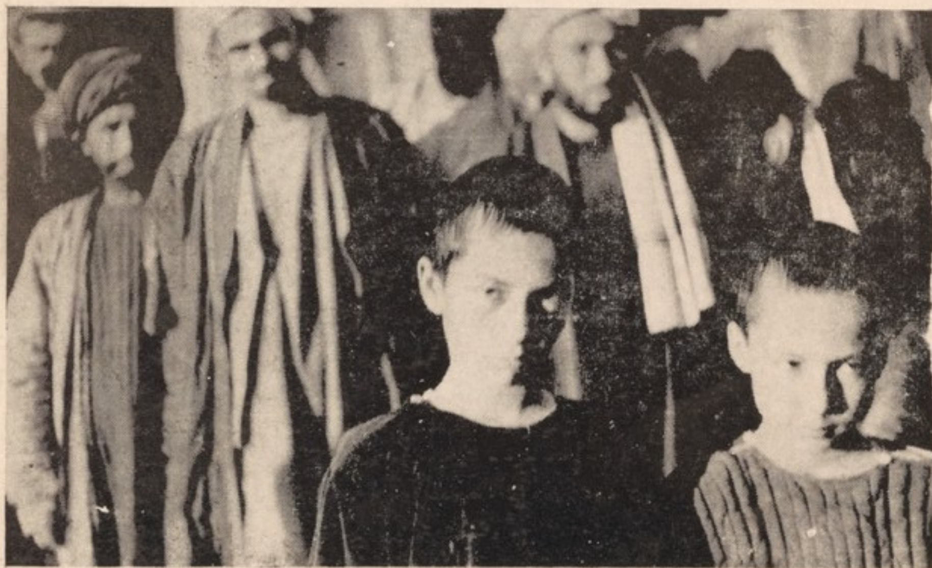
برخی از اطفال عربی پاداران شان در دولت آباد مزار شریف