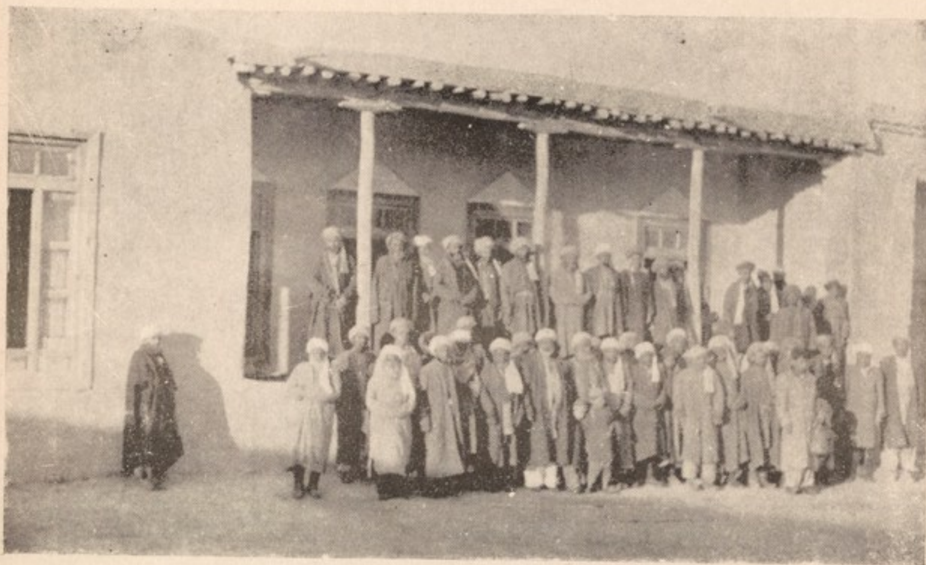
عده‌ای از اهالی يك قريه عربی در دولت آباد مزار شريف