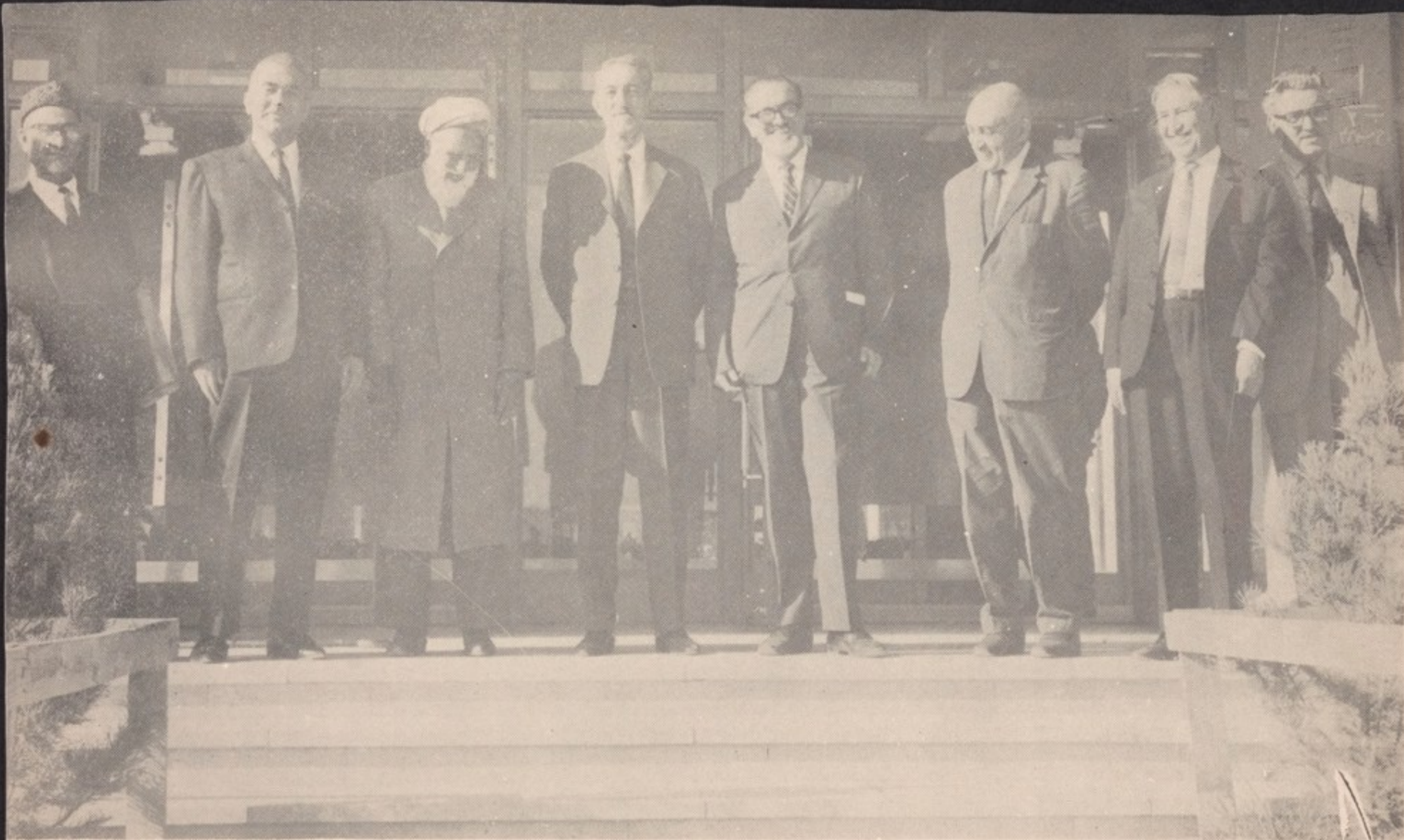
درین عکس بعضی از بیدل شناسان معروف افغانی مانند بناغلو علی محمد وزیر دربار سلطنتی، حافظ نور محمد کهگدای سرمنشی حضور ملو کانه، دکتور محمد انس سابق وزیر معارف، پوهاند غلام حسن مجددی رئیس پوهنځی ادبیات سناتور ملک الشعرا استاد بیتاب، گویا اعتمادی مشاور وزارت معارف و سید داود الحسینی با پر و فیسور بوسانی بیدل شناس معروف ایتالوی دیده میشوند.

دکتور محمد انس سابق وزیر معارف، پوهاند غلام حسن مجددی رئیس پوهنځی ادبیات سناتور ملک الشعرا استاد بیتاب، گویا اعتمادی مشاور وزارت معارف و سید داود الحسینی با پر و فیسور بوسانی بیدل شناس معروف ایتالوی دیده میشوند.