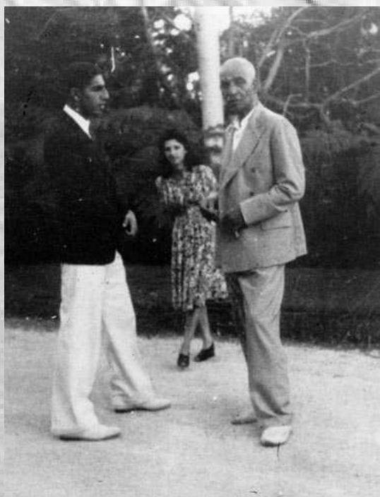
رضاشاه در تبعید، سال ۱۳۲۲