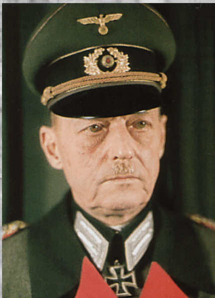
ژنرال فیلد مارشال گرد فن رونشتت

جنوبی به فرماندهی مارشال گرد فن روندشتت بود . جمعه، اول سپتامبر ۱۹۳۹، حدود ساعت ۴ و ۳۰ دقیقه صبح. جنگنده های شکاری آلمانی که آن را (شتوکا) می نامیدند، شهر لهستانی "ویلون" را زیر آتش خود گرفتند. حوالی ساعت ۴ و ۴۵ دقیقه کشتی جنگی "اشلسویگ هولشتاین" یک انبار اسلحه لهستان واقع در شبه جزیره "وستریلاته" در نزدیکی بندر دانسیگ را زیر آتش گرفت. بدین سان حمله به لهستان، با قدرت تمام آغاز شد. در پی این حمله هیتلر در برابر مردم آلمان سخنانی ایراد کرد و گفت: ( لهستان شب گذشته برای نخستین بار با سربازان ارتش منظم خود به خاک ما تیراندازی کرد. و حال از ساعت ۵ و ۴۵ دقیقه بامداد با شلیک متقابل پاسخ دادیم. لهستان دولتی بود خشونت بار. دولتی که با چماق پلیس و نظامیان حکومت می کرد. وضعیت آلمانی ها در این حکومت اسفبار بود).