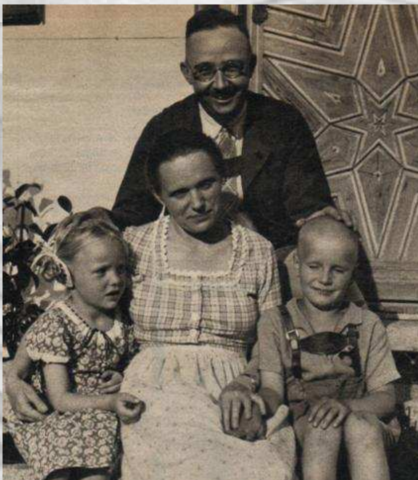
هاینریش هیملر در کنار خانواده اش

در سال ۱۹۲۳ هیملر به همراه آدولف هیتلر و تحت نظر ارنست روهم (فرمانده SA) در کودتای مونیخ شرکت کرد. در سال ۱۹۲۶ همسر آینده ی خود را در لابی هتل دید، در حالی که در اصل برای دور ماندن از طوفانی که جریان داشت به آنجا پناه برده بود. مارگارت سیگروت ۷ سال بزرگتر از او بود و زنی مطلقه و پروتستانت بود. آنها در تاریخ ۳ ژوئیه ۱۹۲۸ با یکدیگر ازدواج کردند. در همین زمان هیملر سعی کرد تا به عنوان یک دامدار یک مرغداری تاسیس کرد تا در آن کار کند که در این کار موفق نبود. تنها فرزند آنها گودرون در تاریخ ۸ اگوست ۱۹۲۹ به دنیا آمد. هیملر دختر