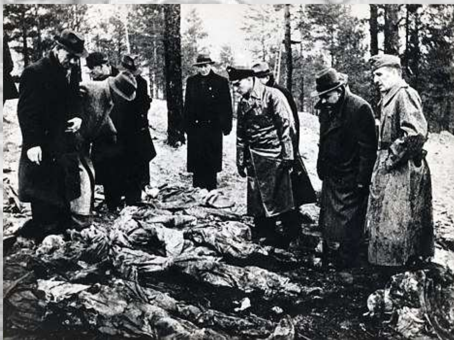
کشف اجساد سربازان لهستانی توسط آلمانی ها - جنگل کاتین

اکنون دیدگاه رسمی در روسیه این است که این اتحاد جماهیر شوروی بود که اروپا را آزاد کرد. روس ها بر این نکته تاکید می کنند که میلیون ها شهروند روس خود را در اثر مقابله با ارتش هیتلر از دست دادند و تنها مقصر جنگ را متوجه آلمان نازی می دانند. در قطعنامه شورای امنیت و همکاری اروپا که در ماه ژوئیه به تصویب رسید، این مساله ارائه شده بود که روسیه در مورد جنگ جهانی دوم نیز مقصر است. برای برخی کشورهایی که سال ها قبل جزو شوروی سابق بودند، مانند لهستان و کشورهای حوزه بالتیک، نقش روسیه در این جنگ چندان مثبت نبود. این کشورها به شوروی اشاره می کنند که با ورودش به جنگ، راه را برای حاکمیت ایدئولوژی کمونیستی برای بیش از نیم قرن در این کشورها مساعد کرد. روسیه نهاد دولتی جدیدی برای مقابله با جعل تاریخ روسیه بنیان نهاد. روسیه که امروز استالین را جنایتکار تاریخ می بیند؛ سعی بر برائت جویی از اتهامات دارد اما تاکنون نتوانسته خاطرات جنایتهای تلخ گذشته را که بر مردم اروپا روا داشته را از ذهن مردم اروپا و به خصوص مردم لهستان و آلمان پاک کند.