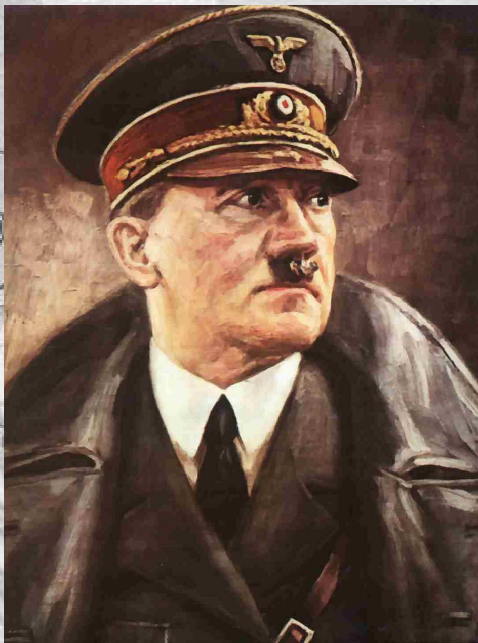
پیشوا آدولف هیتلر

ایران و آلمان در زمینه بازرگانی مکمل یکدیگر بودند. ایران مواد خام و محصولات کشاورزی و دامی مانند پنبه، غله، حبوبات، برنج، پشم، پوست، دانه‌های روغنی و قالی در اختیار آلمان قرار می‌داد و آلمان نیز تولیدات صنعتی، ماشین‌آلات، لوازم فنی، وسائط نقلیه، قند و شکر، دارو و مواد شیمیایی و کارخانجات مورد نیاز را به ایران صادر می‌کرد و از این لحاظ آلمان توانست تدریجاً موقعیت تجاری ممتازی در ایران به دست آورد. در زمینه تجارت خارجی به علت محدودیت‌هایی که دولت ایران از لحاظ اعتبار و پول بوجود آورده بود انگلیسی‌ها نتوانستند فعالیت‌های چشمگیر اقتصادی در ایران داشته باشند و در مقابل آلمان به بهره‌برداری از وضع پیش آمده پرداخت و با تأسیس کارخانه‌های متعدد در ایران و