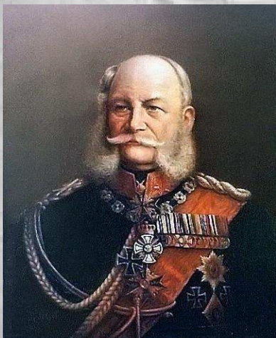
ویلهلم اول، امپراتور آلمان

آلمانی را به ایران بفرستد. ولی دولت آلمان به این درخواست ناصرالدین شاه توجه چندانی نکرد زیرا بیسمارک صدراعظم معروف آلمان به جهت حفظ دوستی کشورش با روسیه که سخت به آن نیاز داشت و به تصور آنکه چنین ارتشی در ایران ممکن است روزی علیه روسیه به کار گرفته شود، با آن مخالفت کرد و تنها به فرستادن دو افسر بازنشسته ارتش آلمان به ایران اکتفا نمود. در ۱۸۸۵ پیرو مذاکراتی که صورت گرفت دو کشور