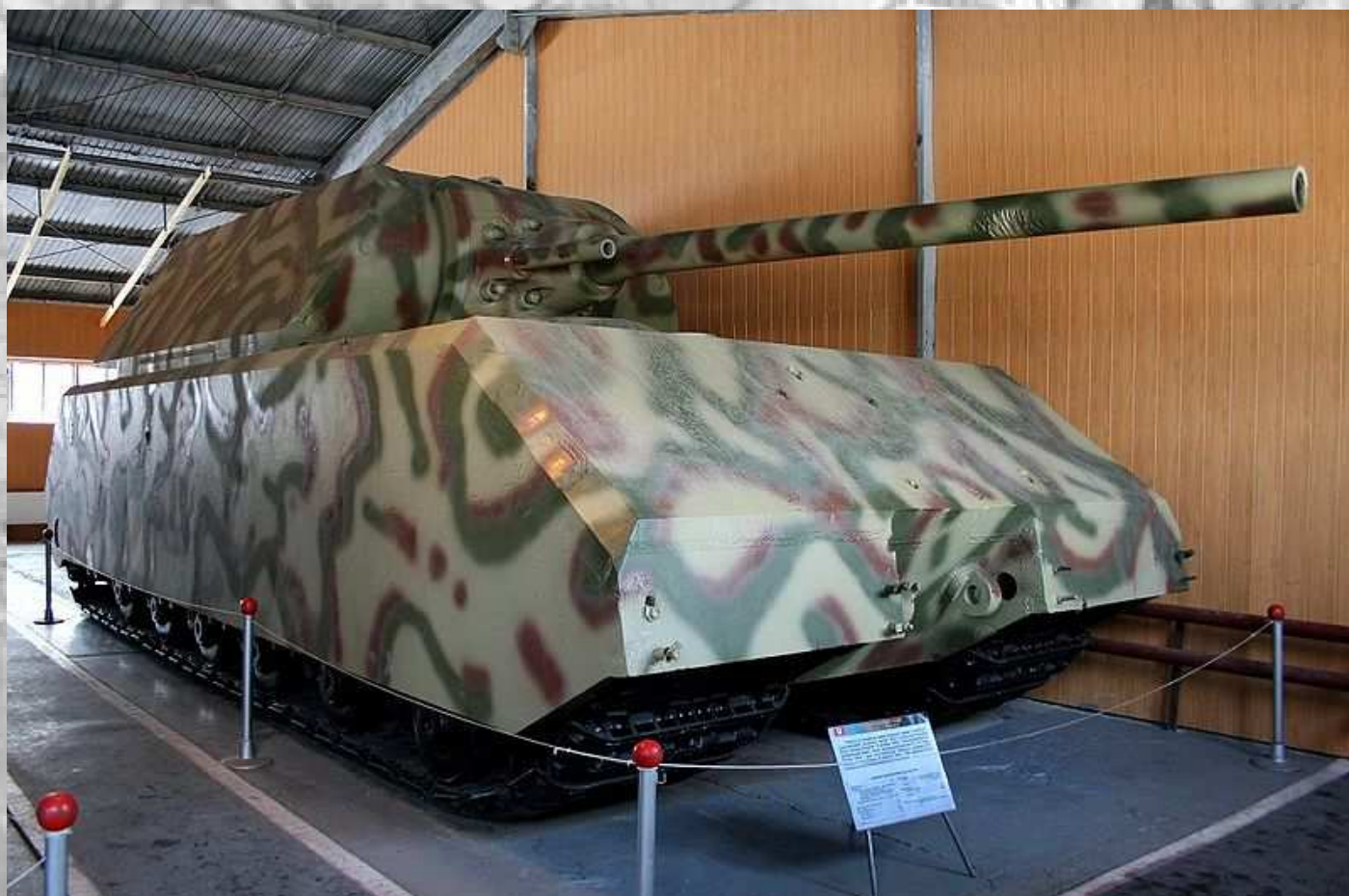
یکی از پیش نمونه های ماوس در موزه نیروی زرهی روسیه در شهر کوبینکا نزدیک مسکو

ارسال سنگ آهن از سوئد به آلمان، با مشکل مواجه شد. آلمان ها برای تولید ماوس و تولید برنامه ریزی شده بدنه با تنها ۲ دستگاه در نوامبر ۱۹۴۳، ۴ دستگاه در دسامبر، ۶ دستگاه و در ژانویه ۱۹۴۴، ۸ دستگاه در فوریه و پس از آن ۱۰ دستگاه در ماه بسیار کند بود اما در عوض تولید برجک به دلیل نیاز کم به فولاد، یک ماه جلوتر بود. هنگامی که جنگ پایان یافت، جمعا حدود ۹ دستگاه ماوس در مراحل مختلف و تنها دو دستگاه به طور کامل تکمیل شده بودند.