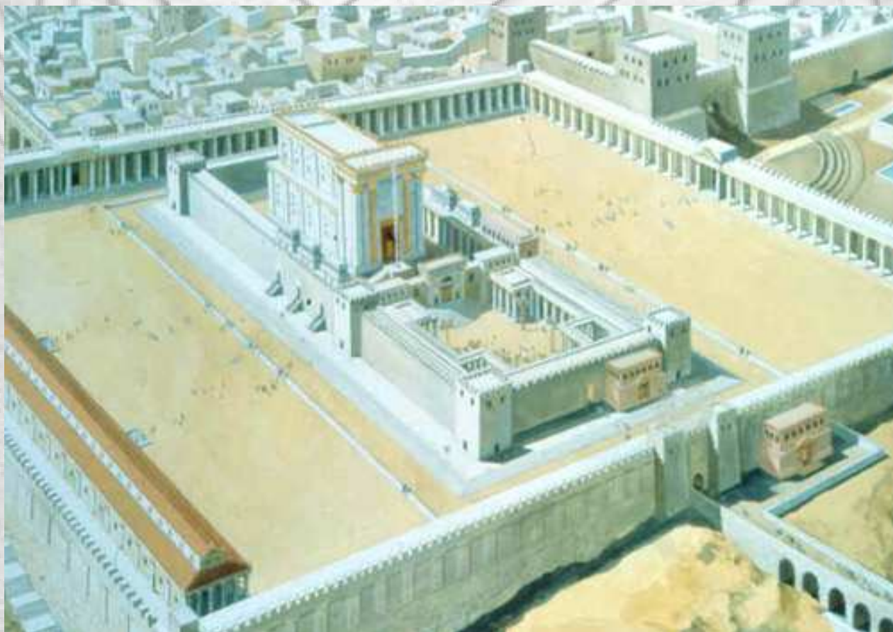
تصویری از هیكل سلیمان

توسط بابلیان و ویران شدن معبد سلیمان و اسارت، شکنجه و بردگی قوم بنی اسرائیل و کوچ آنان به بابل. ۱۳ - حمله کوروش هخامنشی پادشاه ایران زمین به شهر بابل، بازپس گیری فلسطین از بابلیان و آزاد شدن قوم بنی اسرائیل توسط وی و کوچ آنان به فلسطین و بازسازی معبد سلیمان و قدرت گیری مجدد بنی اسرائیل. ۱۴ - کشتار چندین هزار تن از مردم ایران توسط ملکه خشایار شاه (استر یک یهودی بود که مذهب خود را از خشیار شاه مخفی نگه داشته بود) بدلیل مقاومت در برابر خواسته های یهودیان. ۱۵ - تسخیر اورشلیم به دست رومیان. (به این ترتیب بنی اسرائیل برای چندمین بار توانائی حکومت بر خود را از دست دادند و تحت سلطه ی رومیان درآمدند و تا زمان "جنگ های صلیبی" در دست رومیان باقی ماند.