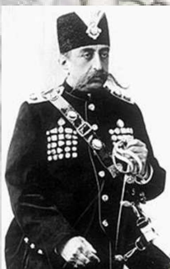
ناصرالدین شاه قاجار

امپراطوری آلمان مدتها بعد از امپراطوری های بریتانیا و روسیه در صحنه سیاسی و اقتصادی ایران ظاهر شد. در زمان صفویه و در دوران شاه عباس کوششی برای ایجاد روابط با آلمان به عمل آمد ولی به نتیجه نرسید. در نیمه قرن نوزدهم و