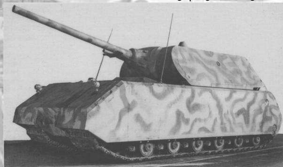
ابر تانک ماوس

نیازی به یاد آوری نیست که اگر این تانک واقعا بر روی جاده ای حرکت می کرد، در پشت خود ردی از آسفالت متلاشی شده بر جای می گذاشت. زره جلویی برجک، قطورترین زره در بیشتر تانک ها تقریبا یک چهارم متر ضخامت داشت و تقریبا در برابر تمامی جنگ افزار های ضدتانک آن زمان متفقین کاملا مقاوم بود.