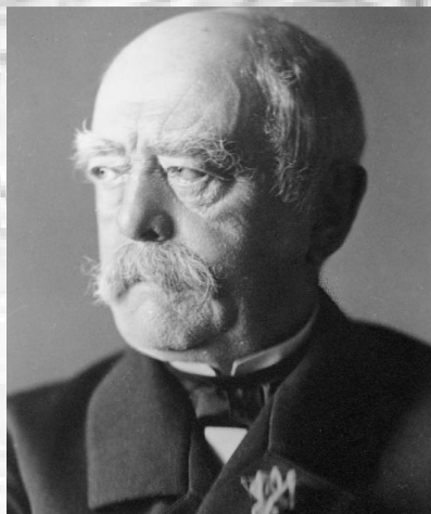
بیسمارک، صدر اعظم آلمان