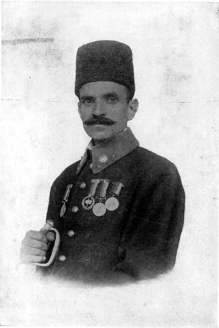
محمد حسین خان بیگ (علیگ) رئیس تدریسات عمومی افغانستان