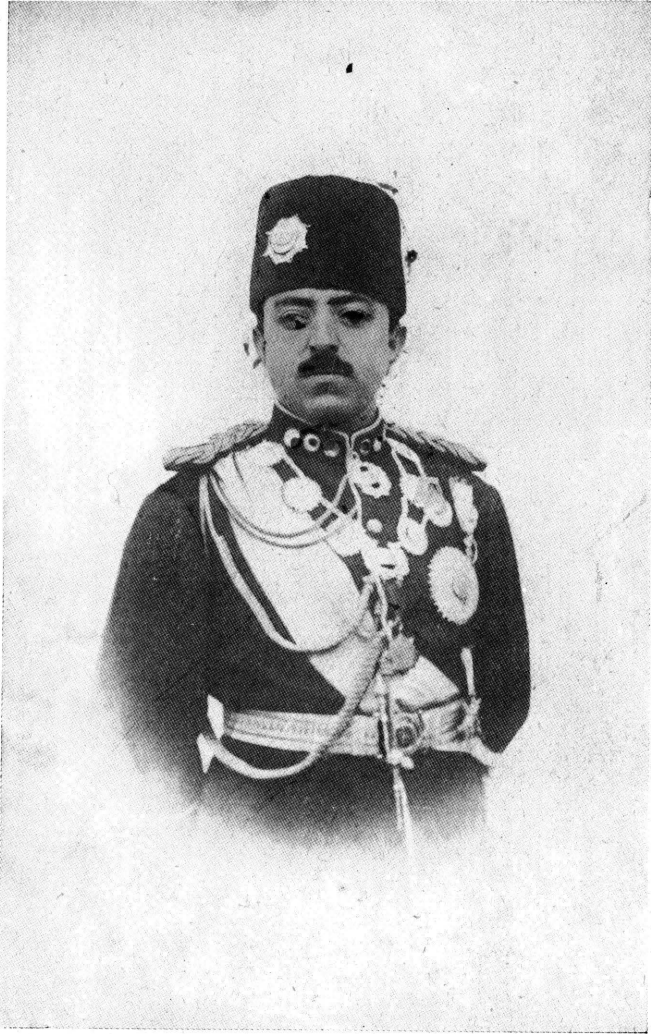
اعلیٰ حضرت غازی امان اللہ خان خلد اللہ ملکہ و حکمہ فرمانروا ولایت افغانستان