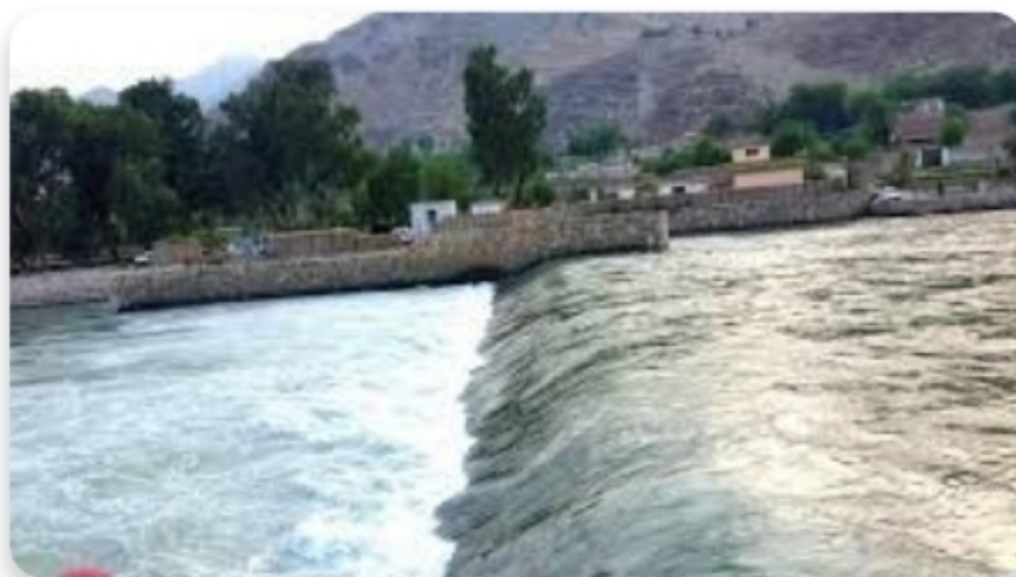
پیچ دری سیند

کی سره زر هم شته چی زرکشان یی ترې راوباسي د دې سیند لوی مرستیالان د پیچ سیند او د لنډي سیند مرستیالان دی د کونړ سیند باندی د برېښنا (۳) بندونه جوړېږی (۱) سره تاق بند چی (۲۵۰۰) میگا واټه برېښنا تولیدوی (۲) مناکی برېښنا بند (۲,۵) میگا واټه برېښنا تولیدوی (۳) څاکی برېښنا بند له دی څخه د څاکی برېښنا بند په کار پیل کړی دی او ښار ته برېښنا ورکوی د مناکی برېښنا بند هم جوړ شوی خو تر اوسه د سره تاق بند په جوړولو کار نه دی پیل شوی. دا چی د کونړ سیند په زیات رفتار سره مخ په ښکته روان دی د کښتی چلولو لپاره مناسب نه دی د کونړ خلک زیاتره د چینی اوبو څخه کار اخلی خو په هوارو ساحو کی خلک له کوهیانو څخه کار اخلی .