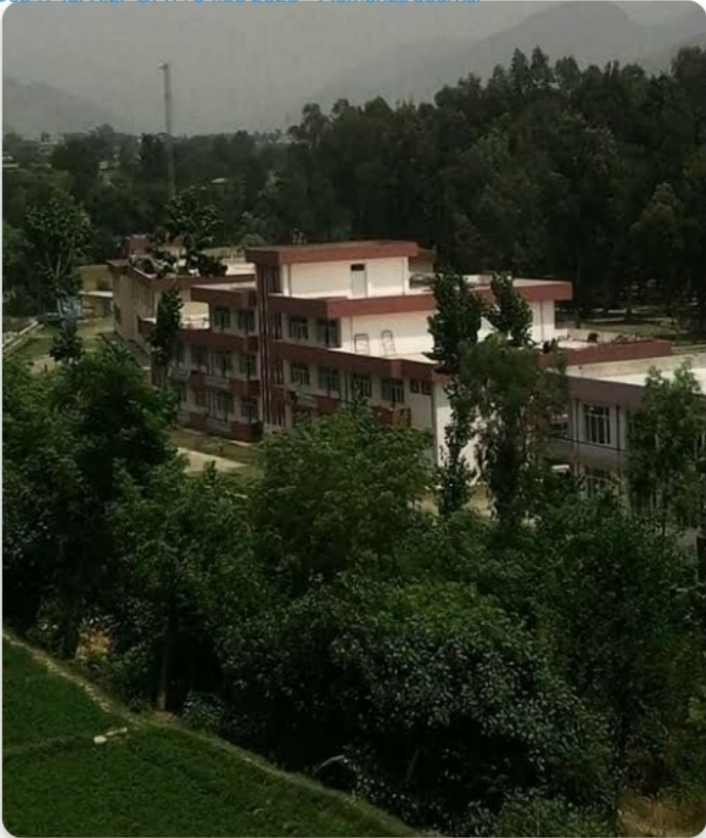
د سيد جمالدين پوهنتون