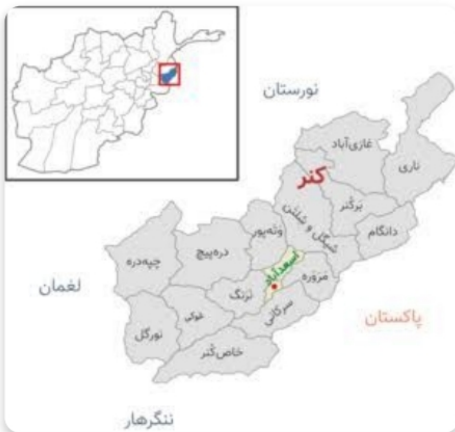
کونړ ولسوالیو نقشه

د شلتن ولسوالۍ نوى په رسميت پيژندل شوى مخکې د شيگل ولسوالۍ مربوط وه له همدې امله په اړه يې معلومات نشته