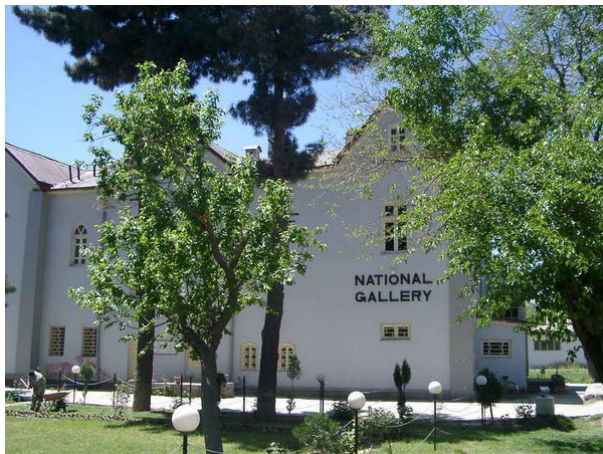
د ملي گالري انځور

گالري يوه فرانسوي کلمه ده. په افغانستان کې هغه ځای ته ويل کېږي چې د نقاشۍ او میناتورۍ ارزښتناک کلاسيک او معاصر آثار پکې ساتل کېږي. د موزيم تابلوگانې او نور نقاشي شوې آثار د څېړونکو د څېړنې لپاره ډېر زيات ارزښت لري. په هر حال لرغوني آثار چې په ملي موزيم، ملي ارشيف او ملي گالري کې ساتل کېږي، د ټولني د سياسي، اقتصادي او فرهنگي، پوځي او ټولنيزو حالاتو د درک لپاره د څېړونکو او تاريخپوهانو د مطالعې او څېړنې لپاره اصلي منبع بلل کېږي. ملي گالري د کابل ښار په آسمایي واټ کې موقعيت لري.