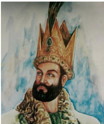
سلطان محمود غزنوي

سلطان محمود د سبکتګین زوی و چې په غزنوي مشهور دی، د نړۍ له مشهورو پاچاهانو څخه گڼل کېږي. هغه په ۳۶۲ هـ.ق کال نړۍ ته سترګې پرانستې او په ۴۲۱ هـ.ق کې وفات شوی دی. سلطان محمود غزنوي د پاچهي پر تخت له کښېناستو سره سم ورو ورو د خپلې خاورې لمن