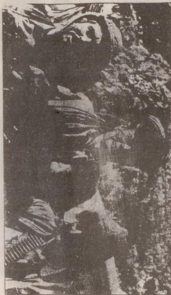
د خوښت په ژورو کې چا لور لاسن