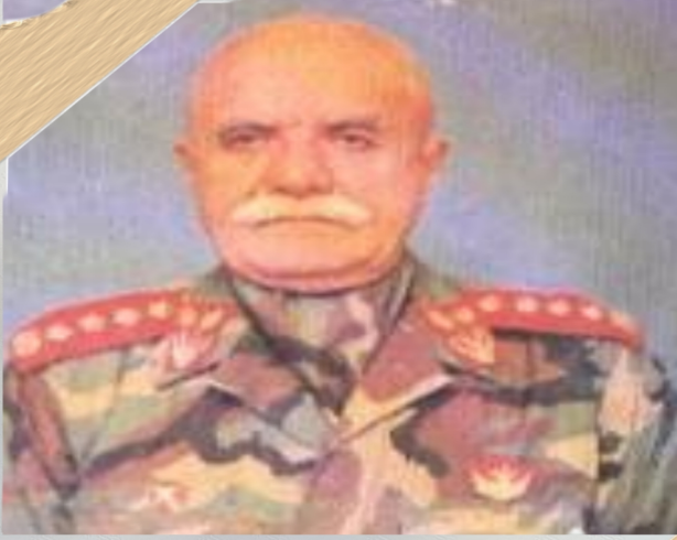
جنرال رحمت اللہ صافی