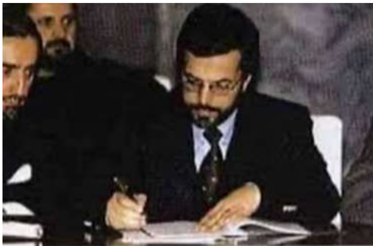
Der Innenminister Junus Kanuni (Bildmitte) unterstützt im Beisein von Außenminister Abdullah Abdullah und Verteidigungsminister Kasim Fahim (rechts) den Vertrag zur Entsendung von Streitkräften auf dem Gebiet Afghanistans.

مجاهدینو او یو شمېر نورو فسادګرو یو ګډه ترکیب رامنځته کړ او دې ته یې د ((ملي وحدت)) د حکومت نوم ورکړ. د دې حکومت مشر اشرف غني بیا خپل واک ته دوامه تېری و، چې له کوم دقت او ځنډ پرته یې له امریکا سره امنیتي تړون لاسلیک کړ