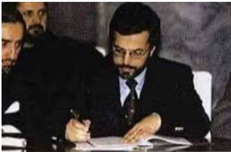
Der Innenminister Junus Kanuni (Bildmitte) unterstützt im Beisein von Außenminister Abdullah Abdullah und Minister Kasim Fahim (rechts) den Vertrag zur Unterzeichnung der Streitkräfte auf dem Gebiet Afghanistans.

مجاهدینو او یو شمېر نورو فسادګرو یو ګډه ترکیب رامنځته کړ او دې ته یې د ((ملي وحدت)) د حکومت نوم ورکړ. د دې حکومت مشر اشرف غني بیا خپل واک ته دوامه تېری و، چې له کوم دقت او ځنډ پرته یې له امریکا سره امنیتي تړون لاسلیک کړ