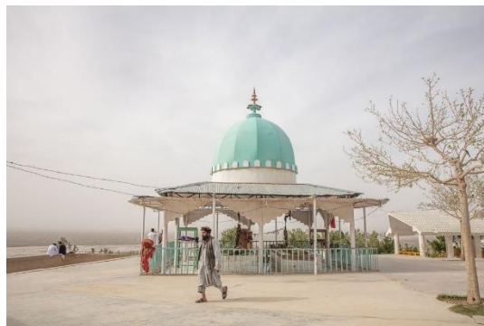
بابا ولي زیارت

موی مبارک، شاه مقصودآغا، بابا ولي، حضرت جي بابا، جمال بابا، شين غزی اصحابي، دارو نيکه، پير ملا محمدجان اخوند، صابرشاه ملنگ، ميرويس هوتک، احمد شاه دراني، زرغونه انا، ماللي، شېرسرخ، ملاشېراخند، سپين کوشي بابا، صوفي صاحب، اخوند صاحب، ابراهيم خليفه بابا، د ميوندشهيدانو څلورلاري، ميا نورمحمد صاحب مزار، خوجک بابا، ملاکته اخوند، ملا اکا، ملا عبدالحق اخوند، شېخ قلندر، ملا حسن ساکزي، کاکو بابا، بگت بابا، پير زالو بابا، ملا صالح محمد اخوند، ډنگر بابا، کابلي شاه، پير زنگي بابا، کاکو بابا، کوټ بابا، زنجير پا، خواجه ملک، جان لالا، شېخ قلندر، يک خاک شهيدان، د شنو گومبتو زیارت او داسي نور.