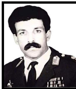
ډګروال محمد ظاهر شاه (د پروفیسور رسول امین ورور)