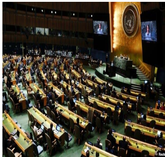
(۵) دملگرو متونو د عمومي اسمبلی مقر نیویارک امریکا