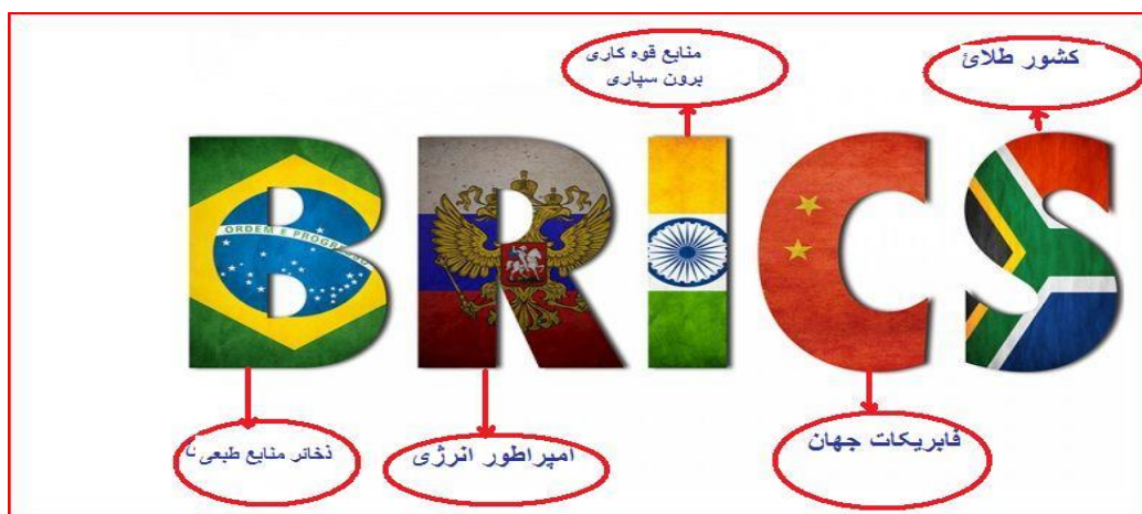
(۵) په عکس کې د عضوه هیوادونو یوه یوه مهمه ځانگړنه په سره خط کې تاو شوي