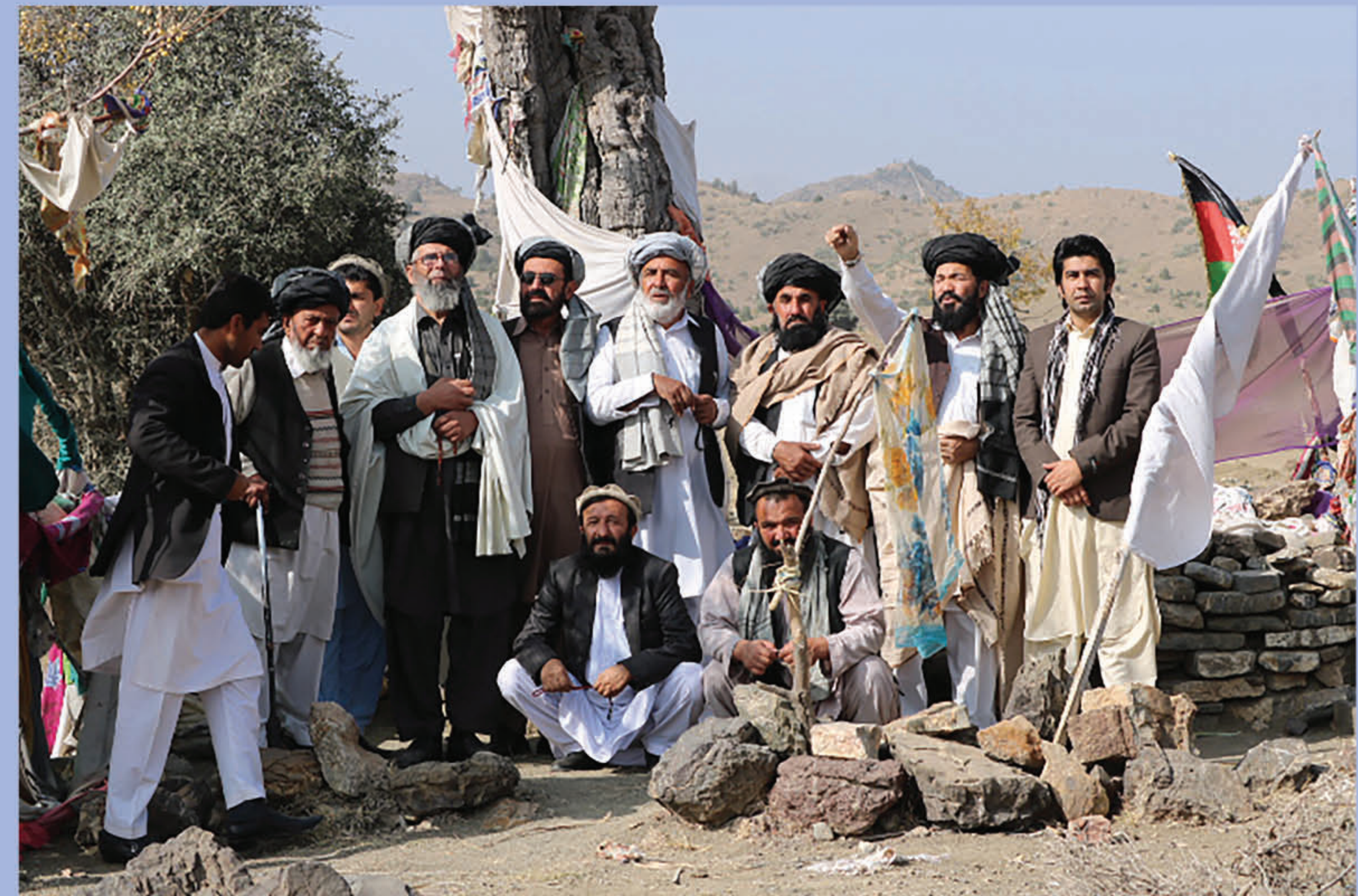
د مغلگی د شهیدانو هدیره