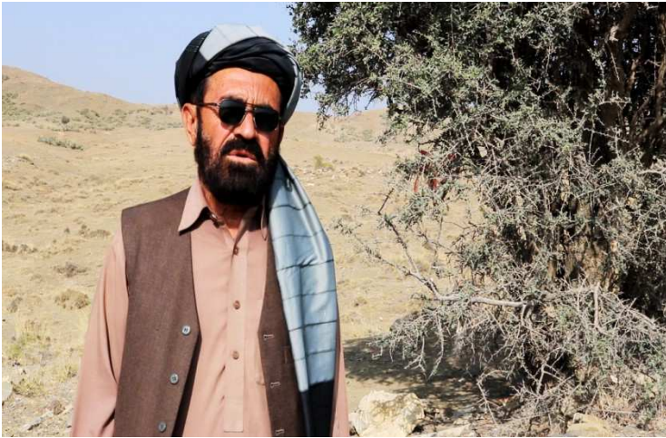
د مغلگی په مقام له بناغلي میرناگل تنيوال سره مرکه.