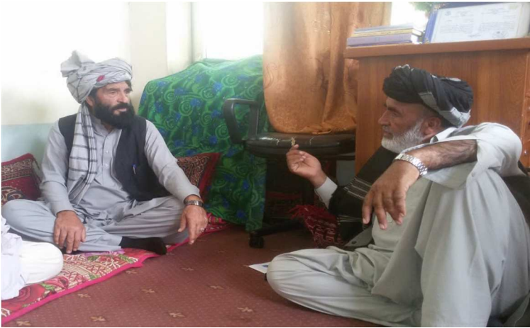
په نریزې کلي د انگریزانو د بمبارد په تړاو د حکیموالي سره مرکه