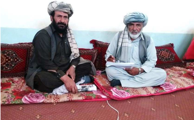
د طلا گل سره مرکه