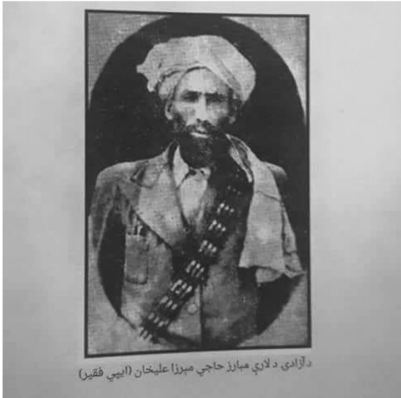
د خپلواک منځني پښتونستان ولسمشر حاجي ميرزا علي خان (اببي فقير)