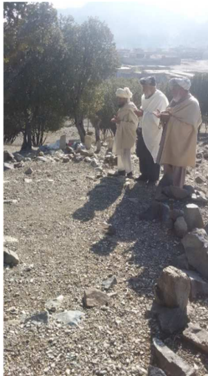
د شهیدې گل غزړې ترور او د هغې د پنځو لمسیانو قبرونه.