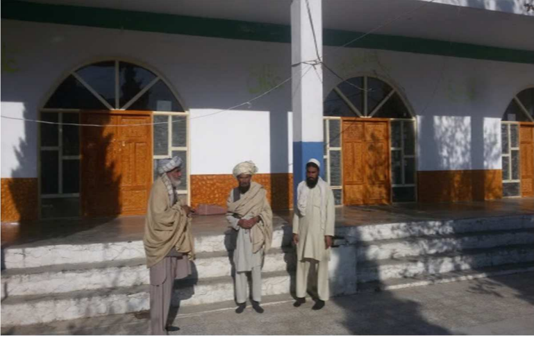
اکا جومات چې انگریزانو ۱۹۴۲ز کال بمبارد کړ