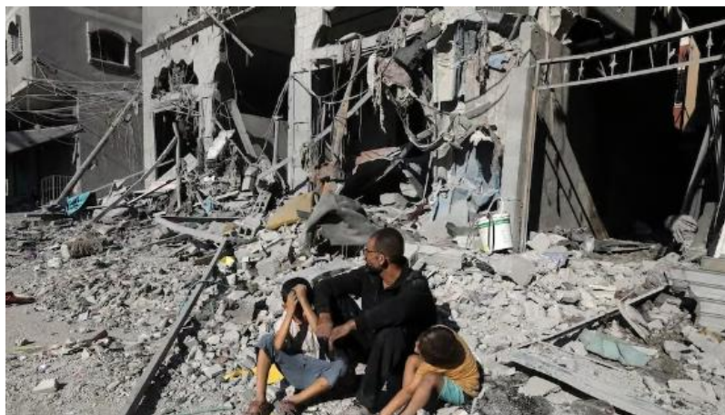
د غزي ترانگي انځور د جگړې ليکي نه