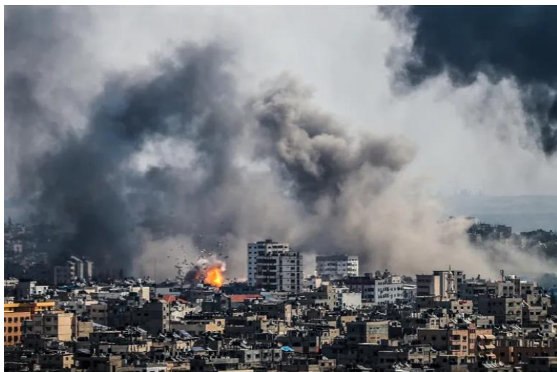
د غزي ترانگي انځور د جگړې ليکي نه