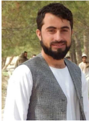
نصیب الله زاهد