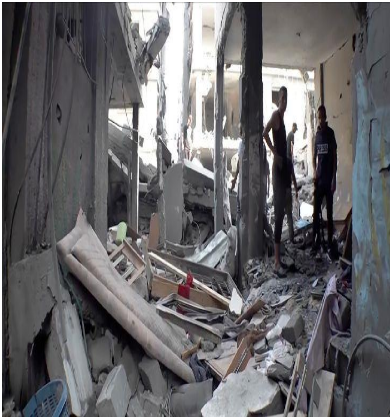
داسرائيلي اشغالگرو د وحشت يوبل انځور.