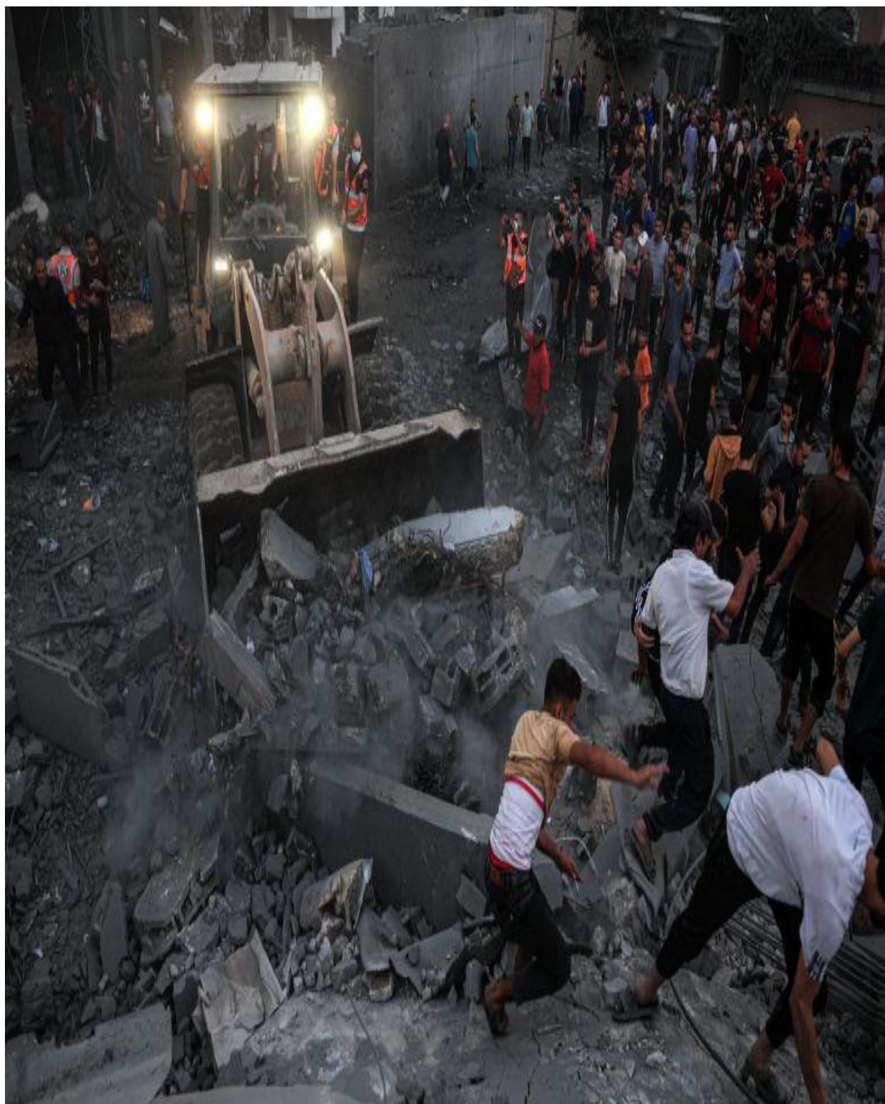
دغزې ښار ویجاړی .