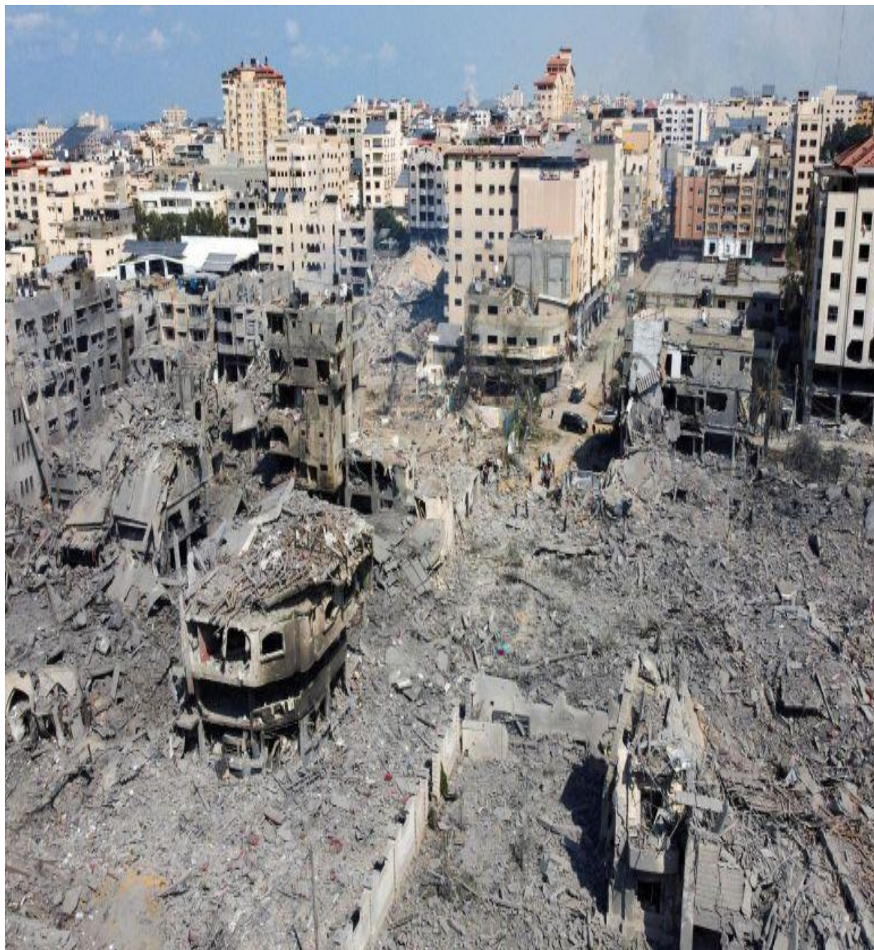
د اسرائیلو دو حشت یو انځور.