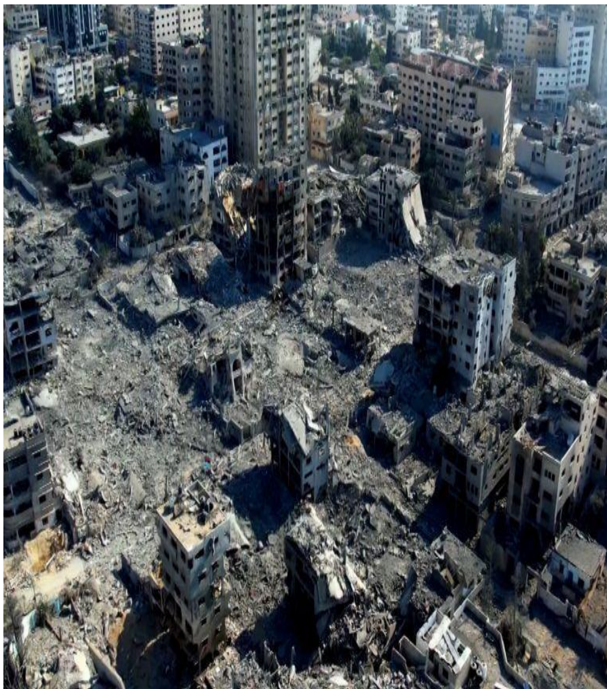
دغزی بنار ویجاری .