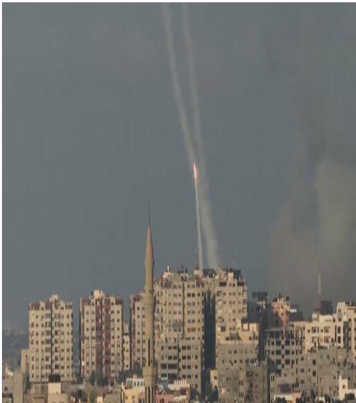
ورځ داشغالگرو د وحشت انځور.