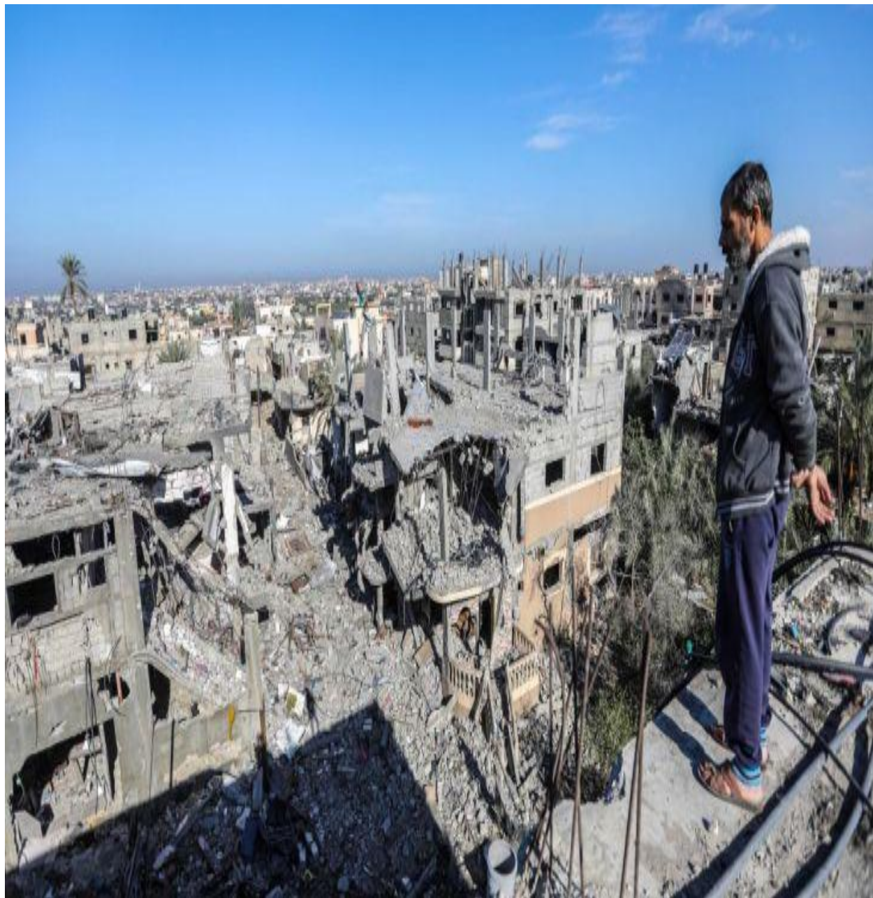
دغزی دمظلومو فلسطینیانورنگ شوی بنار زیره دردونکی انخور.