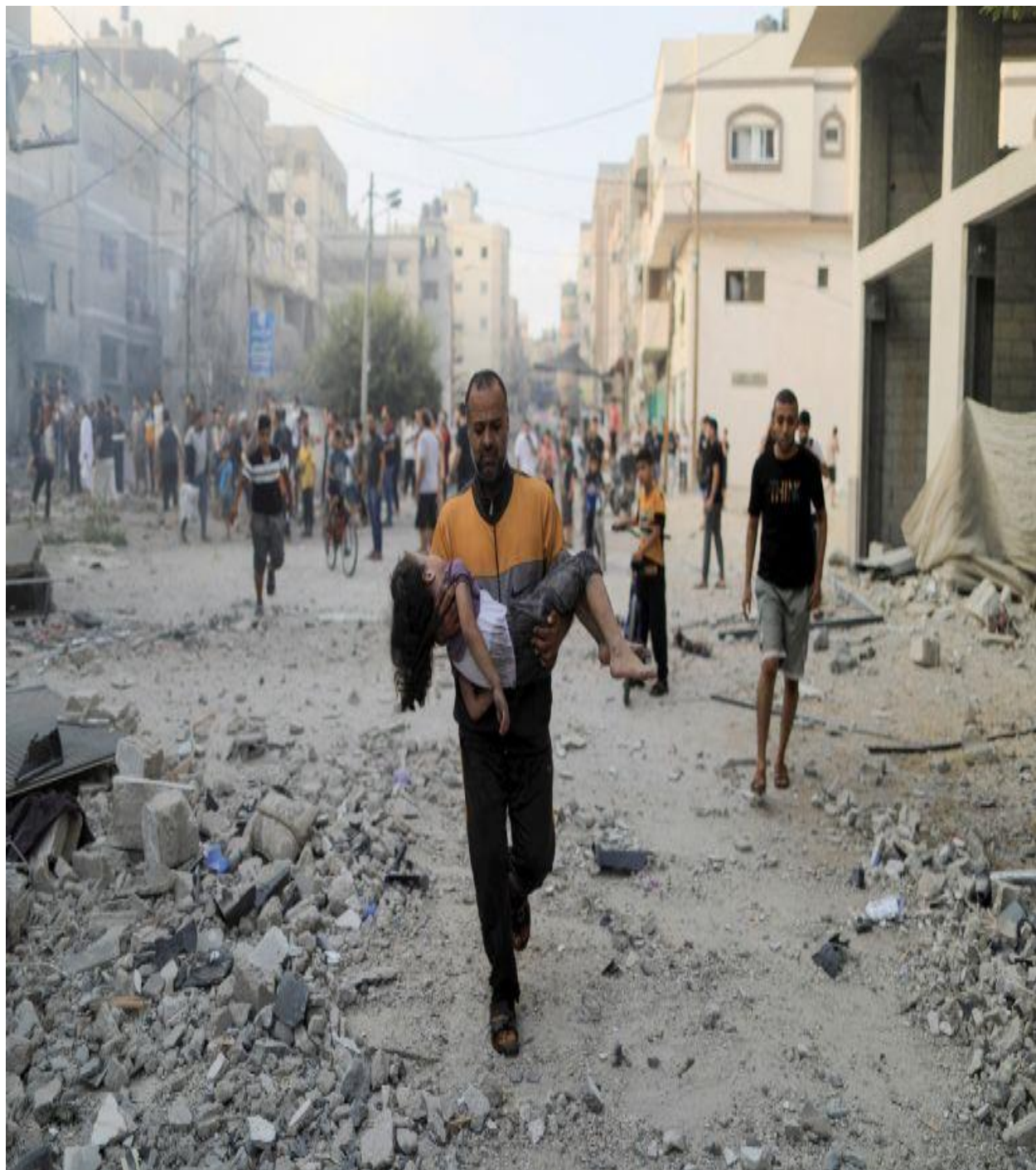
داهغه ویجاری ده چی کفری اسرائیلی لهنکرد غزی ترانگی په جنوبی برخه خانیونس سیمه کې ترسره شوی ده .