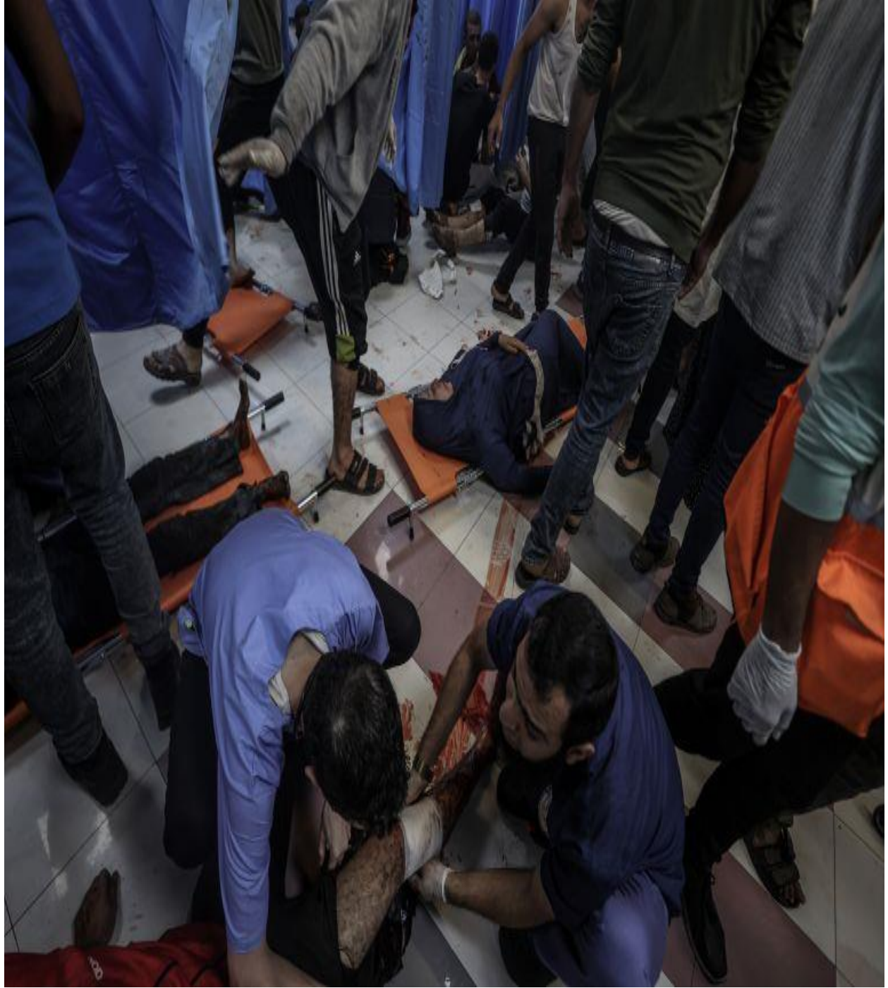
اسرائيلي بمباريه معمدانى روغتون كې 500 بيگناه فلسطينيان په شهادت ورسيدل .