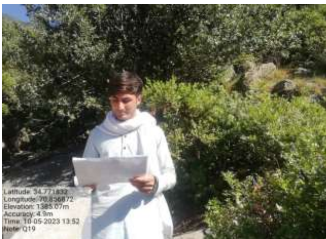
شکل (۲۴): د د ډیتا راټولولو بنودنه کوي