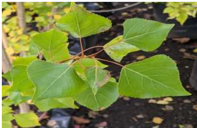
شکل (۱۴): د سفیدار بنودنه کوي