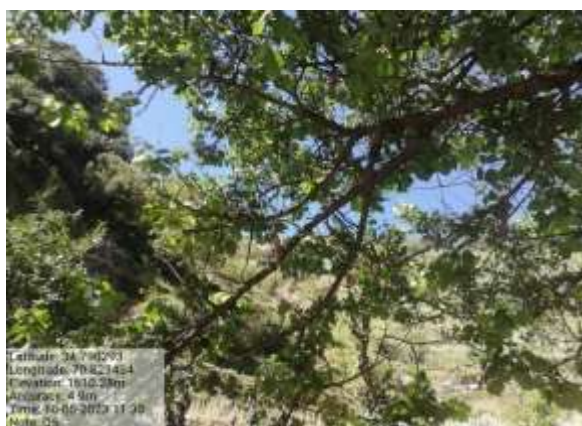
شکل (۱۰): د تور املوک ښودنه کوي