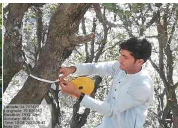
شکل (۷): د قطر د اندازه کولو ښودنه کوي