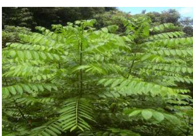
شکل (۱۵): د شنې بنودنه کوي