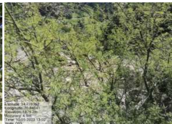
شکل (۹): د پلوڅې ښودنه کوي