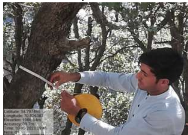
شکل (۲۱): د قطر اندازه کولو بنودنه کوي