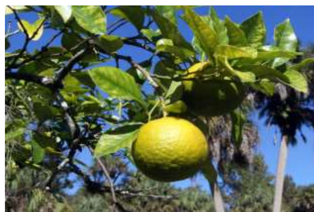
شکل (۱۸): د نارنج بنودنه کوي