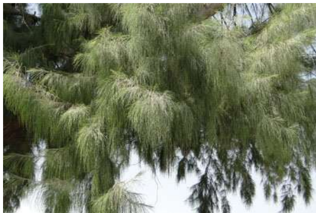
شکل (۱۳): د غز بنودنه کوي