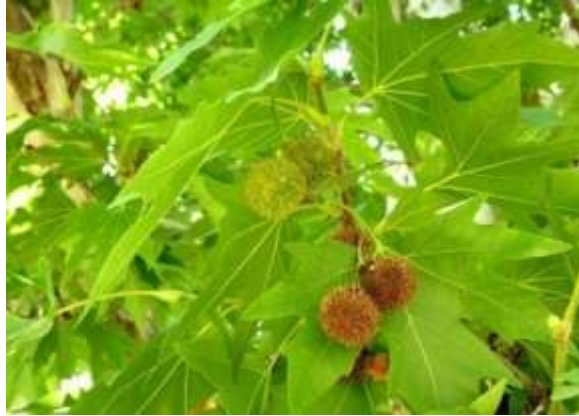
شکل (۲۰): د چینار بنودنه کوي