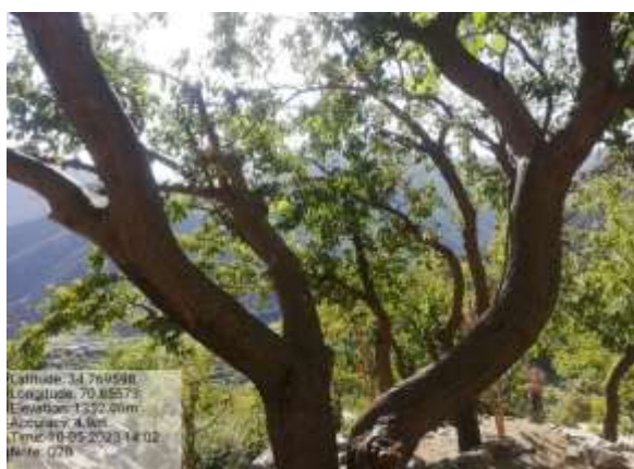
شکل (۱۲): د توت ښودنه کوي