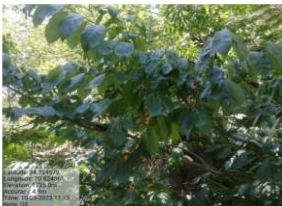
شکل (۸): د الوچې ښودنه کوي