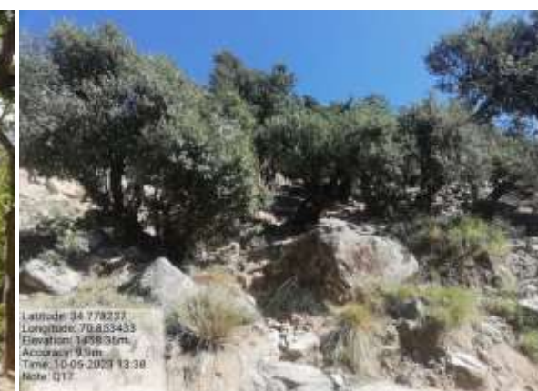
شکل (۱۱): د څپړۍ ښودنه کوي