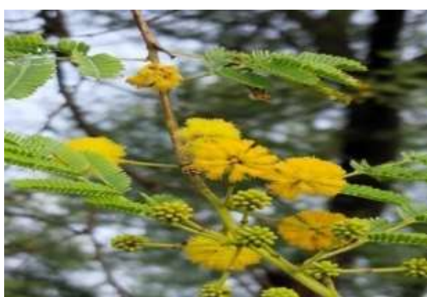
شکل (۱۷): د کیکر بنودنه کوي