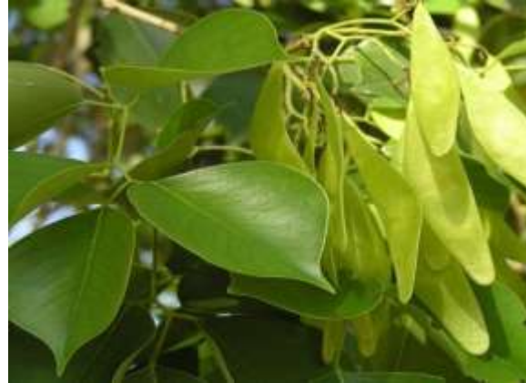
شکل (۱۹): د شوې بنودنه کوي