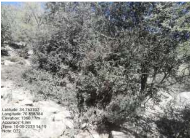
شکل (۲۲): د بیرې بنودنه کوي