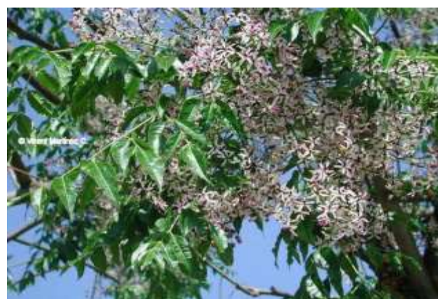
شکل (۱۶): د بکیانې بنودنه کوي