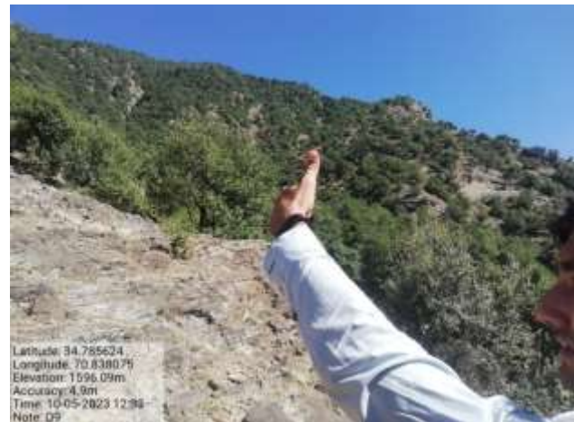
شکل (۲۳): د ونې د ارتفاع د اندازه کولو بنودنه