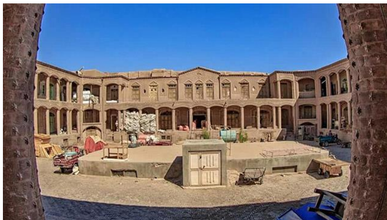
د هرات کاروان سراي انځور د مفکورې ورکولو په اړه

د صفویانو په دوره کې د کاروانسرایونو په منځ کې د شاه عباسي کراچ کاروانسرای دی چې د شاه سلیمان صفوي په وخت کې د ۱۰۷۸ او ۹۱۱۰ ترمنځ جوړ شوی و.