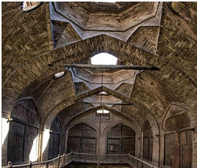
د هرات کاروان سرای انځور د مفکورې ورکولو په اړه