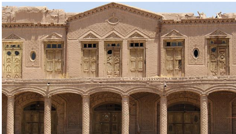
د هرات کاروان سرای انځور د مفکوري ورکولو په اړه