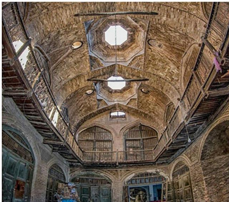
د هرات کاروان سرای انځور د مفکوري ورکولو په اړه