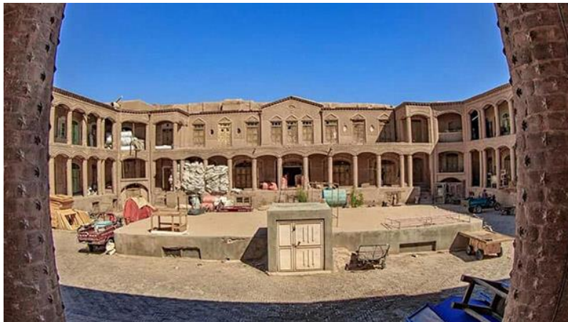
د هرات کاروان سراي انځور د مفکورې ورکولو په اړه

د صفویانو په دوره کې د کاروانسرایونو په منځ کې د شاه عباسي کراچ کاروانسرای دی چې د شاه سلیمان صفوي په وخت کې د ۱۰۷۸ او ۹۱۱۰ ترمنځ جوړ شوی و.