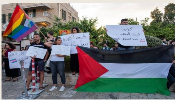
د فلسطین په وطنی او سیکولر نظام کی متعلمین او محصلین او د همجنسبازي مظاهري