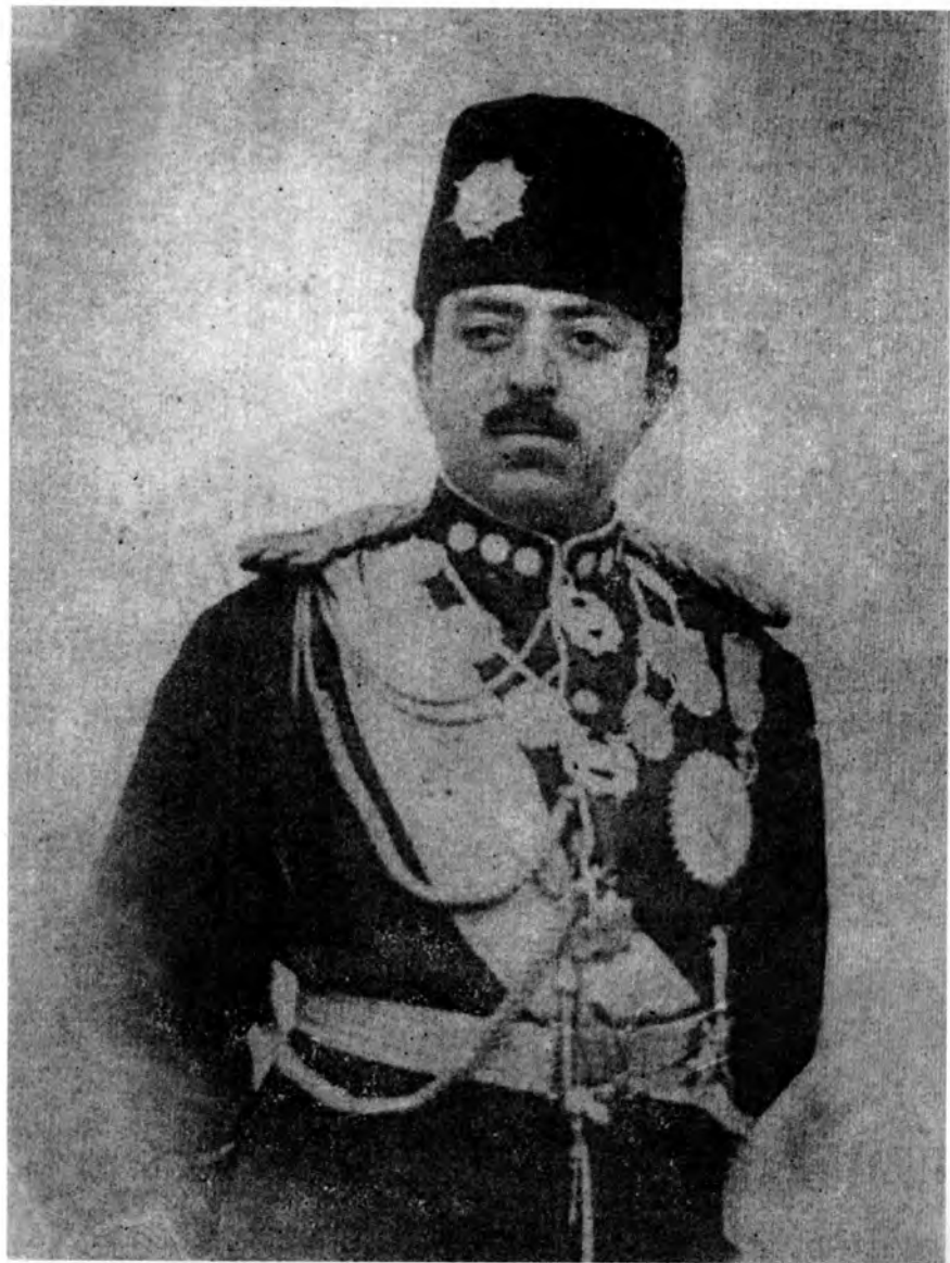
پاچا امان اللہ د پاجايي په جامه کې