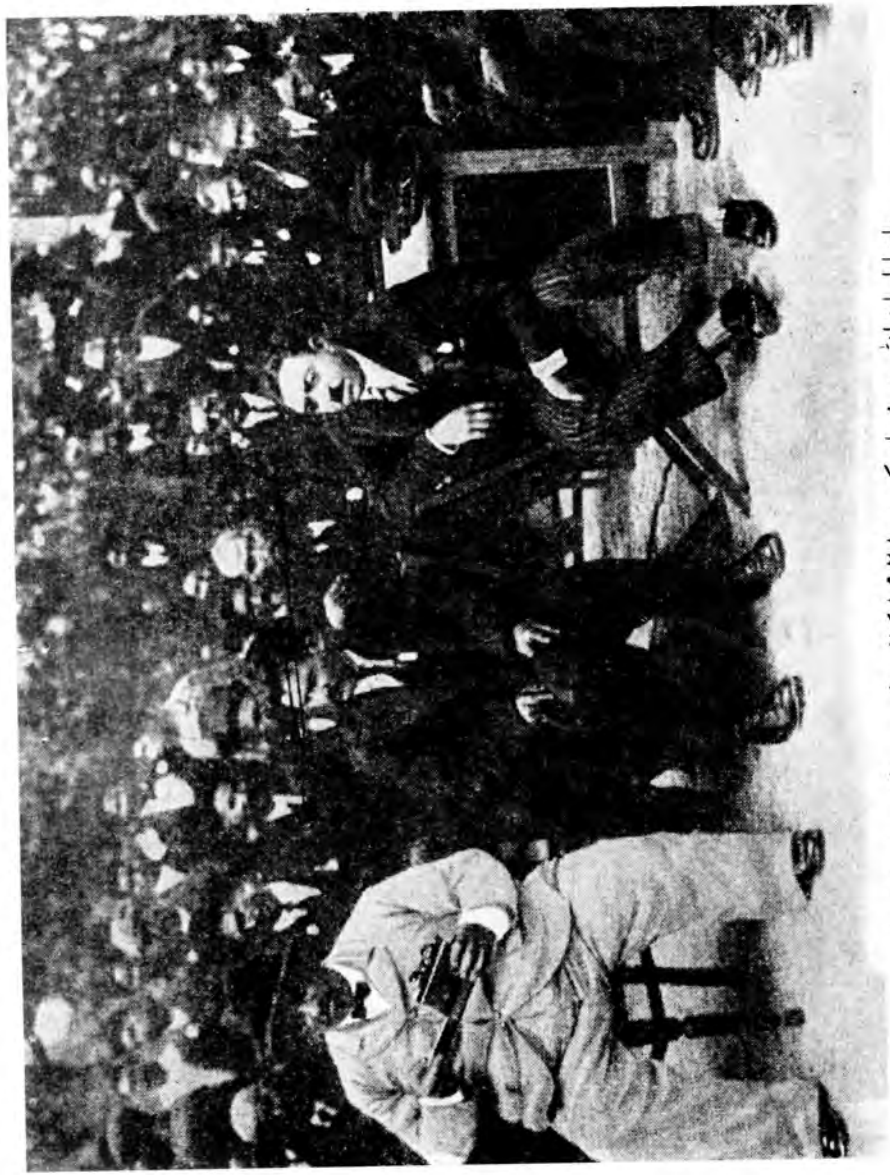
پاچا امان اللہ پہ پشمان کي د ۱۹۲۸ کال د لويي جرگي د استازو او خپل مشر وروږ سردار عنايت اللہ سره