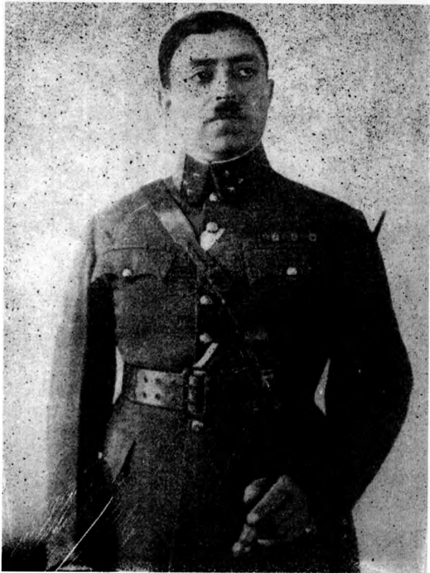
پاچا امان اللہ پہ نظامی یونیفورم کے