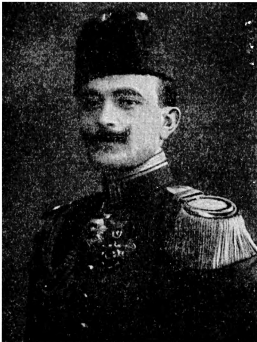
انور پاشا (۱۹۸۲-۱۹۲۲) د ځوانو ترکانو مخکین مشر