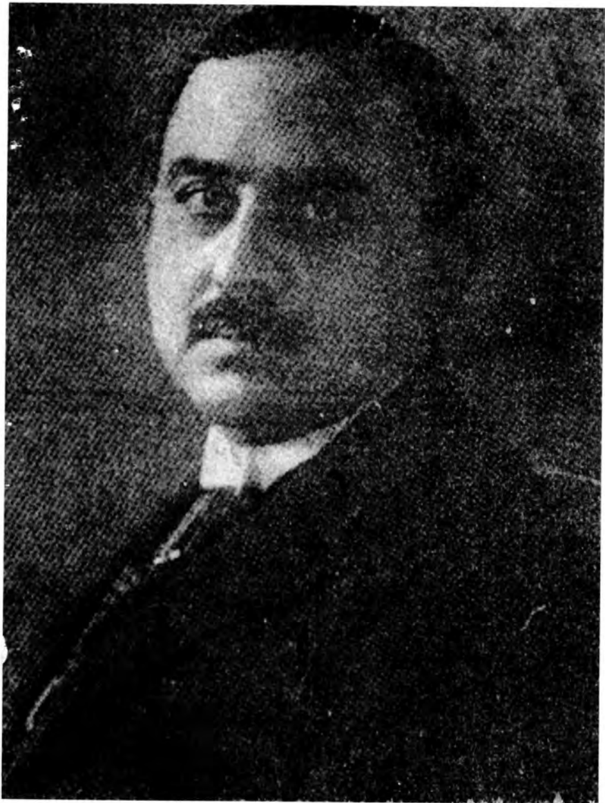
محمد ولي د پاچا امان الله نایب