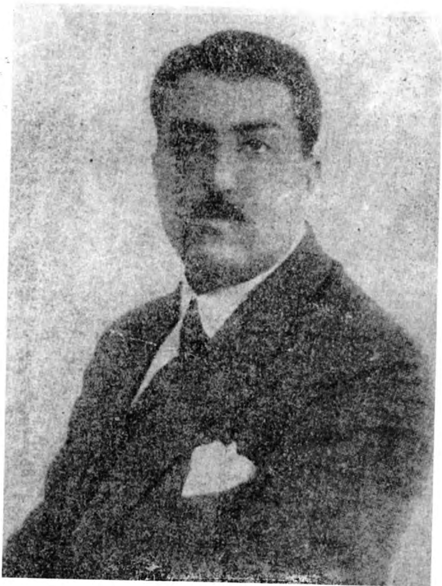
غلام صديق خان خرخي