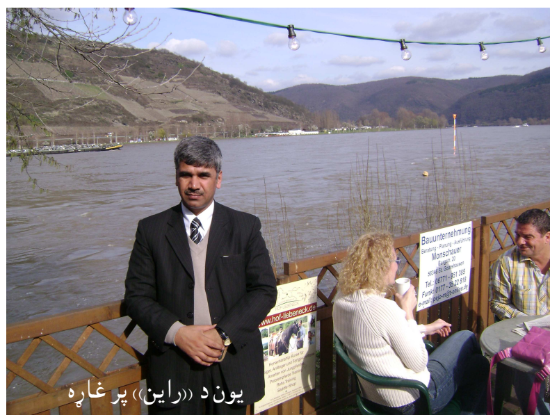
یون د «راین» پر غاړه

کړی او دا سیندونه یې هم رام کړي دي، دلته د هر څه لپاره یو قانون شته، همدې قانون دا ټولنه مهار کړې او لانز مه کړې ده. دوی ددې سیند شاوخواوې داسې جوړ کړي، چې خطر نه پېښوي او د