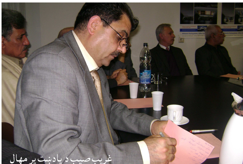
غريب صيب د يادښت پر مهال

نړيوال سازمانونه په افغانستان کې خپل دفترونه او نمايندگۍ لري، خو په دې برخه کې هم نيمگړتيا داده، چې د افغانستان سياسي نمايندگۍ لاهم د يوه تنظيم په لاس کې دي او د افغانستان د ملي گټو بنسټکارندويي نه شي کولای. سربېره پر دې يو شمېر نړيوال سازمانونه د افغانستان د ملي گټو پر خيال نه ساتي او همدا راز د گاونډيو هېوادونو پر وړاندې د افغانستان بهرنی سياست غښتلی نه دی.