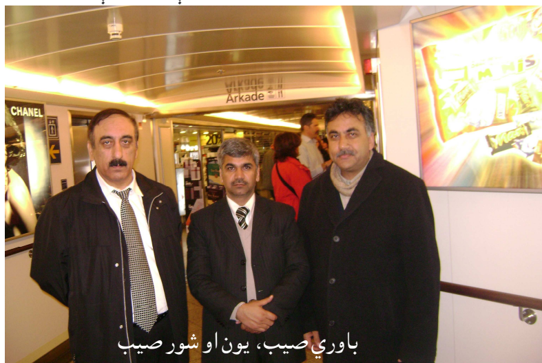
باوري صيب، يون او شور صيب

دویم پورته پورته شو، خورا لوکسه کښتۍ وه، هوټل، د اتیکو او نورو شیانو خرڅلاو پلورنځی و، د ناستې ځای یې درلودل، د