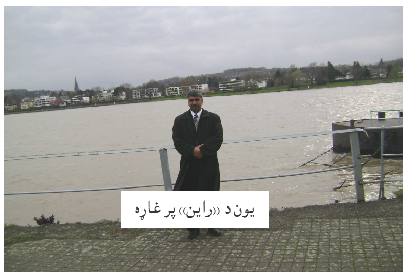
يون د «راين» پر غاړه

ترهغه وروسته سيداغا ماما وويل: راځه د راین غارو ته لاړ شو.