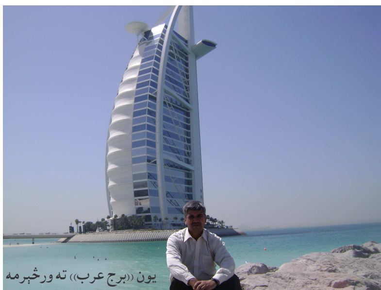
یون ((برج عرب)) ته ورڅېرمه

او امریکایان بنکار بدل، له ځینو سره خپلې مېرمنې یا اندیوالې او ځینو سره د کور نور غړي وو، پر یوه مېز کېناستو، سم له لاسه خدمتگار راوړاندې شو او د ډول ډول مشروباتو ست یې وکړ،