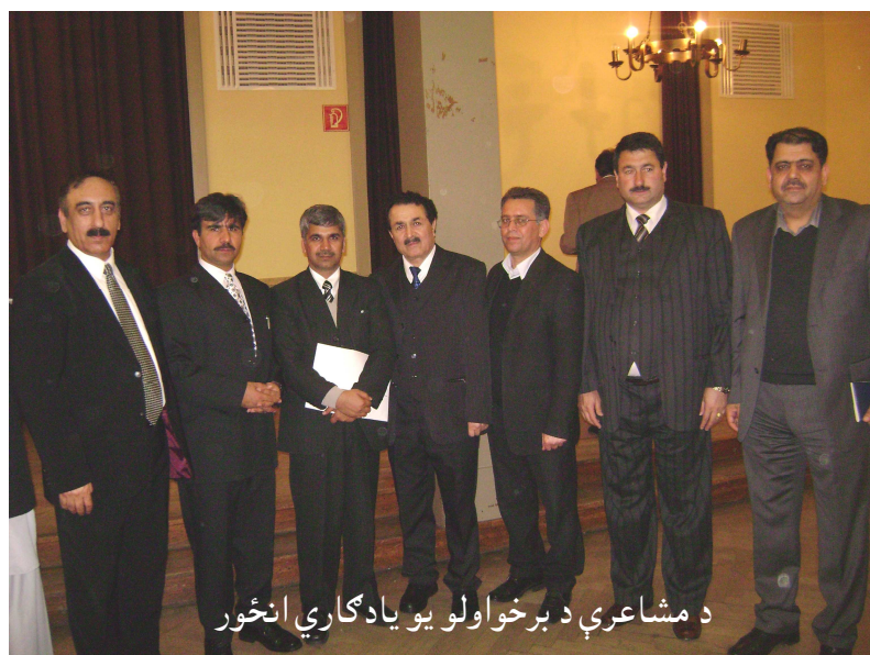
د مشاعرې د برخوالو یو یادگاري انځور

تکرار نه کړو. اوس افغانستان د گرمو ذهنونو او نظرونو د سپښت په مرحله کې دی، دا بېرې باید په ښه ډول خپله لازه ووهي او تردې وروسته د یو ایډیال نظام د جوړولو په فکر او لټه کې شو. دولت جوړونه او د هغه استحکام یوه اوږده پروسه ده، چې باید په دقت