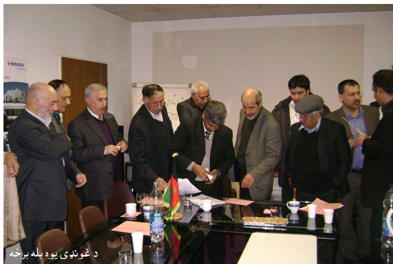
د غونډې یوه بله برخه

❖ د جمهوري ریاست او ملي شورا ټاکنې تر سره شوي، دا ټاکنې هم د ولسواکۍ د تمثيل يوه بڼه بېلگه وه، چې خلک دې په خپله خوښه خپل استازي وټاکي، خو دې سره سره په دواړو ټاکنو کې یو لړ نیمګړتیاوې وې. په تېره بیا په پارلماني ټاکنو کې، پر درغلی سربرېره (۳۱۵) هغو جنګسالزانو او جنایتکارانو ته په ټاکنو کې د کاندیدۍ حق ورکړ شو، چې تر دې دمخه په تور لست کې شامل وو. تر انتخاباتو وروسته د دوی یو زیات شمېر د «مشروعیت» تر پردې تېر شول او اوس ان په ملي شورا کې د خلکو پر برخليک لوبې کوي.