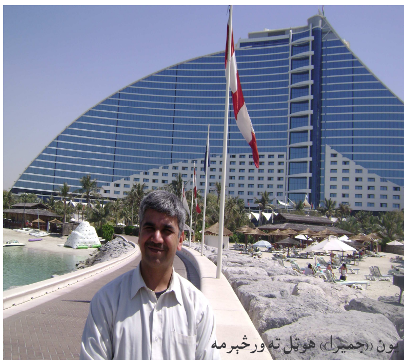
بون «جميرا» هوتېل ته ورڅېرمه