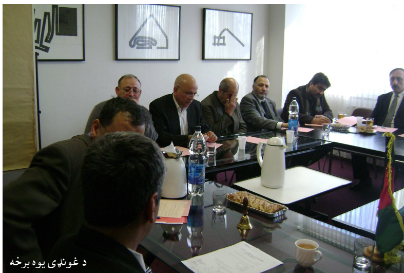
د غونډې يوه برخه

غواړم تاسو ته ناپېيلې معلومات وړاندې کړم، هغه هم هغه معلومات چې ما سره شته، کېدی شي تر زیاته بریده دقیق وي، خو بیا هم سل په سلو کې یې د دقت ادعا نه کوم، له دې خبرو څخه مې هدف دادی، چې کله کله قضاوتونه د پېښو پر واقعیت ولاړ نه وي، نو په همدې وجه واقعیت ته صدمه رسي او عدالت تر پښو لاندې کېږي.