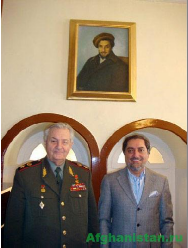
روسی جنرال وارپنیکوف په کابل کې له عبدالله عبدالله سره، ۲۰۰۸ ز کال. دی د مسعود تر عکس لاندې عکس اخیستل د خان لپاره یو ویار بولي.