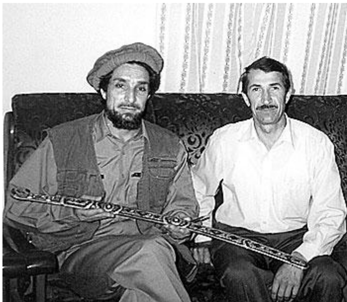
احمد شاه مسعود او د روسي څارگری (کې.جي.بي) ډگروال رينات تيمبروويچ امينوف، د ۱۹۹۸ ز کال د جولای میاشت.